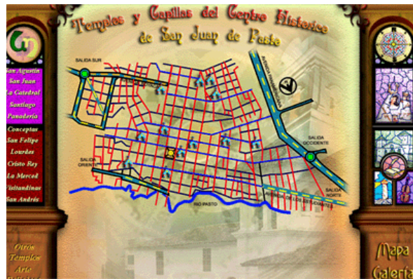
Figura 3. Menú principal

En el panel central, se encuentra un mapa del Centro Histórico de san Juan de Pasto elaborado en Corel Draw, en el cual sobresalen las capillas y templos, botones realizados en Photoshop que también conducen a las diferentes paginas que el usuario desee visitar y en la parte inferior una ficha técnica que se muestra, indicando el nombre del templo o capilla, su patrono, fiestas patronales, ubicación, horarios de eucaristías para dar al usuario una mayor claridad.