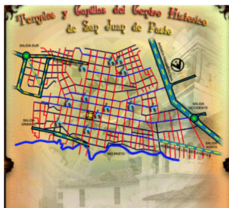
Figura 4. Panel central

Además, en el mapa ya mencionado se visualizan las calles y carreras a medida que se señala el icono.