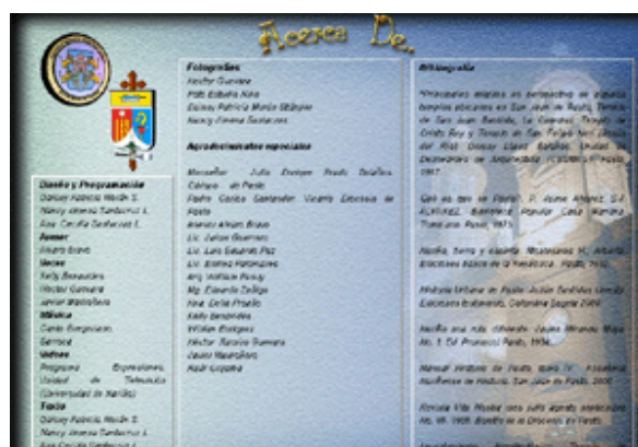
Figura8. Acerca de..

GALERIAS: Este botón conduce a la página de galerías donde se encuentra los videos, fotografías y glosario que es la recopilación de todo el material empleado, el cual esta clasificado de acuerdo a cada uno de los templo y capillas.