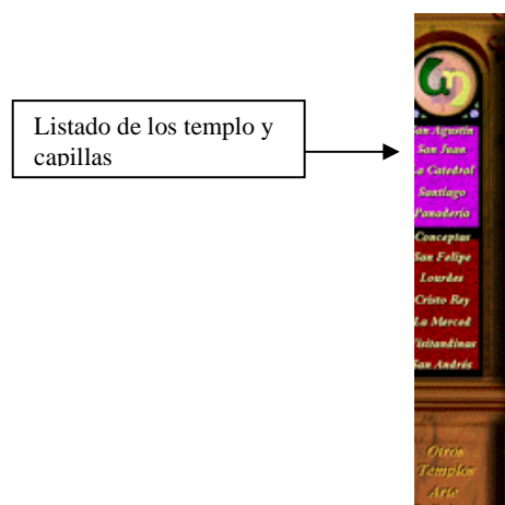
Figura 5. Panel Izquierdo

En la parte inferior se encuentran dos opciones llamadas: Otros Templos y Arte religioso, los cuales conducen a su correspondiente pagina.