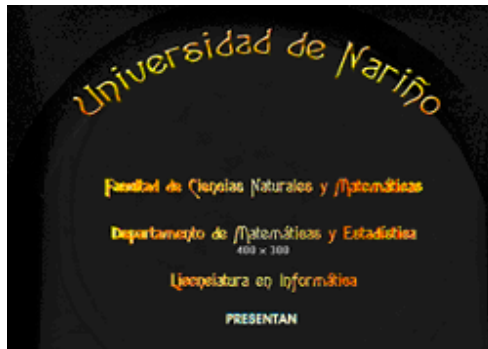
Figura 2. Animación cúpula interna