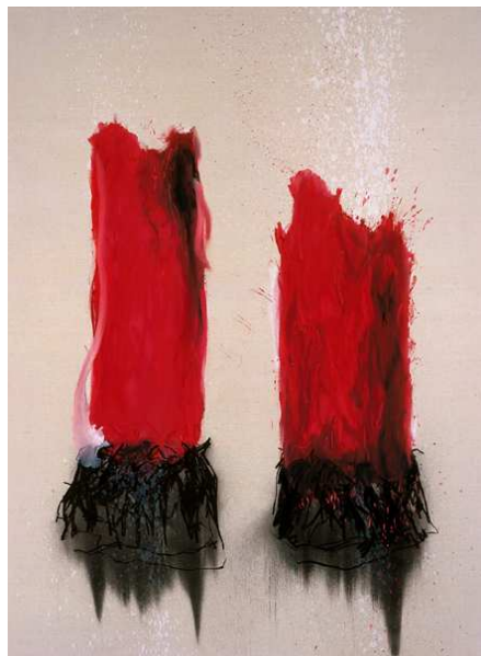
Imagen 1. Suspense, 2004, Catherine Viollet

tener una idea de la moda y la funcionalidad. El cuerpo es de nuevo de que se trata esta vez, pero está ausente. Hoy en día, Jean-Charles Blais realiza tablas numéricas, mientras prosigue su reflexión sobre el cuerpo. El carácter técnico de estas hojas de cálculo, de soportes de grabación en formato DVD, implica una forma de exhibición o difusión de pantallas de proyección. El diseño y la ejecución de las obras utilizando la tecnología digital para dedicarse a las artes visuales un cambio profundo, el concepto de la desmaterialización y la multiplicidad, las herramientas para editar y ver el cambio en la naturaleza, la relación del público el objeto de arte están molestos aquí.