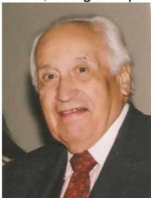
Otto Morales Benítez*

El Maestro Otto Morales Benítez nació en Riosucio 6 , Caldas 7 , en una región donde, al igual que en otros lugares de América, el mestizaje se desarrolló prolíficamente debido a la confluencia del negro, el indígena y el blanco —el negro que llevaron para explotar las minas de Zupia y Marmato, el indígena que ahí habitaba y el blanco que llegó a colonizar esas tierras—, mezcla con la que este pensador creció en su pueblo y que pudo palpar desde muy temprana edad, lo que le permitió estructurar su pensamiento sobre América Latina, lo que después él denominaría en el transcurso de su vida intelectual como Indoamérica, término que adoptó de otros pensadores para poder denominar de otra forma a esta región y conceptualizar el mestizaje. Este personaje ha enfatizado mucho en el rescate de la identidad latinoamericana.