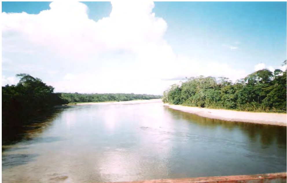
Imagen 4. Río Guamuéz

4.3.2.2. Geográfico. El municipio Valle del Guamuéz limita, al norte con el Municipio de Orito, al Oriente con el Municipio de Puerto Asís, al sur con el municipio de San Miguel y la república del Ecuador, al occidente con el Departamento de Nariño, tiene una extensión de 841 Km 2 que corresponden al 3.37 % del departamento del Putumayo, se sitúa alrededor de su cabecera municipal denominada La Hormiga, la cual está localizada aproximadamente a los 0 grados, 33 segundos de latitud norte y 76 grados, 41 segundos de longitud al oeste de Greenwich, a una altura cercana a los 280 metros, sobre el nivel del mar y a 190 kilómetros de Mocoa vía terrestre. Su relieve es plano ligeramente ondulado, conformando un paisaje de terrazas y lomerío, la temperatura promedio es de 28 grados centígrados, lo que junto a una precipitación anual de cerca de 3600MM, genera una humedad atmosférica constante y relativamente alta. El Valle del Guamuéz se encuentra marcado entre los ríos Guamuéz, La Hormiga y San Miguel. Es un amplio valle al pie de las serranías del Patascoy.