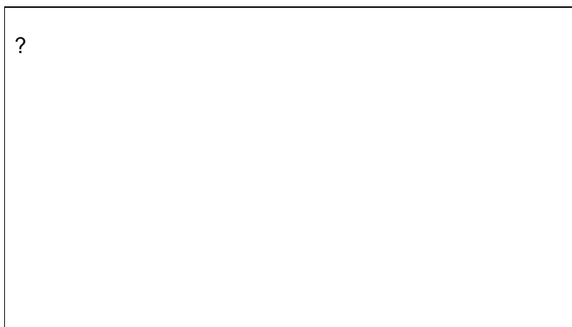
Imagen 1. Proyectos productivos demostrativos

El proyecto pedagógico productivo de la huerta integral será sostenible si supiera entonces los momentos, transitorios por definición, serán sostenibles en la medida