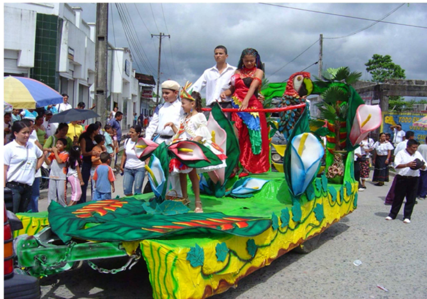
Imagen 6. Fiestas Colombo – Ecuatorianas

Cada año se celebran las fiestas y ferias municipales los días 12, 13, 14 y 15 de Noviembre, en las que se integran Colombianos y Ecuatorianos haciendo muestra de sus culturas y espíritus entusiastas que permiten el goce a través de eventos culturales donde se perciben ambientes, sanos, alegres y contagiantes, animando a toda la región a participar de ellas, es pertinente mencionar que en estas fiestas se integran personas del interior del país donde se muestran las culturas de cada región a través de las colonias.