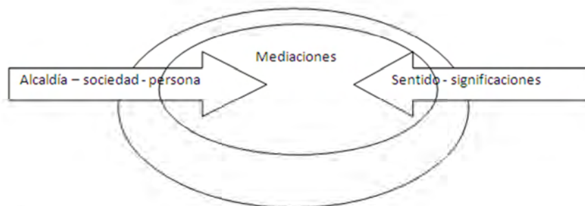
Figura 1. Mediación Didáctica

Por consiguiente la mediación es una construcción personal y social ante los enunciados de la teoría y la práctica, donde se encuentran la experiencia, la apropiación y el aprendizaje.