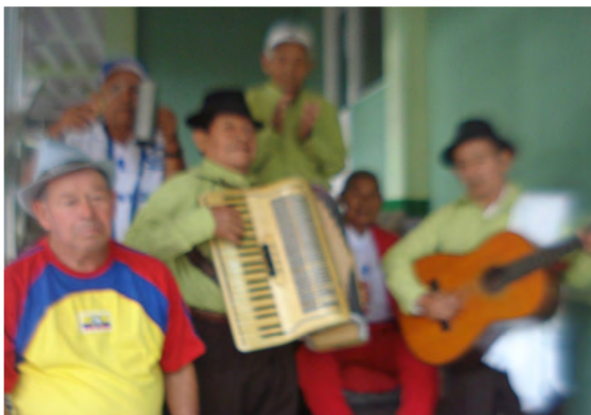
Imagen 7. Músicos regionales

Se cuenta con una junta municipal de deportes, que se reúne esporádicamente, está en capacidad de manejar los recursos que le corresponde por ley, cuenta con personal técnico idóneo en las diferentes ramas deportivas para que los niños y jóvenes practiquen con una Fundamentación debida, llevando acabo en el transcurso del año torneos en algunas ramas, categorías y modalidades deportivas como son: municipal de fútbol, categoría libre, ínter escolar de fútbol a nivel de núcleos, categorías sub catorce, ínter colegiado de fútbol sub. diecisiete,