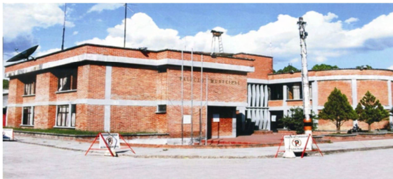
Imagen 5. Alcaldía Valle del Guamuéz.