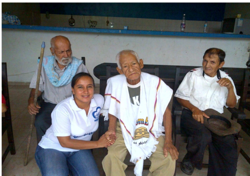
Imagen 11. Habitantes casa hogar descanso primaveral

La financiación de los centros vida se hacen a través de un recaudo porcentual que los municipios y departamentos recaudan a través de estampillas.