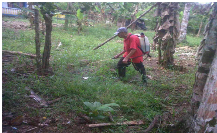
Imagen 10. Proceso de fumigación

EL CENTRO VIDA DESCANZO PRIMAVERAL ofrece los siguientes servicios en beneficio de esta población: Alimentación, orientación sicosocial, atención primaria en salud, aseguramiento en salud, capacitaciones productivas, deporte cultura, recreación y encuentros generacionales.