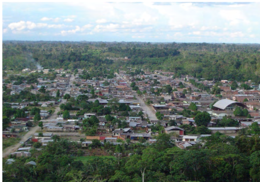
Imagen 3. La Hormiga

La historia del municipio ha estado determinada por las bonanzas extractivas de diversos productos, como: agrícolas, pecuarios y minerales, las cuales proporcionan alimento y sustento económico para los pobladores de esta región. Además la religión, por medio de misioneros evangelizadores e inversionistas foráneos han conformado una poderosa integración colonizadora. Fue así como entre 1940-1980 a raíz de la bonanza del caucho se incrementó el flujo colonizador y se establecieron las grandes haciendas en las orillas de los ríos Putumayo y Napo (Ecuador), los cuales proveían de alimento a las caucheras.