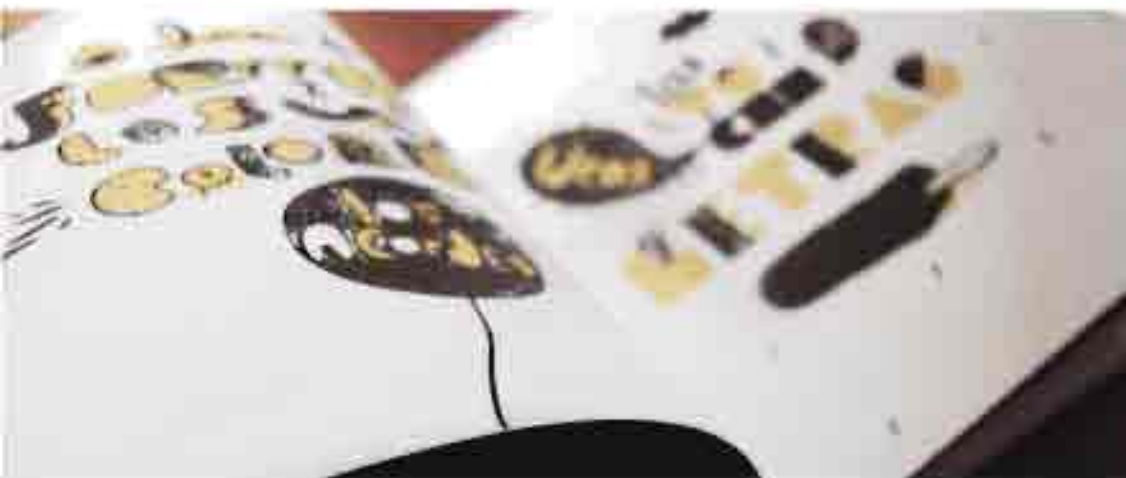
Figura 1. Construcción

Cuando se busca un texto desafiante, el ojo del lector se sentirá atraído hacia una tipografía que evite los patrones discernibles, que son las convenciones del compromiso entre autor y lector. La tipografía experimental, dispuesta de manera nada convencional, ralentiza la lectura, porque requiere una participación consciente. Comparémoslo con la lectura convencional, un proceso tan predecible, que el lector no es consciente de lo que pasa. Ni cómo ni por qué. El tipo experimental no puede ser convencional y, por tanto, siempre exigirá más al lector.