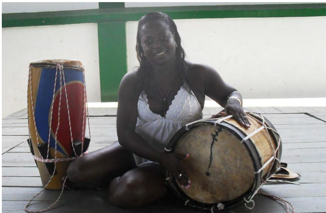
Figura 5. Foto de Instrumentos típicos de percusión. Bombo y cununo.

El presente capítulo muestra el análisis de los datos obtenidos durante el desarrollo de la investigación, los datos fueron recolectados a través de las diferentes técnicas e instrumentos de recolección de información (entrevistas y observación). Una vez aplicadas las técnicas se procedió al vaciado de la información, es decir transcribir cada respuesta de los 25 sujetos que participaron de manera voluntaria en la investigación. Al organizar la información se obtuvo mucho más claridad con relación al tema de investigación propuesto desde un principio. Luego se procedió a transcribir la información más relevante en las matrices teniendo en cuenta las categorías y sub-categorías para así recoger las proposiciones más sobresalientes y posteriormente realizar el análisis y la interpretación de los resultados que se presentaran a continuación mediante los siguientes cuadros que revelan las proposiciones significativas, es decir las que se tuvieron en cuenta para el siguiente resultado.