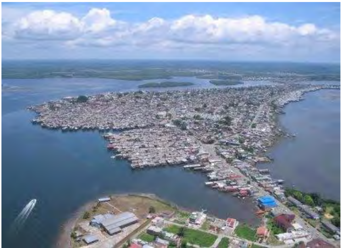
Figura 1. Foto panorámica de San Andrés de Tumaco.

La investigación se realizará en la costa Pacífica, donde se presentan manifestaciones culturales que datan de los siglos XVI y XVII, por ejemplo, los cantos de tipo Gregoriano, Romances y pregones (cantos a capela). Estos cantos son reproducidos por las cantoras de la región en forma de alabaos o cantos de alabanza a Cristo y santos (tonos luctuosos de una marcha fúnebre española cantada a capela 2.) Y los arrullos (cantos acompañados con instrumentos musicales de la región, para apoyar la ascensión al cielo del alma de un niño muerto o para simbolizar esa ascensión; también se cantan para llamar, simbolizar el descenso de un santo desde el cielo) en velorios y chigualos.