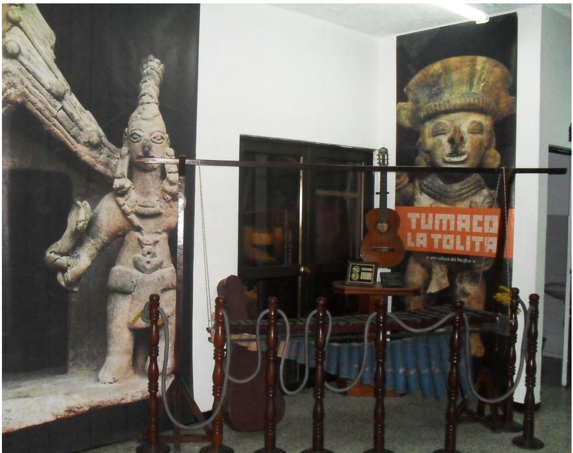
Figura 2. Foto del Museo Casa de la Cultura de Tumaco.

Cultural y socialmente, la música africana ha tenido un rol de fortalecimiento étnico y ha sido una herramienta de auto reconocimiento y resistencia ante la violencia física ejercida desde la esclavitud y la violencia simbólica que se filtra por proyectos modernizadores de invisibilización, desconocimiento y de segregación. Por ello, es necesario abordar estas manifestaciones culturales, como textos con una alta carga social e histórica, que convoca las particularidades de interpretación colectiva y las necesidades particulares de un momento histórico, por lo tanto son pistas importantes para comprender la construcción social de la memoria.