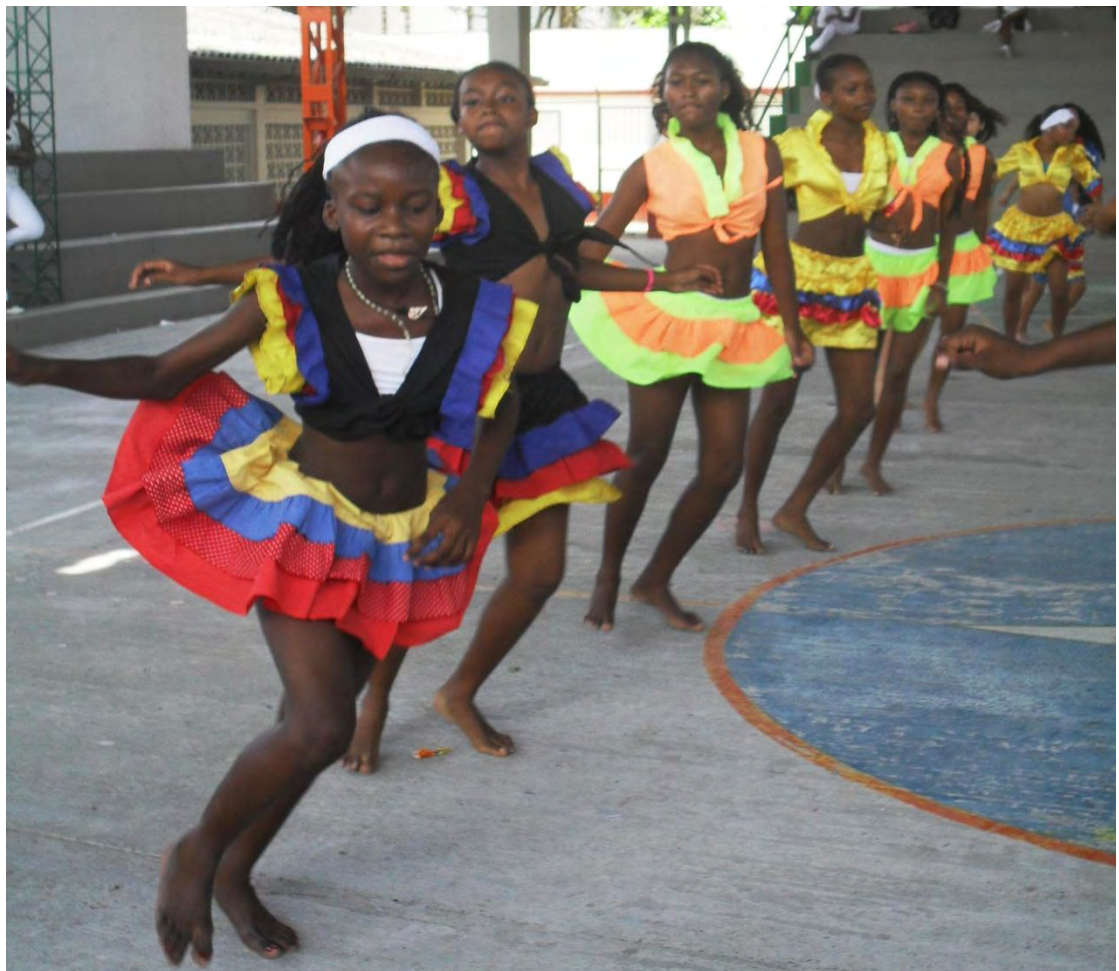
Figura 4. Foto de Estudiantes de la I.E. Misional Santa Teresita danzando.

“Los tres mundos en síntesis se funden en uno y son reales, no son tan dilatados en la concepción de los relatos” 19 . El mundo queda reducido a una pequeña extensión donde hay, digamos, varias dimensiones del existir; así por ejemplo, por más que los personajes viajen a lejuras sin tregua, gastando zapatitos de oro o de hierro, con el auxilio de animales fantásticos, del viento, del sol o de la luna, para regresar no tienen que hacer siempre el mismo viaje, caen en la misma dimensión de donde partieron, al parecer, el viaje es simplemente un ejercicio para iniciarse en la otra dimensión.