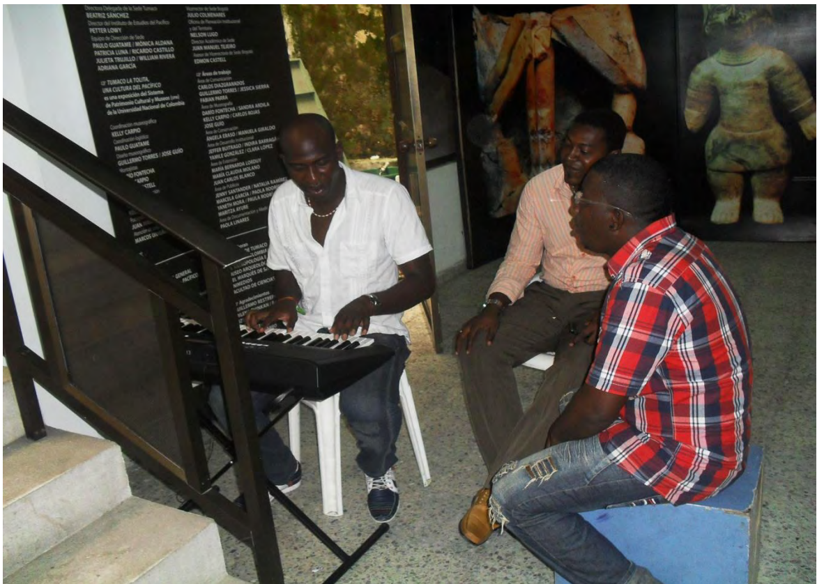
Figura 3. Foto de Jóvenes Artistas Tumaqueños.

Existe también la ley general de cultura 1997, donde especifica el uso de las diferentes manifestaciones o expresiones políticas, culturales entre otras. Para verificar el cumplimiento de las leyes establece o crea en 1993, el ministerio de cultura como ente exclusivo de las políticas culturales 7 .