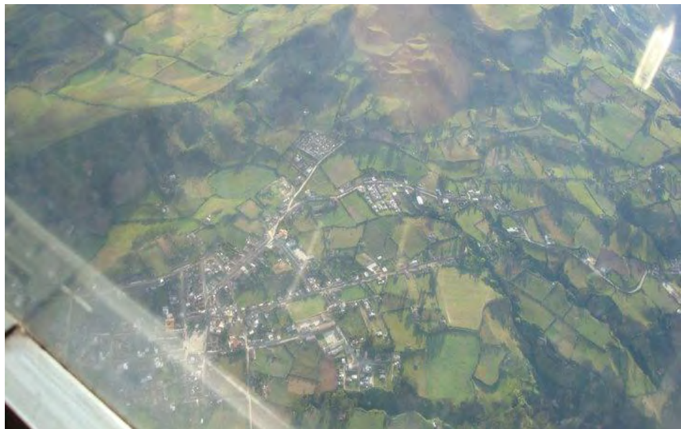
Imagen #1: Panorámica aérea municipio de Funes