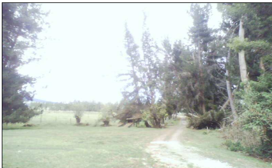
Figura 13. Entrada a “El Corzo” – finca recuperada por los indígenas