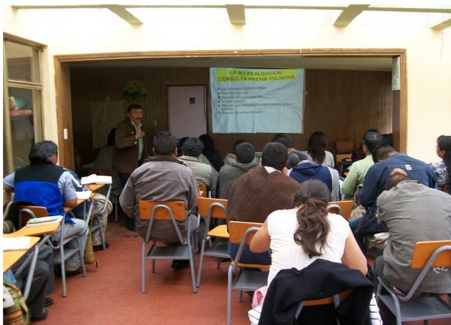
Figura 22. Taller sobre Consulta Previa en la Escuela de Derecho propio

Según el gobierno es un obstáculo para el desarrollo, porque si es llevado a cabo de manera adecuada impide su acceso a los territorios para su explotación y dominación. Para el desarrollo de la comunidad es importante porque le permite decidir sobre las actuaciones que se den a sus espacios.