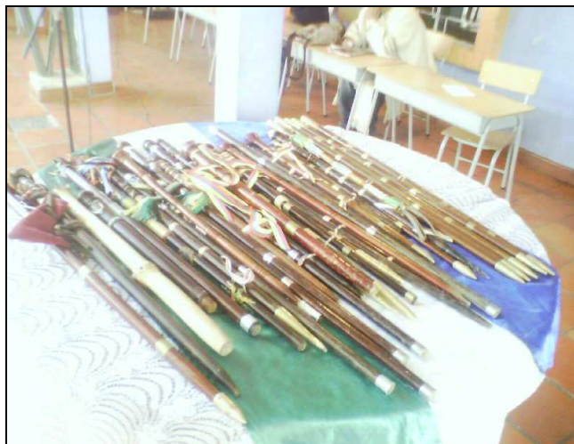
Figura 8. Las Varas de Justicia

En el resguardo de Guachucal se vienen ejerciendo usos y costumbres propias a través de signos y símbolos, como la insignia de las autoridades, que pueden ser elaboradas de madera de chonta, rosa o arrayán. “Consta de una corona cuyo significado es potestad y autoridad, una argolla que significa la riqueza de nuestra madre tierra, un Cristo como signo impuesto de religiosidad, tres anillos que significan el padre, hijo y espíritu santo como signo de justicia divina, un casquillo protector de la insignia, medio por el cual existe un contacto directo con la madre tierra 54 .