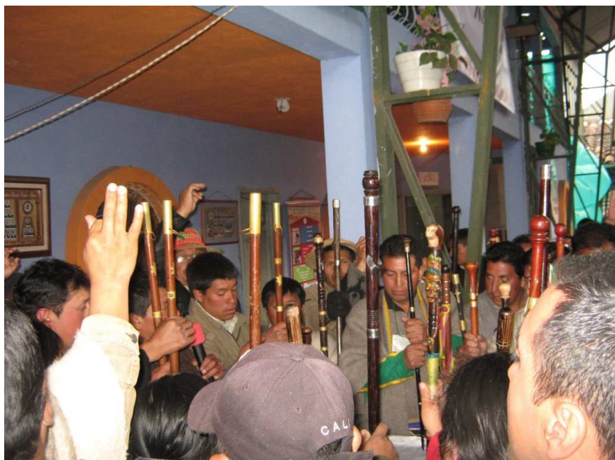
Figura 18. Autoridades de los cabildos del Pueblo de Los Pastos