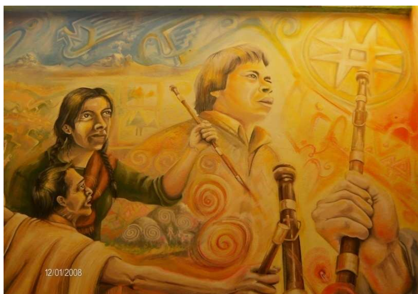
Figura 3. La lucha por la tierra

Fuente: Pintura Maestro Carlos Puerres – indígena resguardo de Cumbal. Fotografía ésta investigación.