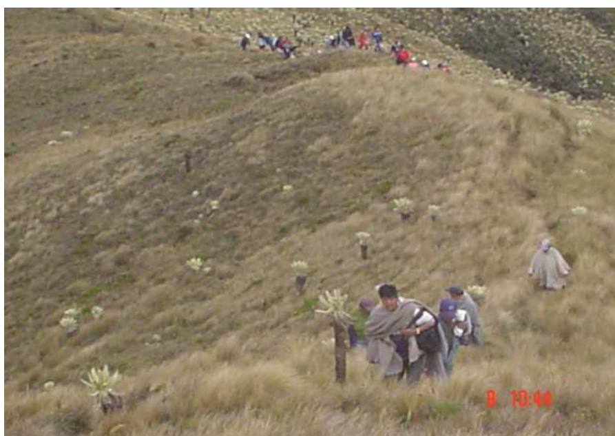
Figura 23. Los recorridos al territorio

A partir de los recorridos al territorio se pueden elaborar los llamados diagnósticos territoriales. Para dar paso al análisis del trabajo a seguir en el resguardo a futuro. En este momento es fundamental la participación de la comunidad, los facilitadores deben dirigir el proceso más que todo hacia el logro de la obtención de información adecuada.