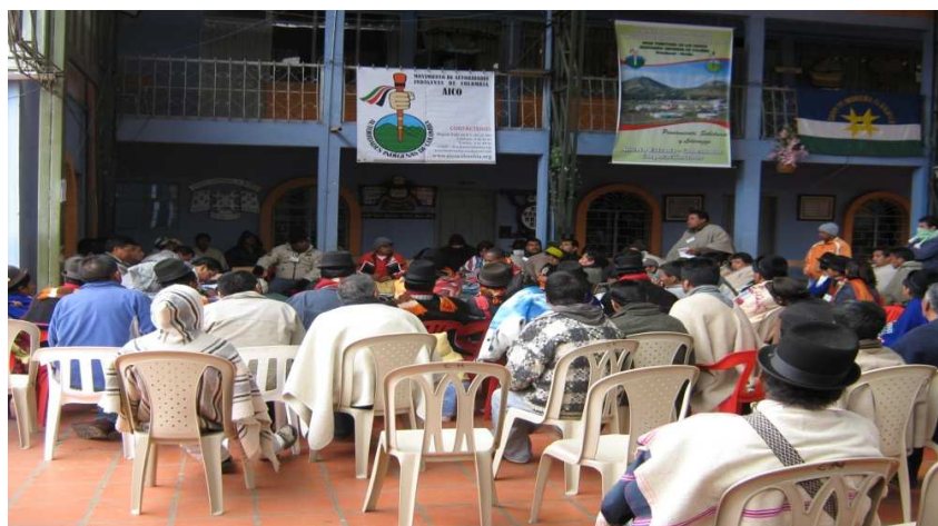
Figura 21. Mesa de trabajo en la asamblea Nacional del Movimiento AICO

❖ Mesas de trabajo. se desarrollan en las mingas de pensamiento, la comunidad se distribuye por temáticas según considere puede aportar. Después se hace una socialización a toda la asamblea para la toma de decisiones. Permite intercambiar saberes, experiencia y análisis de ciertos temas con mayor profundidad puede participar toda la comunidad, niños, jóvenes, adultos, mayores, sabedores. En las mesas de trabajo se toman decisiones y compromisos que son llevados a consideración de la asamblea. Por ejemplo se puede citar a una minga de pensamiento para la elaboración del plan de vida, se conforman mesas de trabajo en educación, territorio, medicina tradicional.