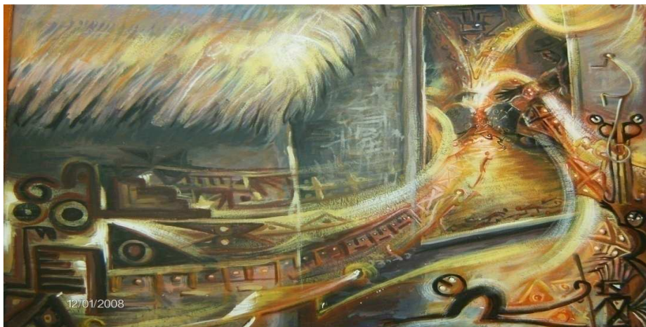
Figura 20. La Tulpa, un espacio de encuentro y conocimiento

Fuente: Pintura Maestro Carlos Puerres – indígena resguardo de Cumbal. Fotografía esta investigación.