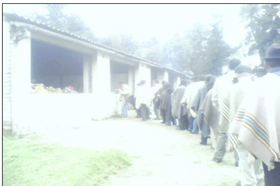
Figura 17. Entrega de alimentos en una minga de pensamiento

entonces se encontraban mediados por actores o agentes externos. Aquí el actor central fueron los comuneros que generaron, impulsaron y respondieron a todo el proceso. Como grupo social con necesidades insatisfechas y ante la imposibilidad de satisfacerlas se organiza de manera espontánea para buscar alternativas al alcance de sus medios y recursos, existe un proceso de planificación participativa pues son los individuos de la comunidad quienes identifican los problemas y formulan las acciones de solución.