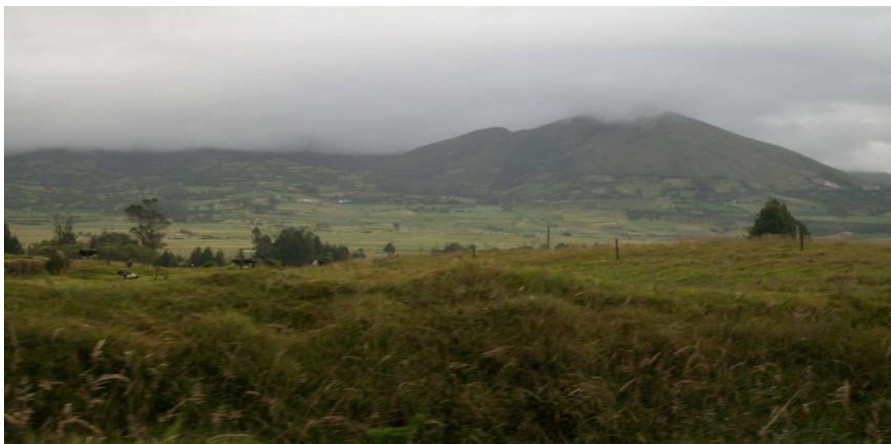
Figura 7. Resguardo indígena de Guachucal