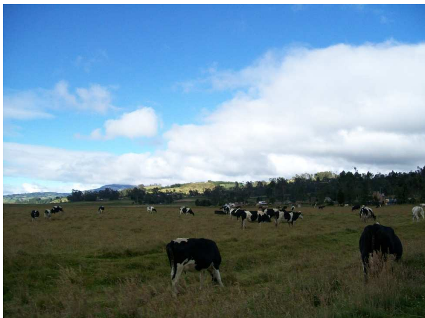
Figura 19. La ganadería, principal actividad económica del resguardo

En Guachucal la economía se basa primordialmente en la ganadería, existe un mercado de ganado que es regional y es una actividad que genera ingresos a la gente que vive del comercio de esta especie. Desde la alcaldía municipal y la Unidad de Asistencia Técnica Municipal UMATA, se han adelantado proyectos que van en concordancia con el Plan de Desarrollo que establece la ayuda a los campesinos e indígenas en cuanto a semillas, fomento de especies menores, se ha hecho entrega de semillas para huertas caseras, pie de cría.