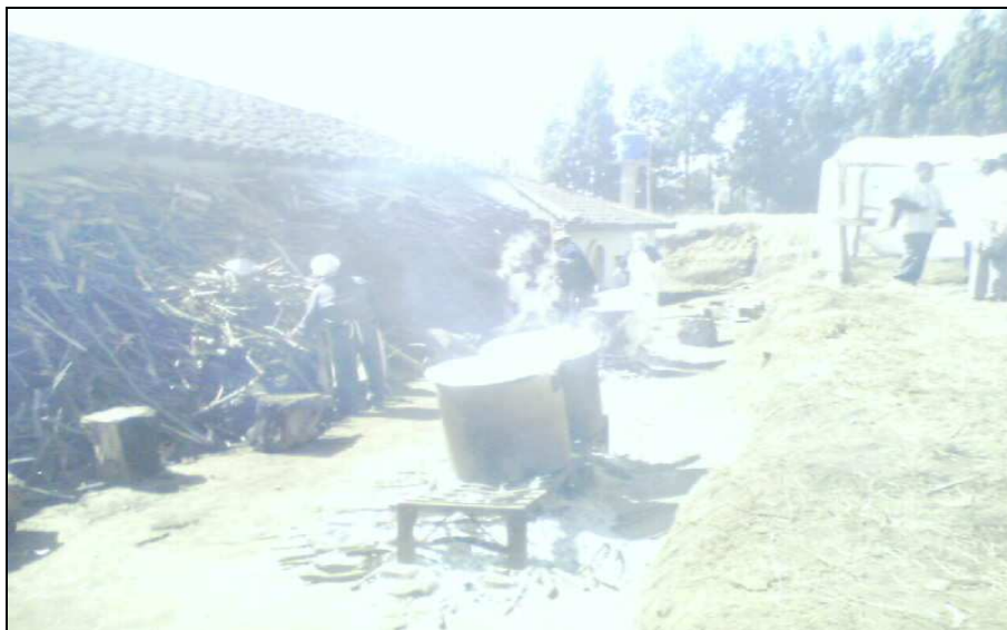
Figura 9. Preparación de alimentos para la minga de pensamiento

✓ Organización social y comunitaria. El territorio ha significado para los indígenas de Guachucal, la organización de su comunidad. Con la recuperación de tierras se fortaleció y unió la comunidad en defensa de su derecho, en busca de poder expresar libremente sus acciones sobre las tierras. “Las personas que encabezaron en ese entonces fueron muy inteligentes porque buscaron formas de reunirnos a la comunidad, en ese entonces el municipio quería cogerse una reserva que tenía al cabildo que lo llamaban el común de juntas, por medio de eso la comunidad se organizó para no dejar que el alcalde se haga dueño, de ahí nació que el cabildo se defendiera del alcalde que hacía mal uso de la tierra, entonces los del cabildo dijeron que hay que ir a limpiar, sacar la basura de los drenajes, a zanjar y ahí se esa forma nos organizan y nos llaman a la comunidad. La gente acudió a la minga de pensamiento de cómo defenderlo, se asignó por parcelas por familias para que usufructuaran y le pusieron cercos, postes, barreras vivas de matas, árboles, ya cambió la forma de administrarlo porque ya fue por familias, y se fortaleció la organización” 55 .