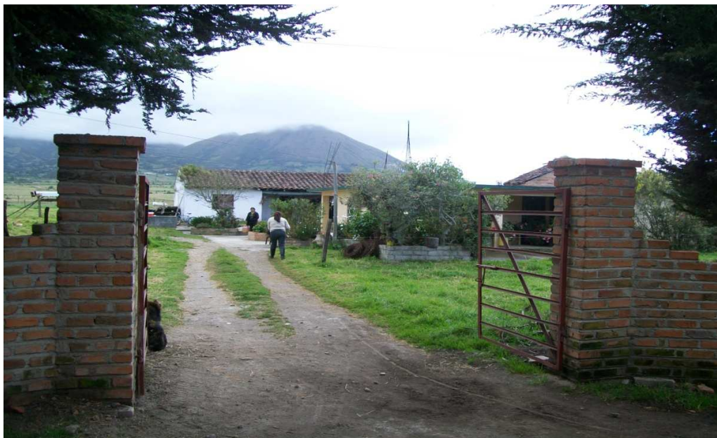
Figura 16. Casa de Laureano Inampues