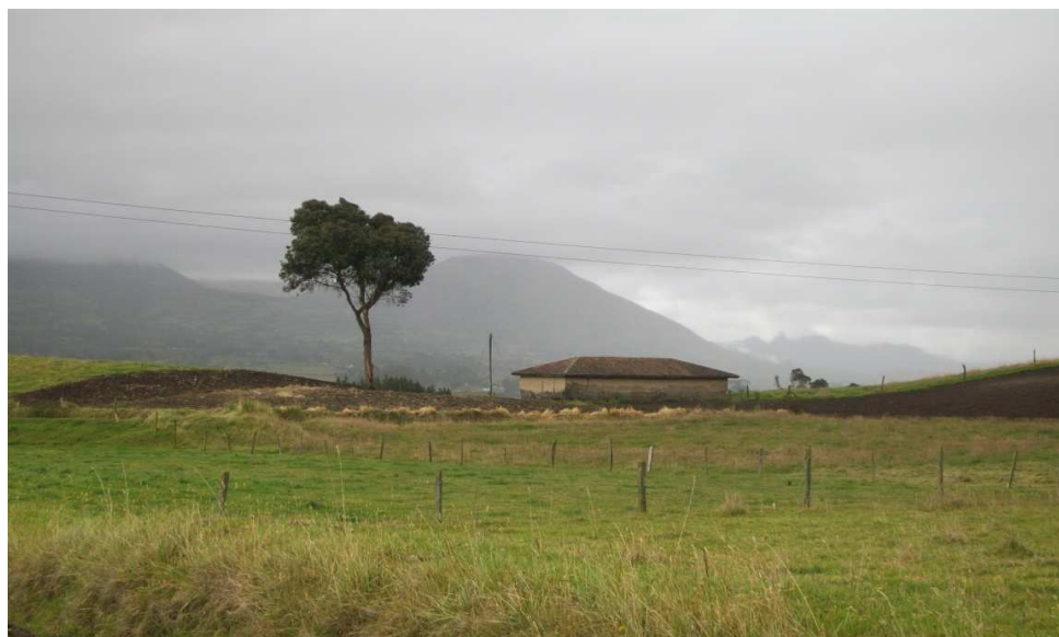
Figura 12. Las energías de los tres mundos