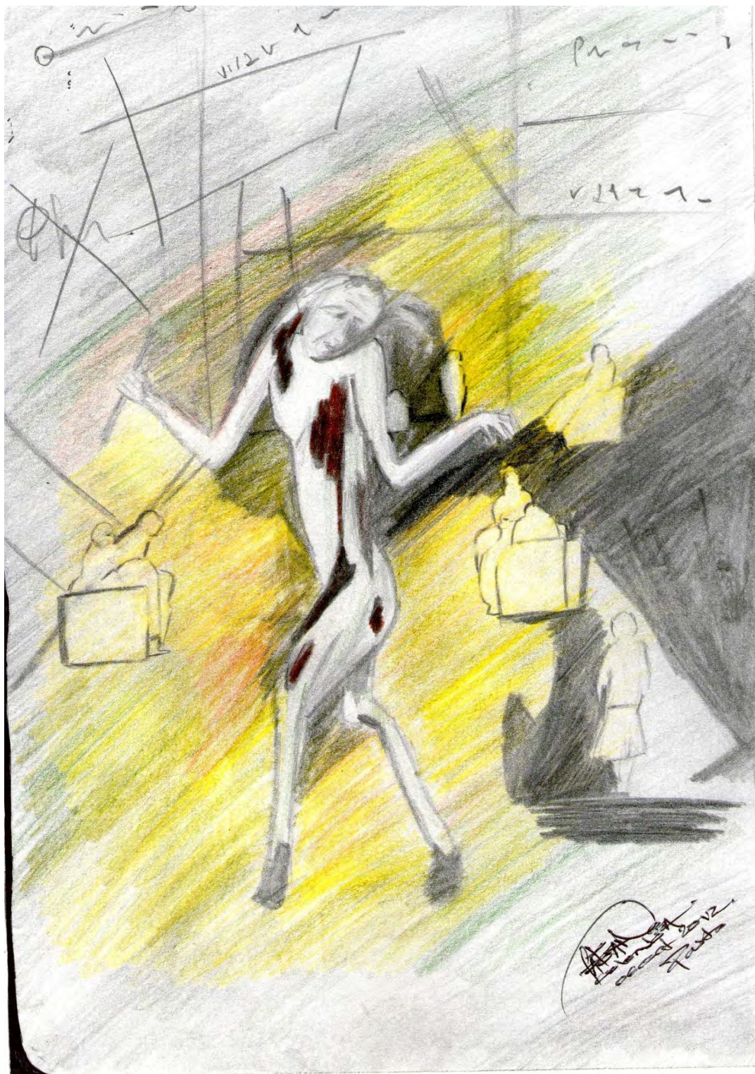
Figura 1. Locura