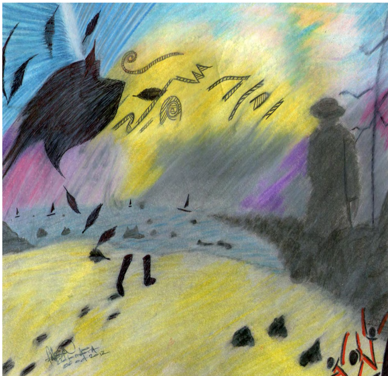
Figura 2. Crepuscular