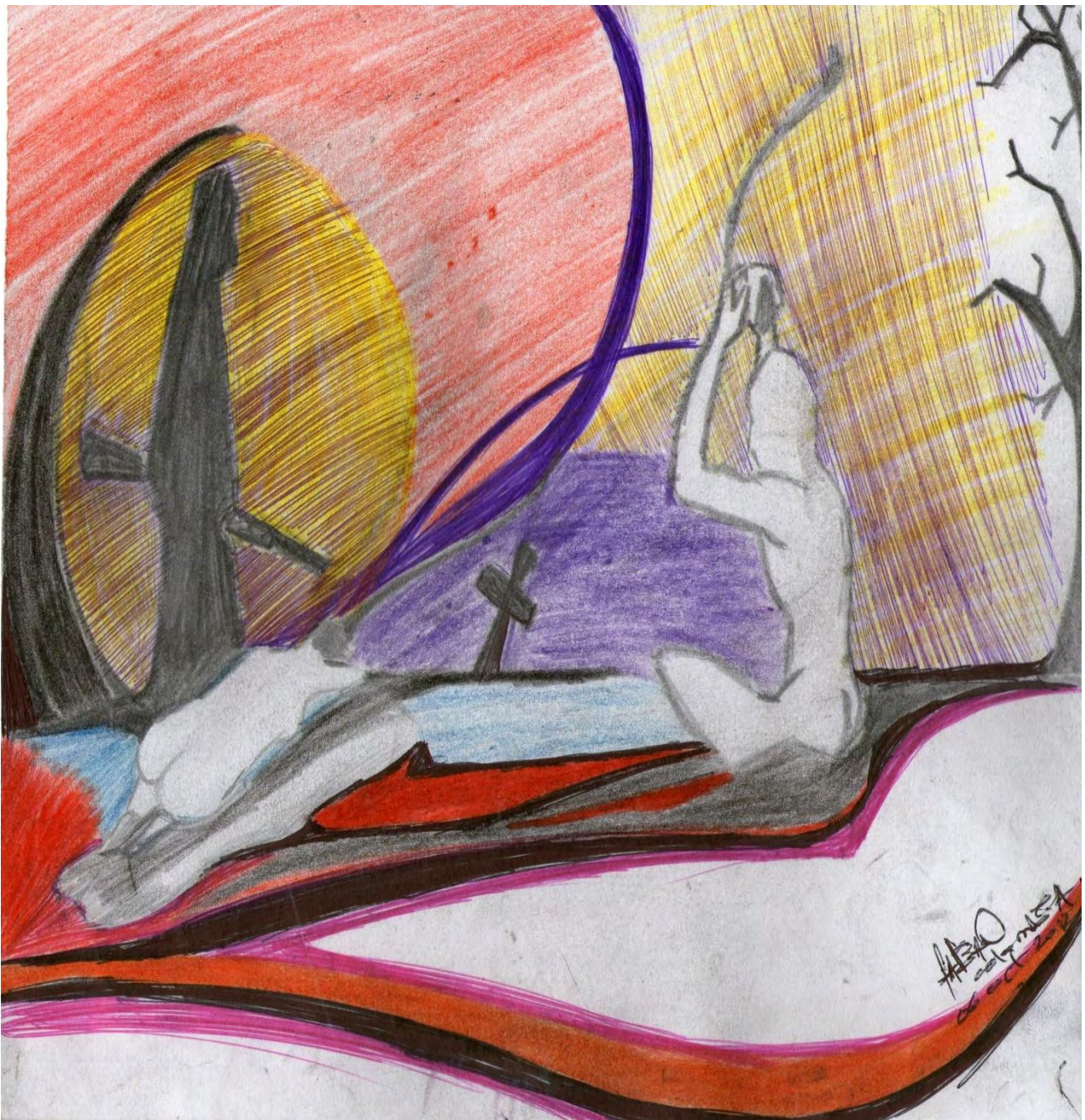
Figura 5. Lo humano