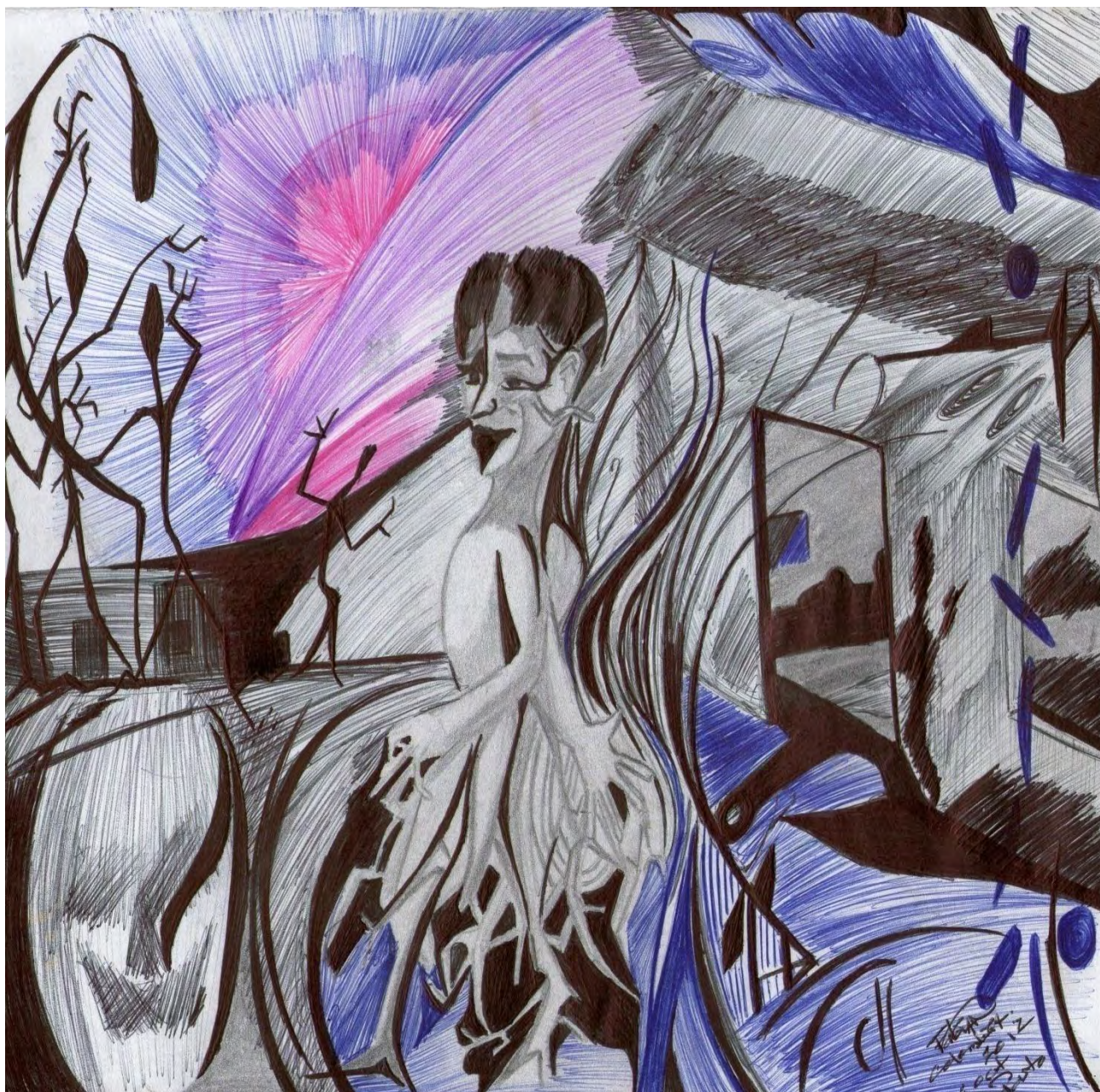
Figura 4. Horizonte