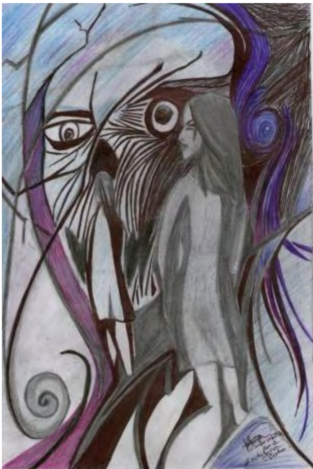
Figura 3. Negra sombra