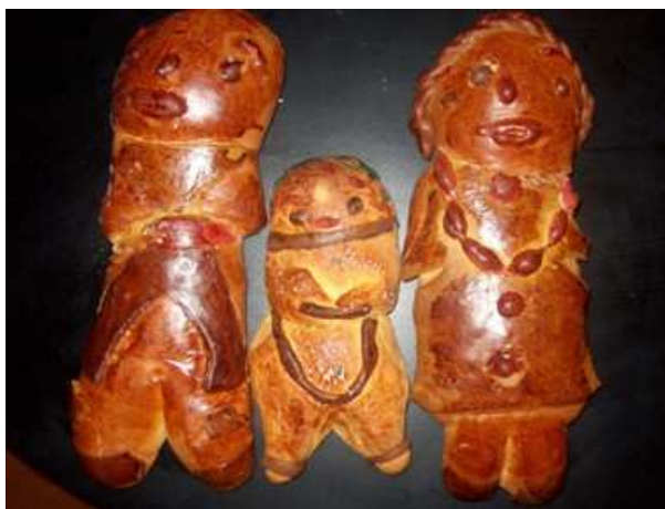
Figura 4. Guaguas de pan corregimiento de Obonuco-Nariño