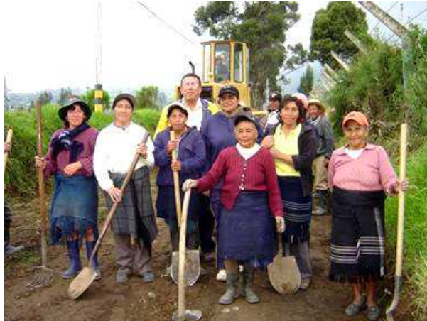
Figura 1. Comunidad campesina de la zona