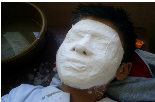
Figura 15. Taller lúdico: construcción del YO, mi máscara

Ya el juego se convierte en una relación social infantil donde se interactúa y coordinan intereses mutuos, en las que los estudiantes adquieren pautas de comportamiento social a través de los juegos, especialmente porque son relativamente de la misma edad y el mismo estatus social, con los que comparte tiempo, espacio físico y actividades comunes. Además, el niño aprende a sentir la necesidad de comportarse de forma cooperativa, a conseguir objetivos colectivos y a resolver conflictos entre individuos.