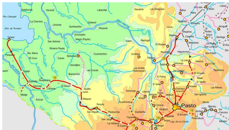
Figura 2. Mapa municipio de Pasto