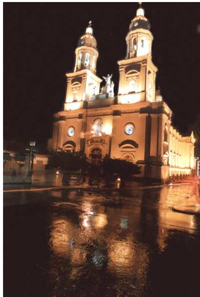
Figura 6. Catedral de Pasto-Nariño