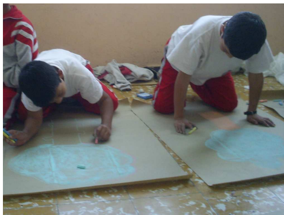
Figura 17. Trabajo de expresión dibuja el cuento

Al inventar un final al cuento el docente sedució al niño a tener atención a la lectura o narración realizada ya que está actividad dejaría inconcluso el final con el fin de que cada uno de los niños, elaborará un final diferente para el mismo.