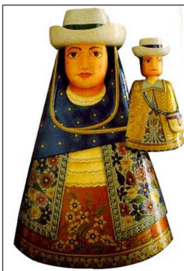
Figura 5. Artesanía en Madera y Barniz de Pasto