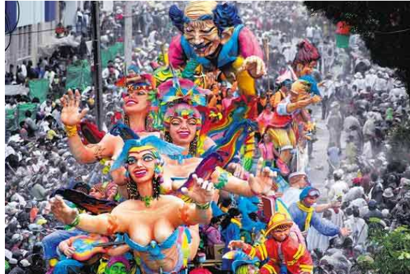
Figura 3. Carroza presentada el seis de enero en los carnavales de Blancos y Negros