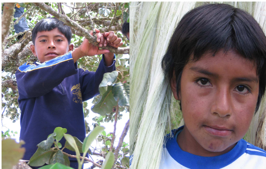
Figura 8. Población vulnerable atendida por la Fundación Allpayana