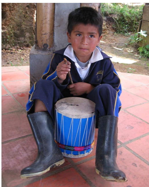
Figura 9. Comunidades campesinas que reciben las capacitaciones de la Fundación