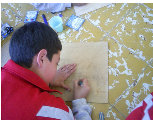
Figura 14. Trabajos con dibujo

La propuesta pedagógica permitió fortalecer las habilidades básicas comunicativas como fueron: leer, escribir, escuchar y comprender. La estrategia dejó entrever como se relegó el juego tradicional donde los estudiantes presentaban actitudes agresivas, competitivas e individualizadas; con la aplicación de la propuesta en cierta medida organizaron sus propias actividades lúdicas de manera más disciplinada. El desarrollo de las clases en forma planificada, organizada y dirigida a través del juego alcanzó nuevos saberes y superó el débil proceso de socialización. Por consiguiente el estudiante se vio abocado a explorar actividades lúdicas organizadas desde la misma presentación del juego, sus normas y roles de respeto, liderazgo cooperativo y situaciones concretas referentes a la convivencia.