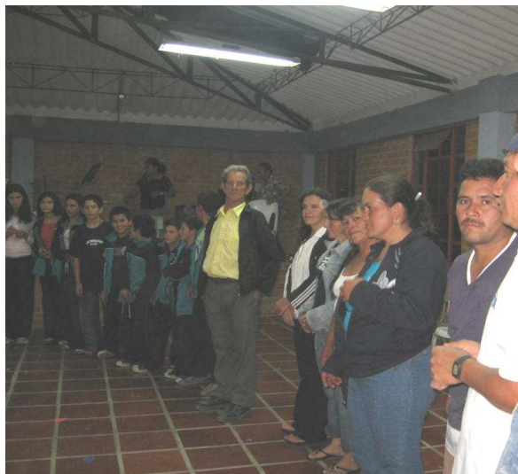
Figura 10. Trabajo con la comunidad