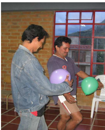
Figura 11. Trabajo lúdico con la comunidad

2.3.1 Las normas morales como expresión de los valores morales. Sin asumir posturas pesimistas o cínicas, sino propositivas, es necesario reconocer una realidad: en gran medida el comportamiento de la sociedad indica que se están dejando de asumir los valores morales, y en cambio se introyectan otros que podemos llamar antivalores, lo cual mina o denigra las relaciones humanas. Las causas pueden ser diversas y combinadas, como: el egoísmo excesivo, la influencia de algunos medios de información, conflictos familiares, padres irresponsables en la crianza de sus hijos, presiones económicas, pobreza, etc.; pero sobre todo el funcionamiento de un Sistema Educativo desvinculado de las necesidades actuales de los ciudadanos. Sin embargo, la formación escolar debe ser el medio que conduzca al progreso y a la armonía de toda nación; por ello, es indispensable que el Sistema Educativo Nacional, concretamente, renueve la curricular y las prácticas educativas del nivel básico principalmente, otorgando prioridad al ámbito problemático referido.