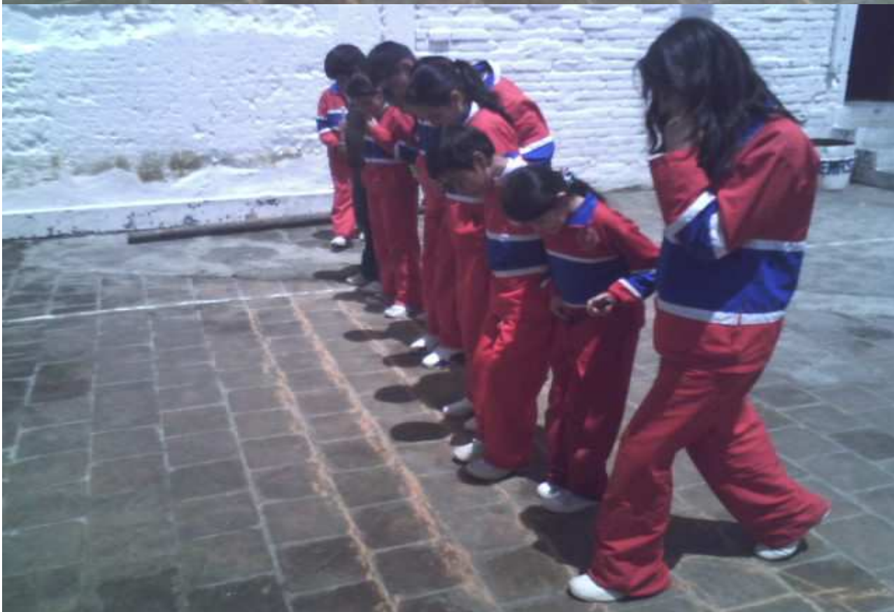
ANEXO M: Grado sexto actividades de refuerzo.