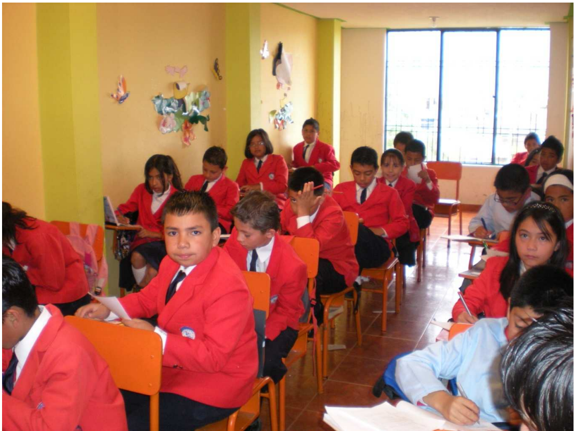
Figura 2. Estudiantes Grado 5º

Este estudio se realizó con los estudiantes de grado quinto de Básica Primaria, grupo conformado por 27 estudiantes, de los cuales 19 son niños y 8 son niñas, cuyas edades oscilan entre los 10 y 11 años.