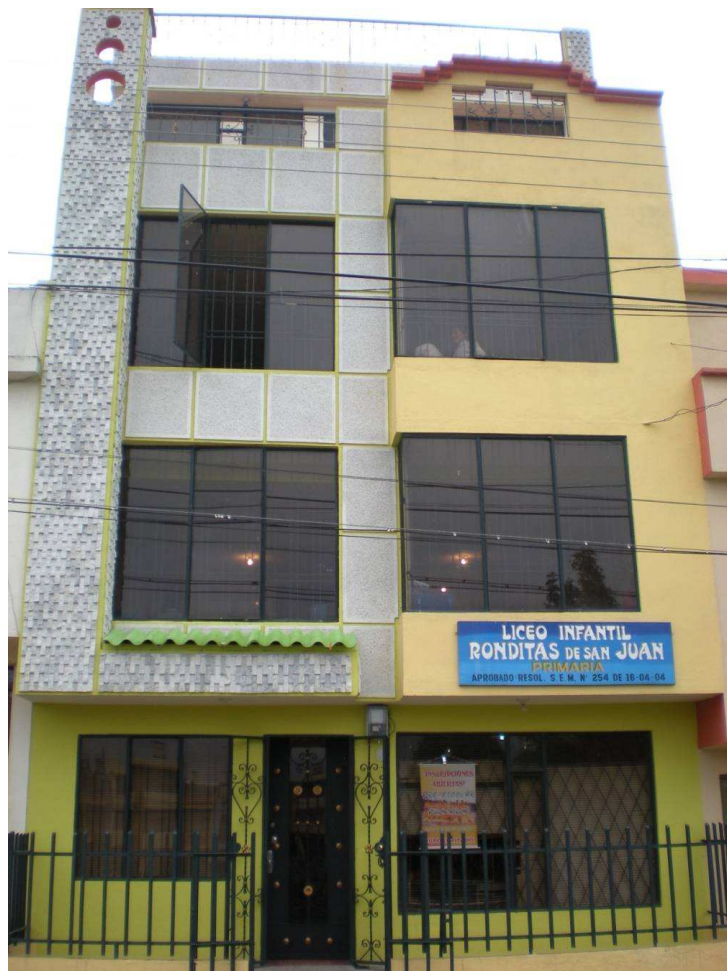
Figura 1. Planta Física de la Institución