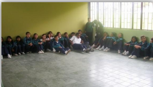
Figura 18. "Conversatorio"