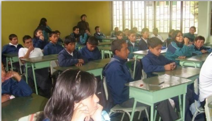
Figura 19: “Observación directa de la clase de Lengua Castellana”

directa: a las 6:45 de la mañana, comenzó la clase de Lengua Castellana, los niños ingresan al aula y empiezan a tomar sus respectivos pupitres, 10 minutos más tarde la profesora ingresa a su clase, dice: -¡buenos días niños! , ellos responden de forma desanimada para lo cual ella les dice: -parece que no han desayunado,