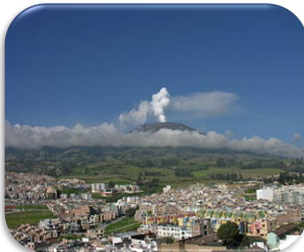
Figura 16. “San Juan de Pasto”