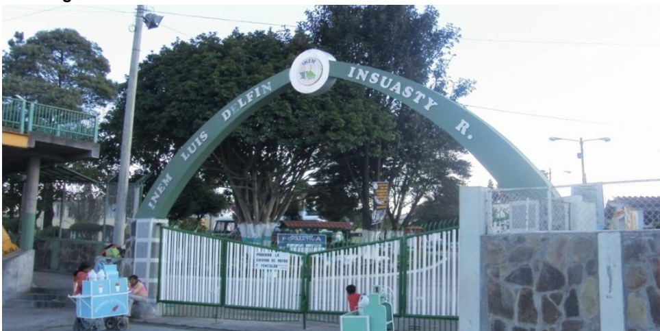
Figura 8. Institución Educativa “Luis Delfín Insuasty Rodríguez INEM” de Pasto.

El colegio “Luis Delfín Insuasty Rodríguez INEM” de Pasto, se fundamentó y orientó bajo la administración ICCE (Instituto Colombiano de Construcciones Escolares) como propuesta innovadora del proceso Administrativo, Pedagógico y comunitario con énfasis en cinco áreas: Académica, con modalidades en Ciencias y Humanidades, Industrial, con modalidades en Electricidad y Metalmecánica, Agropecuaria, con modalidad en Agropecuaria, Comercio, con modalidad en Secretariado al igual que en Contabilidad y finalmente en Promoción Social, con modalidad en Comunidad.