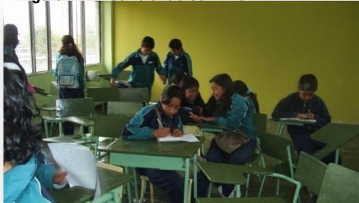
Figura 14. "Escribiendo con Pilo"

La escritura es otra forma de plasmarla cuando no se quiere recurrir al sonido, es un instrumento que también permite conocer la voz oculta.