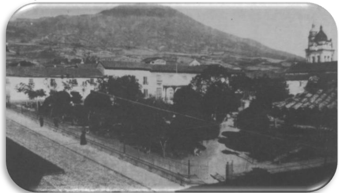
Figura 2. Panorámica de San Juan de Pasto