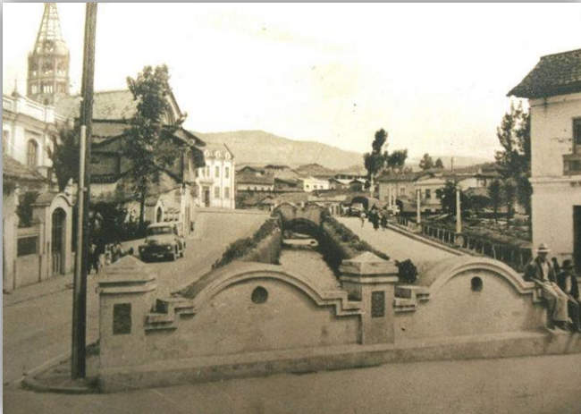
Figura 5. “Río de las Monjas o Antiguo Canal de Venecia”