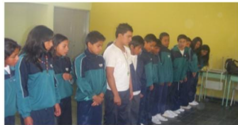
Figura 12. "Rompiendo el Hielo"