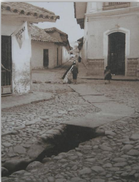
Figura 4. “La Calle Angosta”

http://img511.imageshack.us/img511/5610/calle20angosta201920jpgua1.jpg