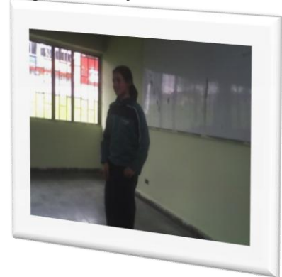
Figura 11. "Proyectando mi voz"

Por medio de este taller, los estudiantes conocerán los diferentes planos que se manejan en un escenario de acuerdo a la posición del público a quien se va a dirigir la palabra, sumado a ello, aprenderán a proyectar por medio de su voz y sus movimientos mayor seguridad.