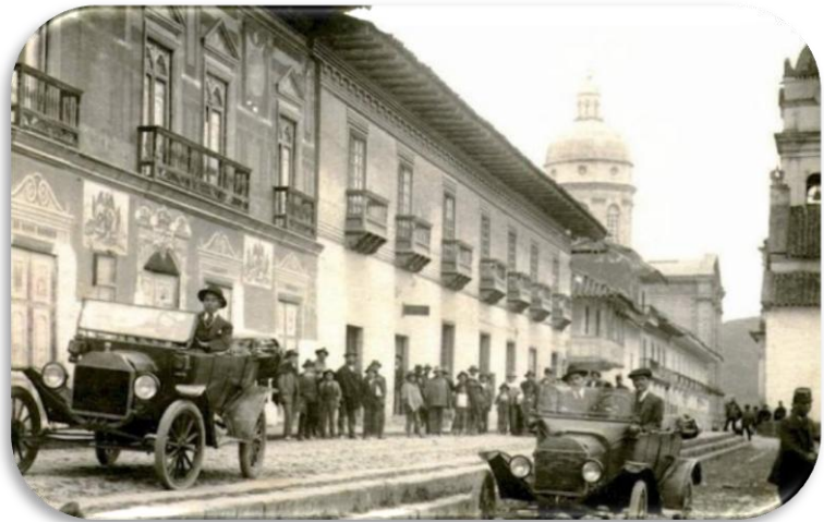
Figura 17. “Calle 18”