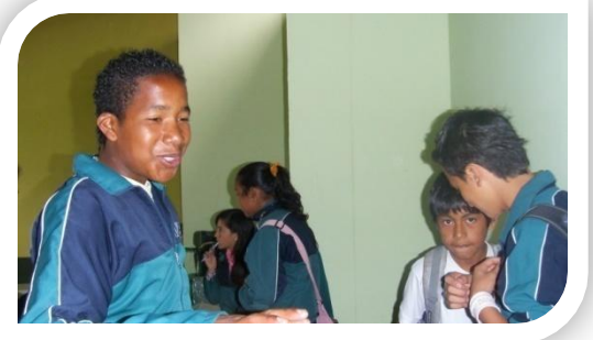
Figura 13. “Cuéntame lo que te contaron”

Fotografías - historias narradas por los niños.