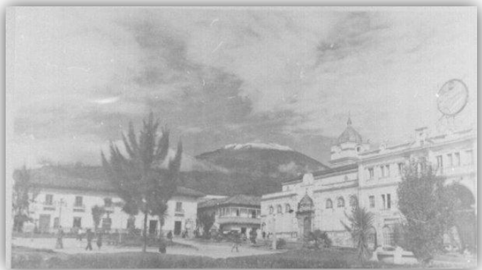
Figura 1. Pasto Antiguo