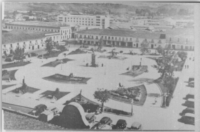
Figura 15. “Antigua Plaza de Nariño”