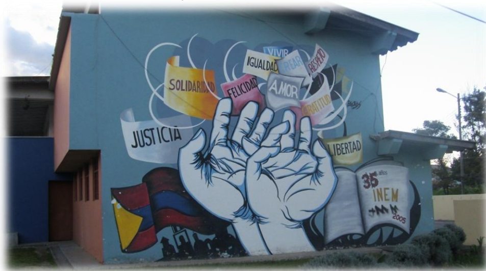
Figura 9. Muro Fines y valores que persigue la Institución Educativa “Luis Delfin Insuasty R.”