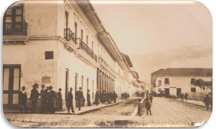
Figura 3. “Antigua calle 18”