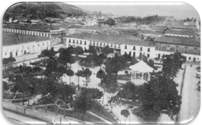
Figura 6. "Plaza de la Constitución"