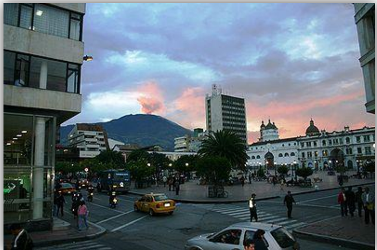
Figura 7. "Plaza de Nariño"