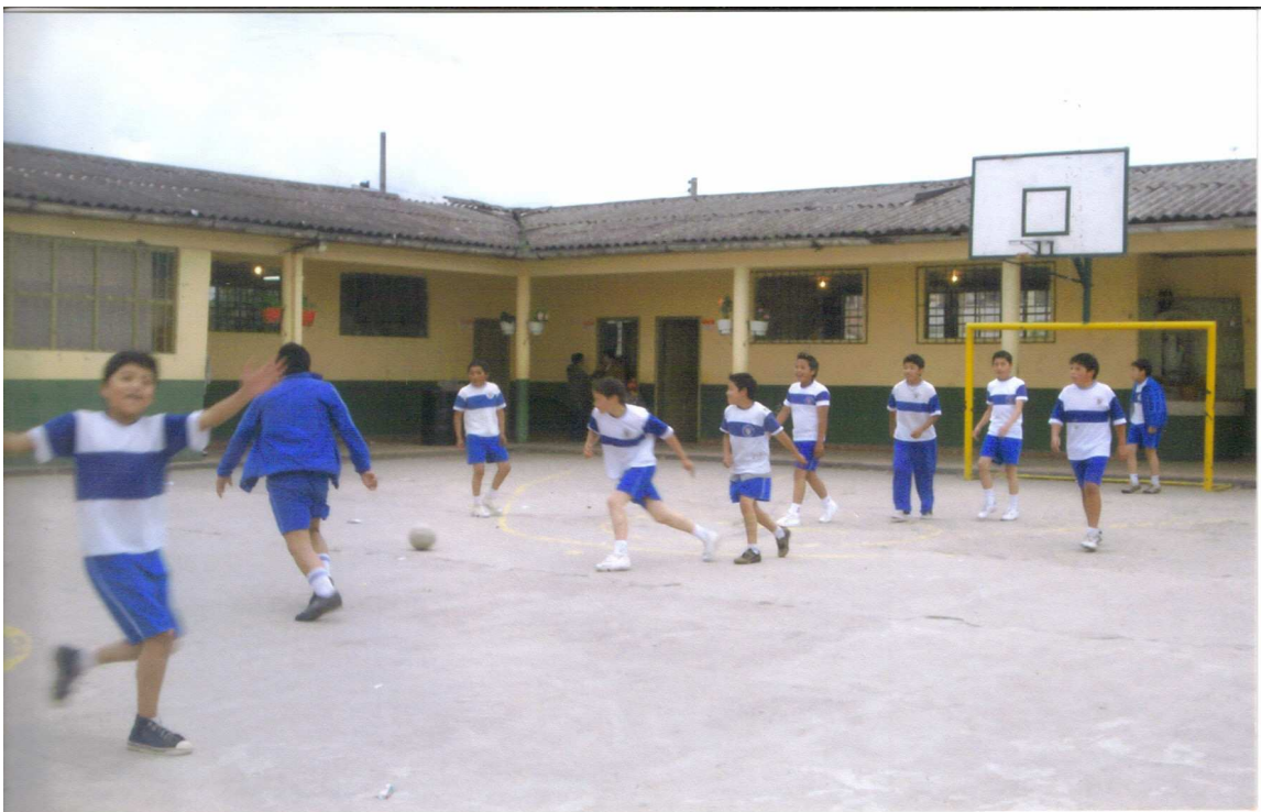
Figura 8. Clase de educación física.

realizan ejercicios de estiramiento y abdominales, en este momento el profesor les llama la atención pidiéndoles que todos realicen los ejercicios, esto fue debido a que uno de los grupos no obedecía por lo que les dijo que si no les interesa pueden irse al salón de clases. El profesor está pendiente de la participación de cada estudiante y de la disposición de cada uno ante la responsabilidad frente a la materia.