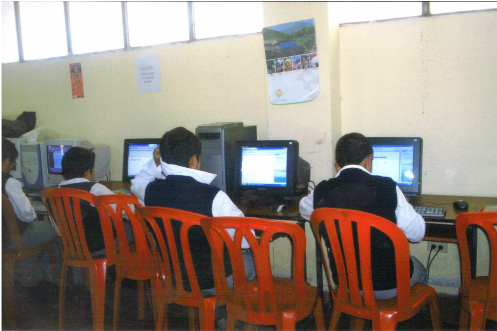
Figura 6. Clase de informática