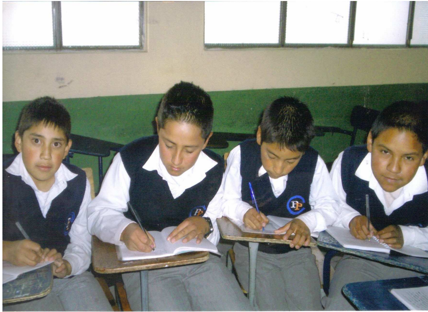
Figura 5. Clase de ciencias sociales