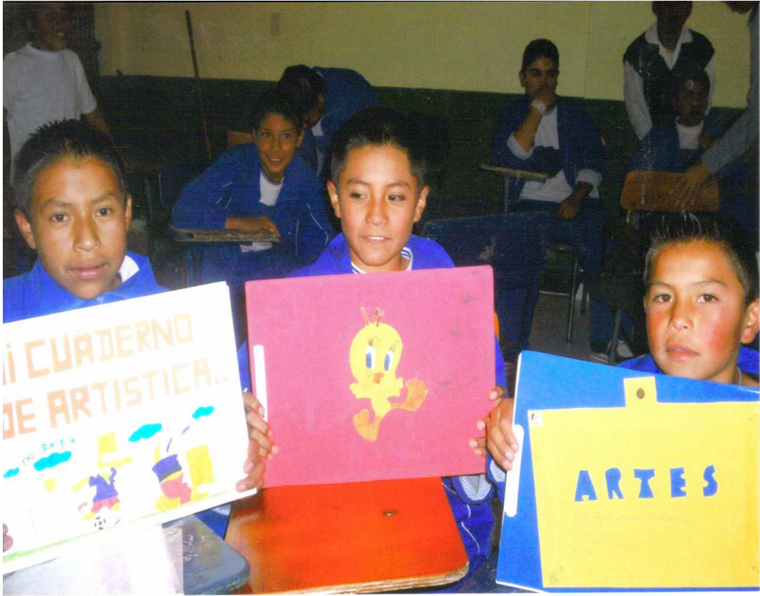
Figura 11. Área de artística