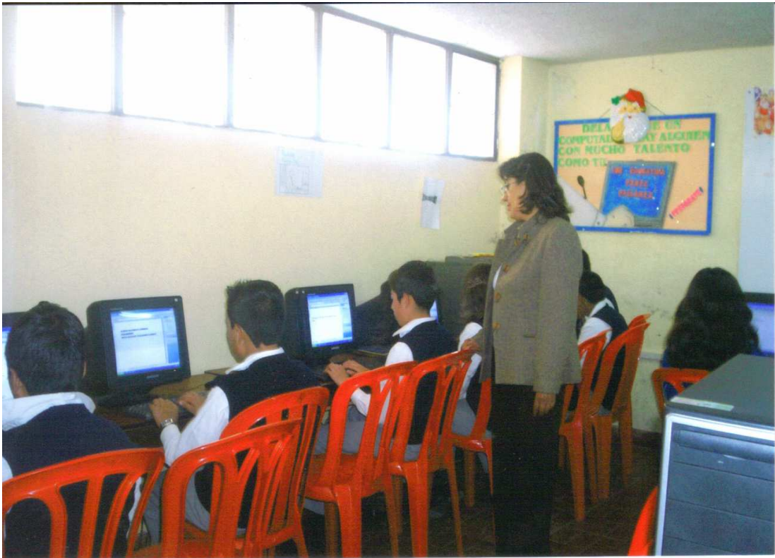
Figura 10. Área de informática

en sistemas y le gusta compartir sus conocimientos con los demás compañeros. También la profesora comenta que por ser niños de bajos recursos les encanta estar frente a un computador, les llama mucho la atención descubrir nuevas cosas por lo que se convierte en una buena herramienta didáctica para su aprendizaje.