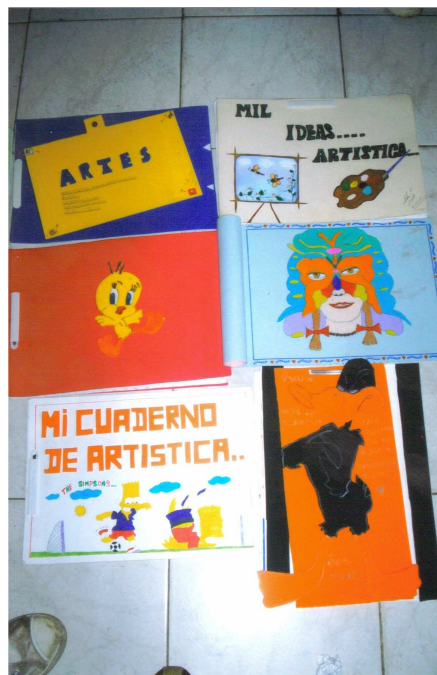
Figura 7. Clase de artística.

además aún no los conoce por su nombre por lo que los trata de usted. Al ver que no todos presentaron su actividad vuelve a explicarles como lo debían hacer y los que si lo hicieron los felicita y les coloca una buena nota. Finalizando la clase les da una segunda oportunidad para los que no cumplieron con su deber.