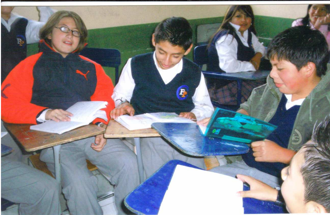
Figura 12. Área de ciencias sociales