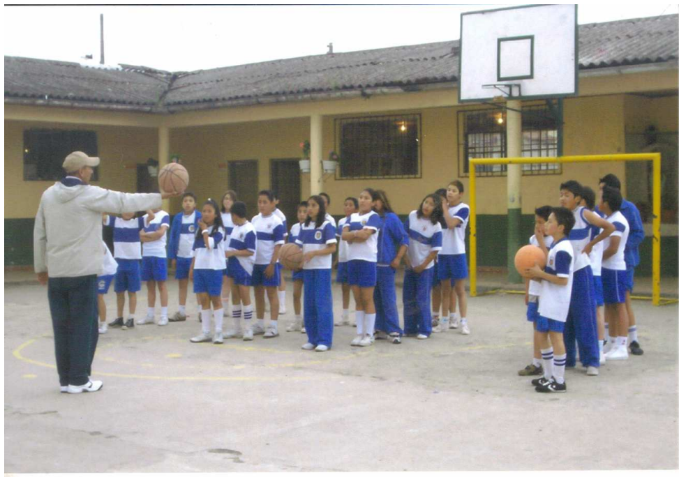
Figura 9. Área de educación física

Para la clase de Educación Física están en constante relación los unos con los otros, se encuentran en movimiento, practican el deporte que prefieren y lo que más les gusta, como nos pudimos dar cuenta, es salir de las aulas y utilizar otros espacios de aprendizaje.