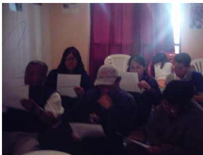
Figura 3. Taller de recuperación de la memoria histórica A.