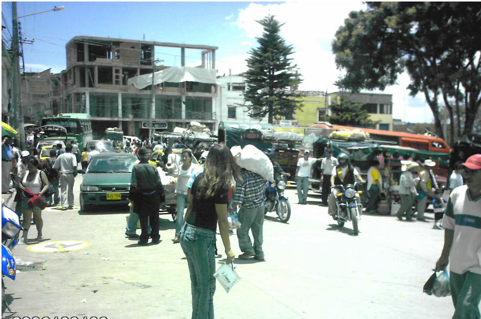
Figura 5. Parque Sucre, La Unión-Nariño

La falta de un lugar adecuado para la llegada y salida de vehículos de servicio público, ha originado desde hace varios años; que los transportadores en general opten por invadir el espacio público del parque Sucre, por tal motivo en el PBOT se plantea construir un Terminal de transporte, pero hasta la fecha no se ha ejecutado ninguna acción, y la situación sigue igual. Ver grafica.