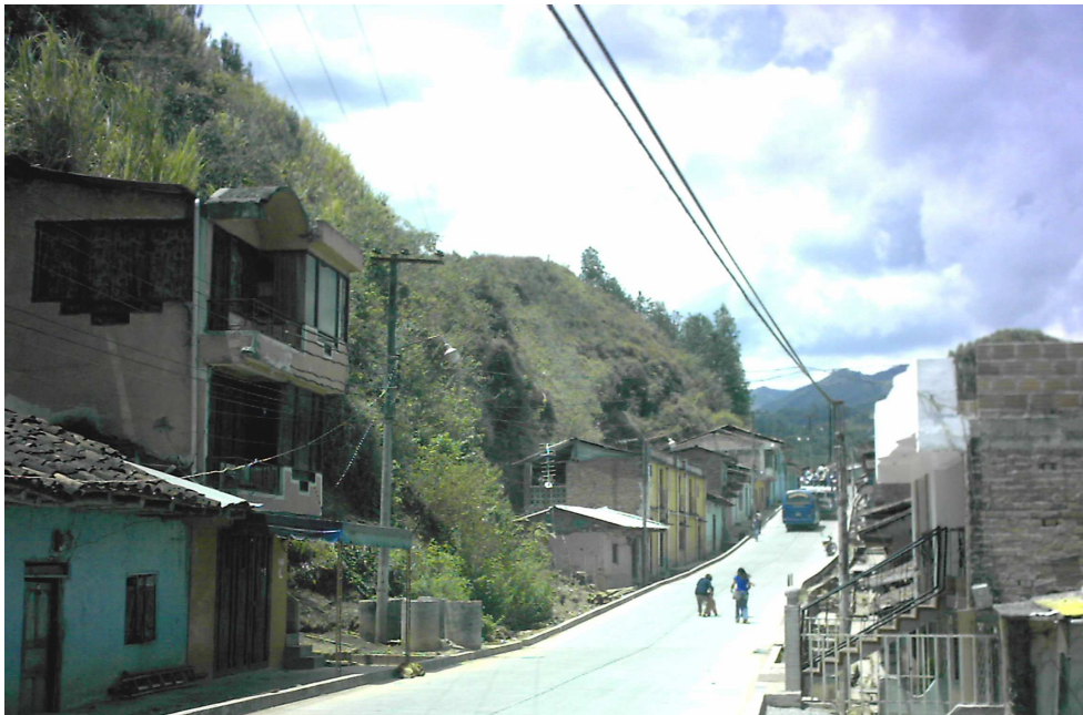
Figura 2. Barrio Valencia, municipio de La Unión.