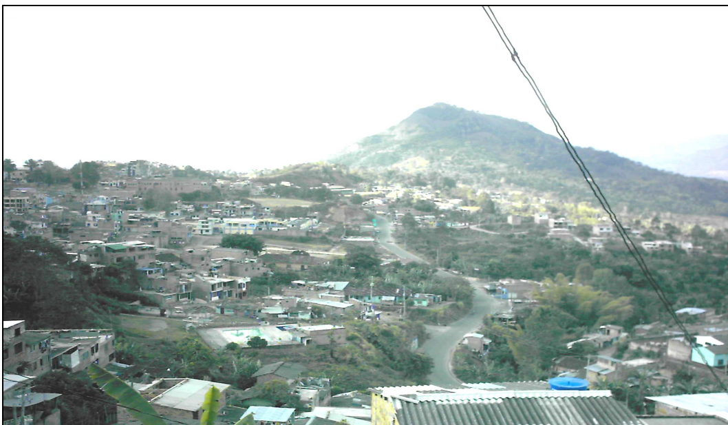
GRÁFICO 1: FOTOGRAFÍA PANORÁMICA MUNICIPIO DE LA UNIÓN