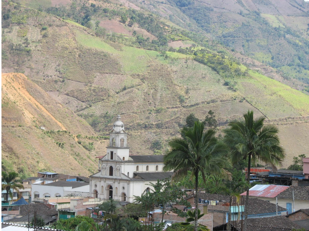
Figura 2. Vista periférica del centro urbano del municipio de Linares