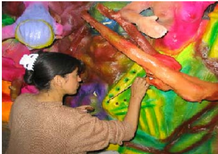
FIGURA 18 26

La mujer en el proceso creativo cumple un papel fundamental, porque al igual que los artistas hace parte del saber-hacer, esta inmersa en el y aporta con su delicadeza, con los detalles, su gusto, su saber. Muchas de ellas aprenden del contacto directo, por las relaciones estrechas que existen con los cultores, su rol de ama de casa, esposa, hija, profesional, madre, se altera para convertirse un integrante más del taller, en el que la condición de género no afecta.