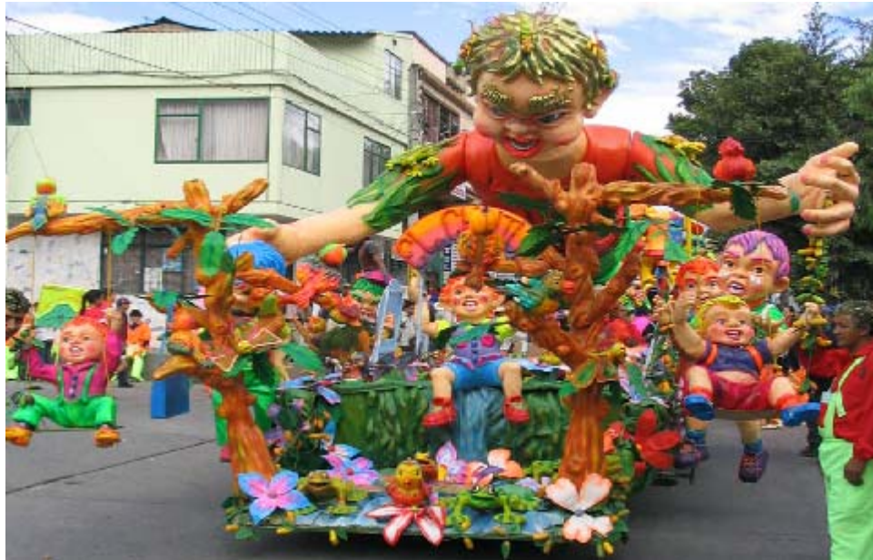
FIGURA 24 37

El carnaval, tiene su esencia ligada a las creaciones de los cultores y al juego, que lo hacen único, recordar la fiesta de Negros y Blancos, es transportarse a su esencia las carrozas, sin desconocer las demás representaciones, puestas en escena, el arte que reflejan las figuras demuestra el conocimiento, la tradición y creatividad.