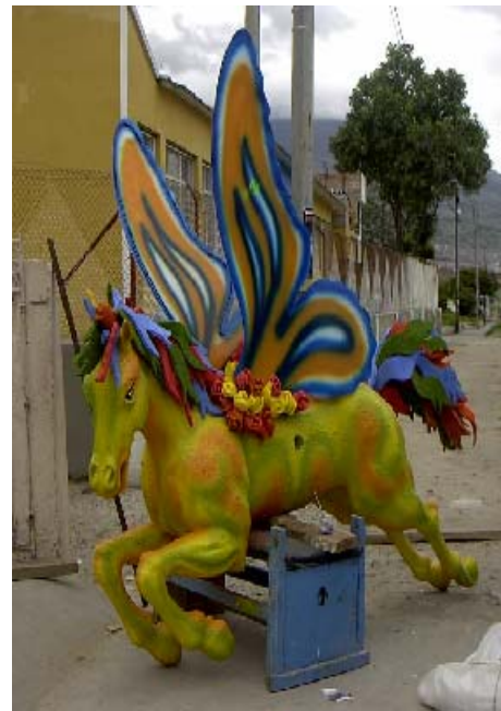
FIGURA 93, 94 93