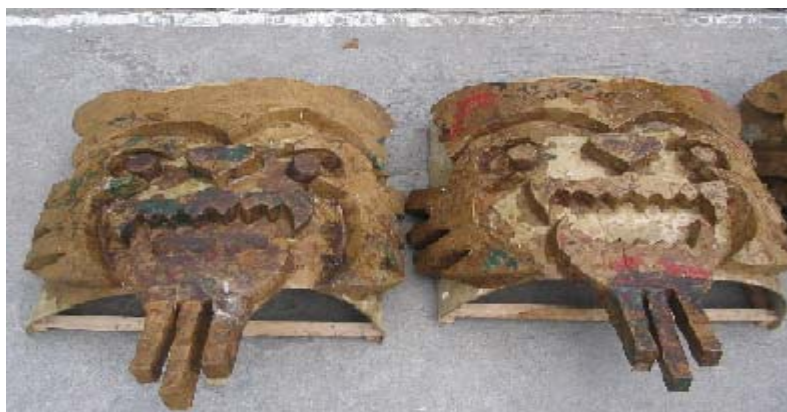
FIGURA 101, 102 99