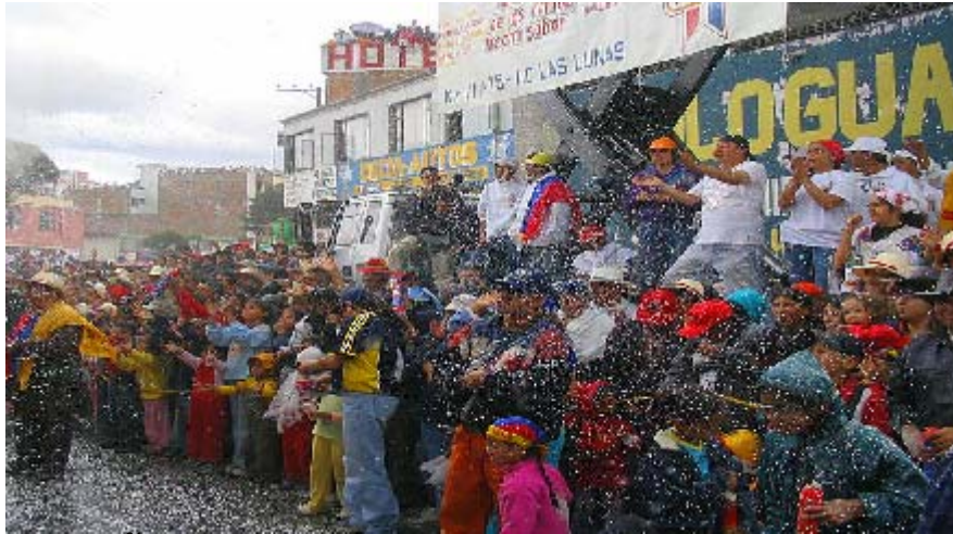
FIGURA 82 84

Las aceras, los balcones, las terrazas, los camiones, son los escenarios mágicos donde es posible convivir, de existir con otros, haciendo parte del momento y participando de él, estos escenarios articulan los sentires de los asistentes, donde el derecho a ser diferente incrementa aun mas, la mixtura cultural. En este gran espectáculo hay una retroalimentación, artistas y espectadores, se nutren por medio de todas las lecturas, aromas, colores, formas, que entran en juego.