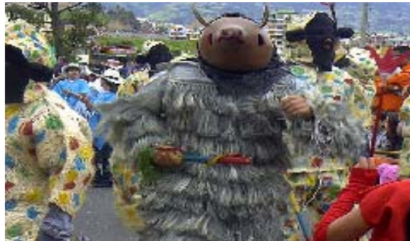
FIGURA 43 52

El Disfraz individual “Es una representación carnavalesca ejecutada por un solo individuo, quien personifica con su disfraz y sus movimientos situaciones o personajes del ámbito regional, nacional o universal. El disfraz realizado con técnicas artesanales lo constituye el mascarón, el vestuario y parafernalia” 53