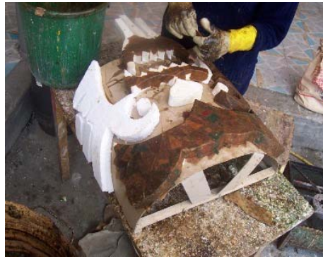
FIGURA 100 98

Las capas de papel que se aplican, en la técnica tradicional, son varias, de tres hasta ocho, dependiendo del tamaño de la figura, porque debe, tener la resistencia que se consigue sobreponiendo capas.