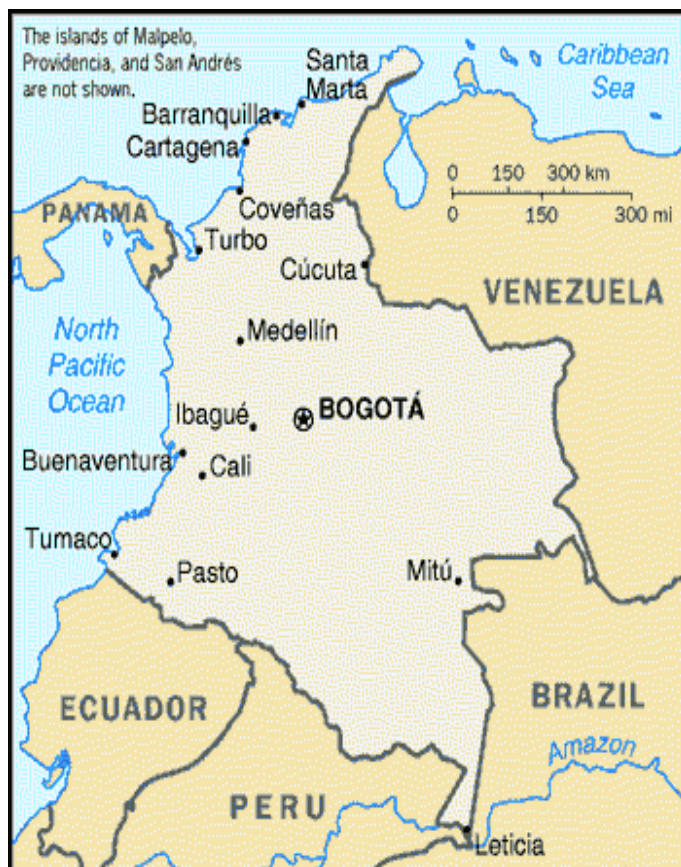
FIGURA 1 3

La República de Colombia esta situada geográficamente en el centro de lo que fuera el imperio colonial español, al noroccidente de América del Sur, aproximadamente entre los 4° y 13" de latitud sur y los 17° 50' de latitud norte y entre los 66° 50' y los 84° 46' de longitud al oeste de Greenwich, incluidos sus territorios marítimos; forma parte de la gran nación latinoamericana conformada por todos los países de Suramérica, Centroamérica, El Caribe y México.