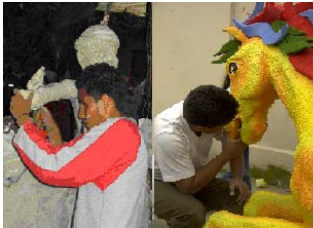
FIGURA 12 -13 18

Detrás del carnaval, hay un sabiduría, con sus propias características, que la distinguen de otras y la hacen magnífica, este saber-hacer, que tiene su historia y tradición, que evoluciona en el tiempo, para que el carnaval sea un encuentro de saberes y conocimientos propios de esta época.