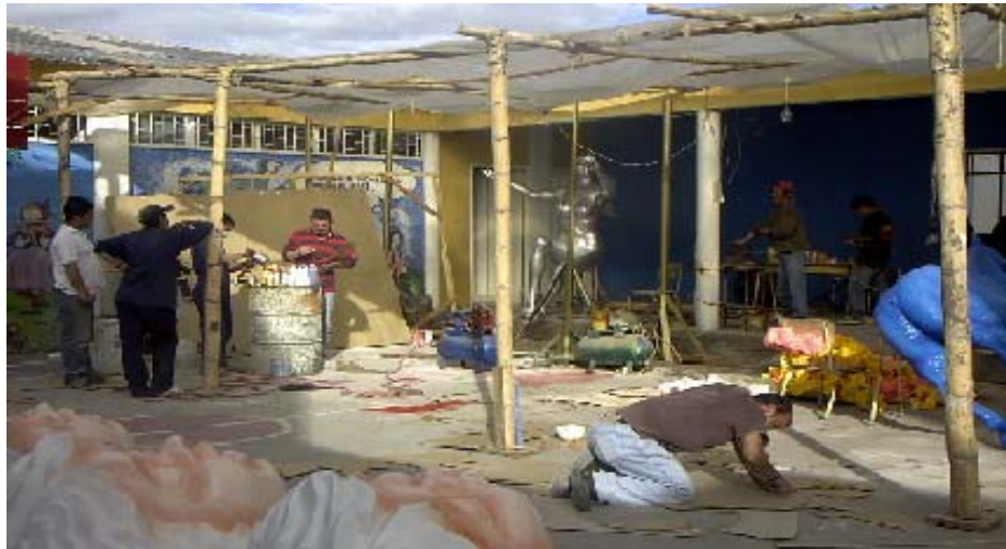
FIGURA 36 47

Por más que el mundo cambie, los artistas ven en el uso de materiales sencillos, la manera perfecta de dar rienda suelta al espíritu creador, usan técnicas convencionales, que dan como resultado grandes obras admiradas en el mundo.