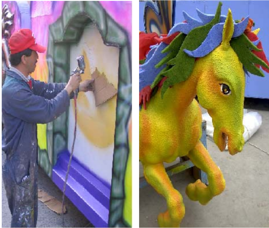
FIGURA 19, 20 27