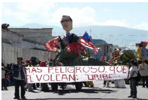
FIGURA 42 50

Para salir en el Carnaval, se requiere pagar unos costos de inscripción que varían de una modalidad a otra, dependiendo de los términos que la organización determine para cada año, las modalidades son las siguientes: