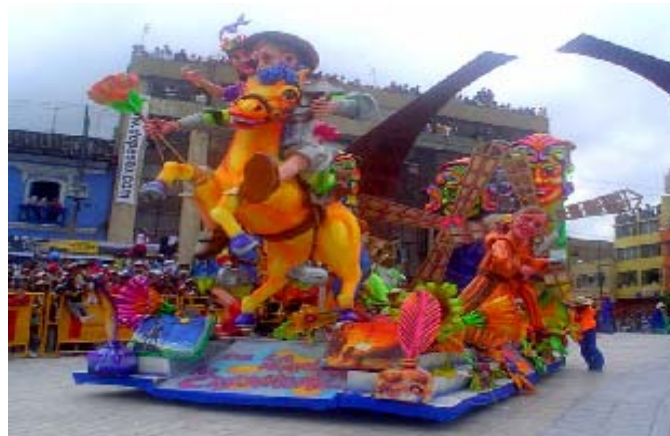
FIGURA 46 58

Las Murgas “Grupo de músicos no menor a siete y no mayor a veinte que participan en los desfiles de carnaval y se desplazan realizando coreografías al ritmo de los instrumentos que interpretan. Los músicos van disfrazados de acuerdo al tema inscrito” 55 . Para el año de 1940, una incursión popular se toma al carnaval, cuando aparecen por primera vez las comparsas de disfraces con música, hoy conocidas como murgas” 57