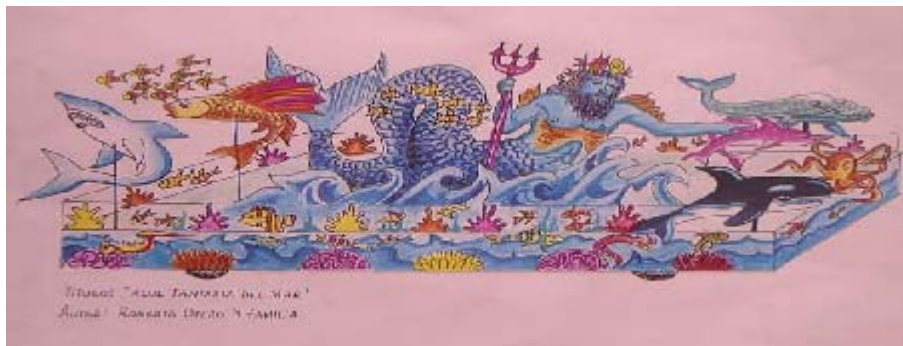
FIGURA 25 38

Los artistas para la elaboración de cualquier modalidad utilizan un boceto, una ves la idea este concreta, se plasma en el papel, darle el primer brochazo de vida, no es del todo sencillo, pero si se tiene claro lo que se quiere, es más fácil. El boceto no es una camisa rígida, durante el proceso puede cambiar.