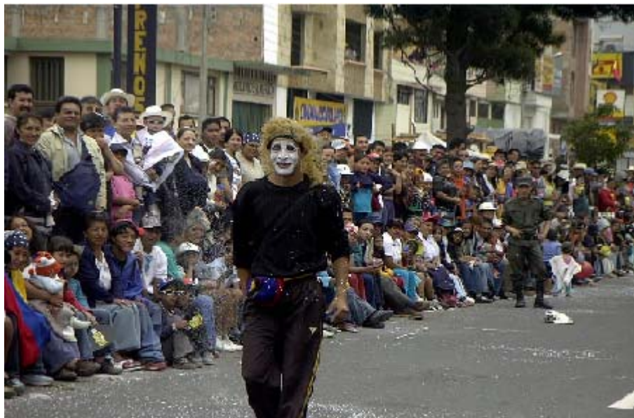
FIGURA 7 13

Hay magia en cada desfile y en la ruta por la que desfilan las carrozas, comparsas, murgas, etc. Hay una sensación de goce, de fiesta, parece que el corazón se quisiera salir del pecho porque late a millón, la comunión que se establece con el espectador hace sentir mas cerca de ellos, es la sensación que surge grata, emocionante, fuerte y sincera, sin reproches porque es carnaval y las dos partes espectadores y actores cumplen el ritual. Tal vez no hallan palabras que describan estas sensaciones, solo hay que vivirlo, porque son especiales.