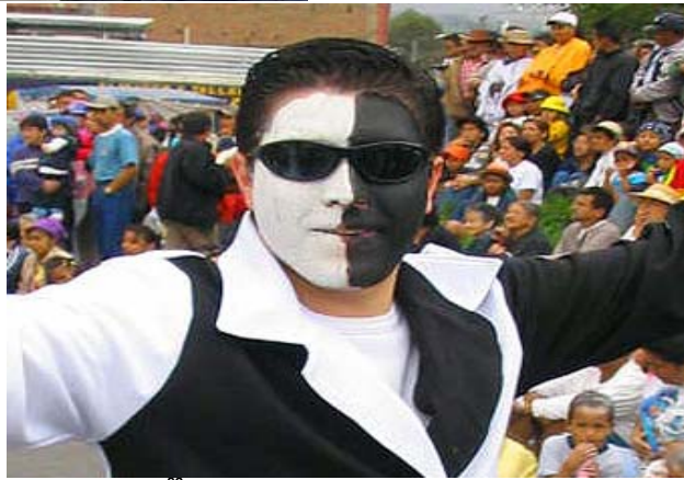
FIGURA 77, 78 82