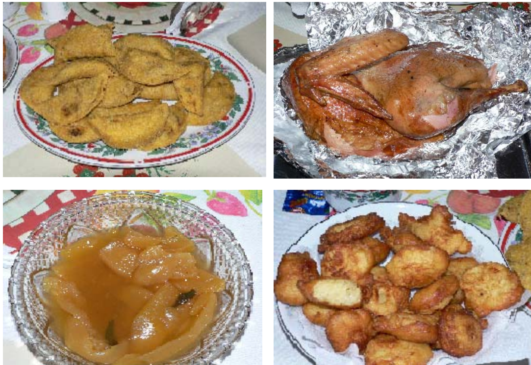
FIGURA 53, 54, 55, 56 64

Se supone que el fin último de estas fechas, es ahondar en las celebraciones religiosas, pero en los recientes años se ve como las orquestas y tablados desplazan el sentido, ahora lo importante no es rezar la novena, aunque se hace, el objetivo final es la rumba, y las emisoras ayudan a que eso suceda, porque son ellas quien auspician estos eventos. Con esto no se quiere afirmar que sea bueno, o malo, solo dejar planteado el cambio que se está suscitando.