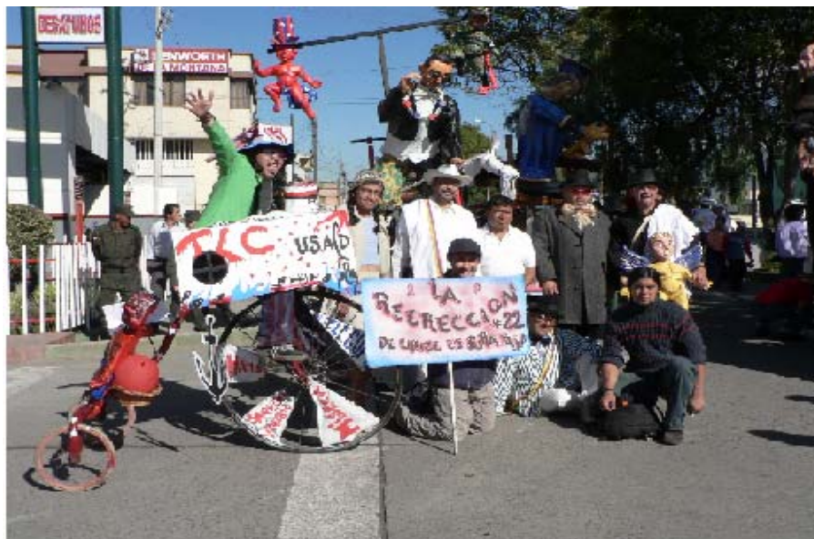
FIGURA 8 14

Es el espacio apropiado para desvivir los sentimientos y pensamientos, es el lugar de encuentro, donde hombres, mujeres, niños, ancianos, jóvenes, se mezclan con sus diferencias económicas, políticas, sociales, étnicas e ideológicas y permiten el intercambio de conocimientos a través de la magia, el roce, la risa, el gesto, la palabra y el juego de Carnaval.