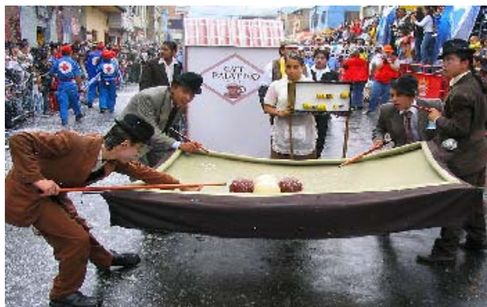
FIGURA 72 79

Esta narración recrea uno de los posibles orígenes de la Familia Castañeda, un personaje que vale la pena nombrar es Pericles Carnaval, quien da la bienvenida a esta familia, y en la actualidad es el eje central de este desfile, y que poco a poco se ha enriquecido, muchas más expresiones se han unido a esta muestra, como es el caso de los diferentes colegios y universidades, grupos de familias, que con su toque único aportan al desfile, lo hacen teniendo en cuenta diversos temas, de remembranza, trayendo a la memoria el Pasto de antaño, o simplemente representan situaciones jocosas.