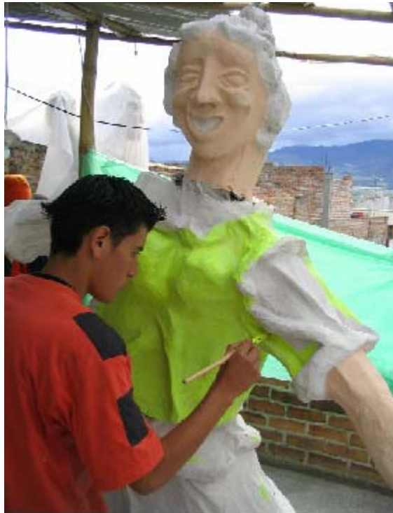
FIGURA 16 23

La innovación restituye la esperanza en el pasado y anticipa la certeza de un porvenir, es fuego que enciende cenizas que tiene la virtud de convertir los fuegos en juegos, los gritos en risas, pues son niños y jóvenes que escriben la historia con sus emociones.