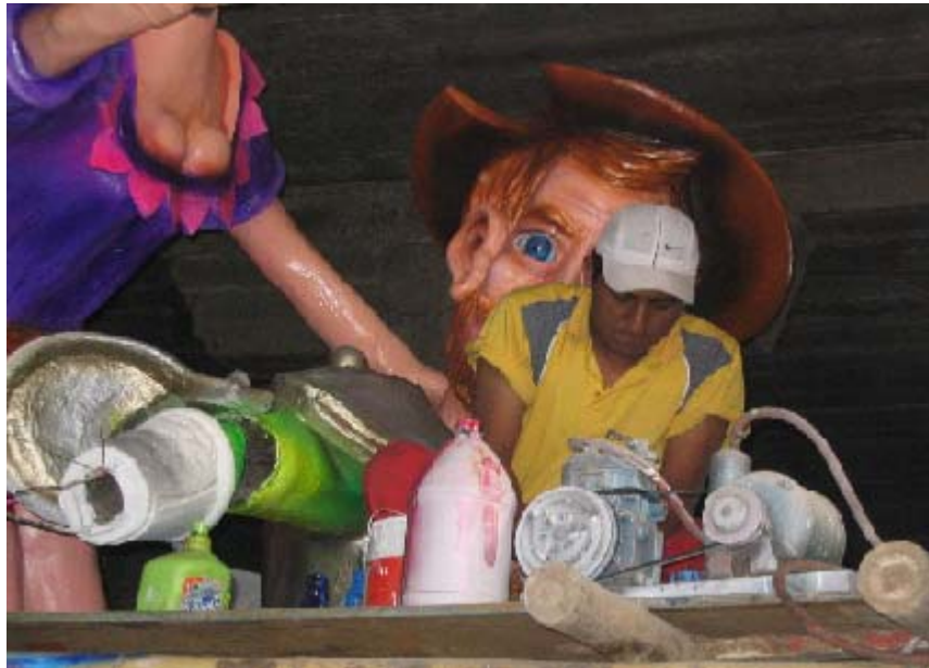
FIGURA 14 19

El principal material que se utiliza en todas las modalidades es el papel encolado, debido a la demanda que tiene, se inicia a recolectar unos meses antes de emprender la obra (septiembre, octubre), cuando se comienza el trabajo en los últimos meses del año, este material escasea y el precio se dispara, convirtiéndose así en un limitante a la hora de crear y se piensa en reemplazar. Este puede ser un factor para que el saber-hacer cambie.