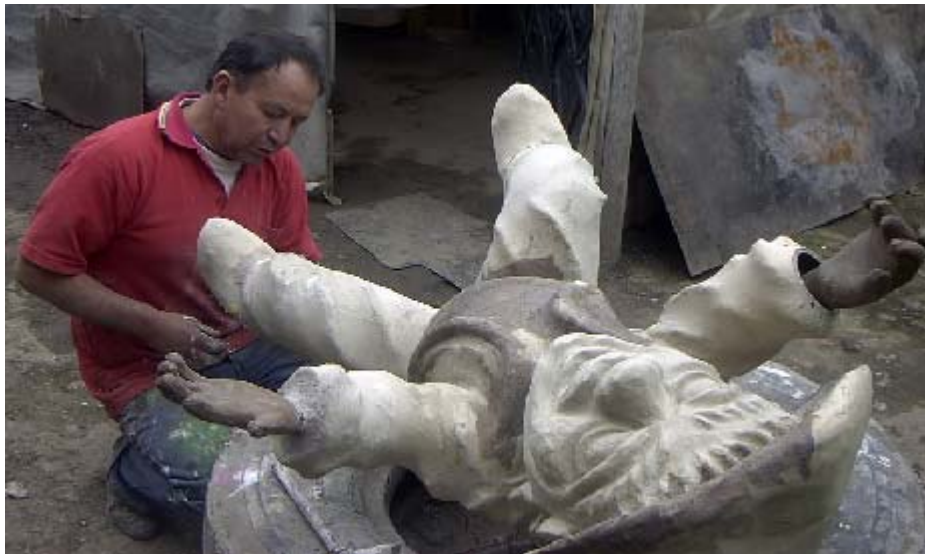
FIGURA 88 88

Esto permite recolectar la información de una manera más real, se deja a un lado los rígidos formatos, para que el conocimiento y la información obtenida fluyan de una manera natural, por medio de conversaciones informales, que se guardan en la memoria para luego darle vida en el papel.