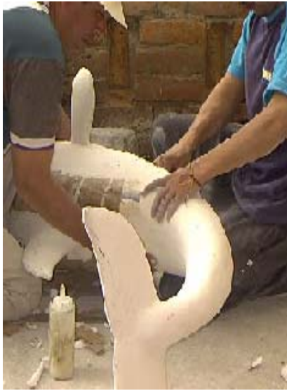
FIGURA 97 96

El maestro Roberto Otero, maneja la técnica innovadora, básicamente modela las figuras en su totalidad en icopor, tanto rostros como cuerpos se elaboran en este material, las figuras grandes llevan por dentro una estructura metálica o en madera que les permite mas adelante darle el movimiento.