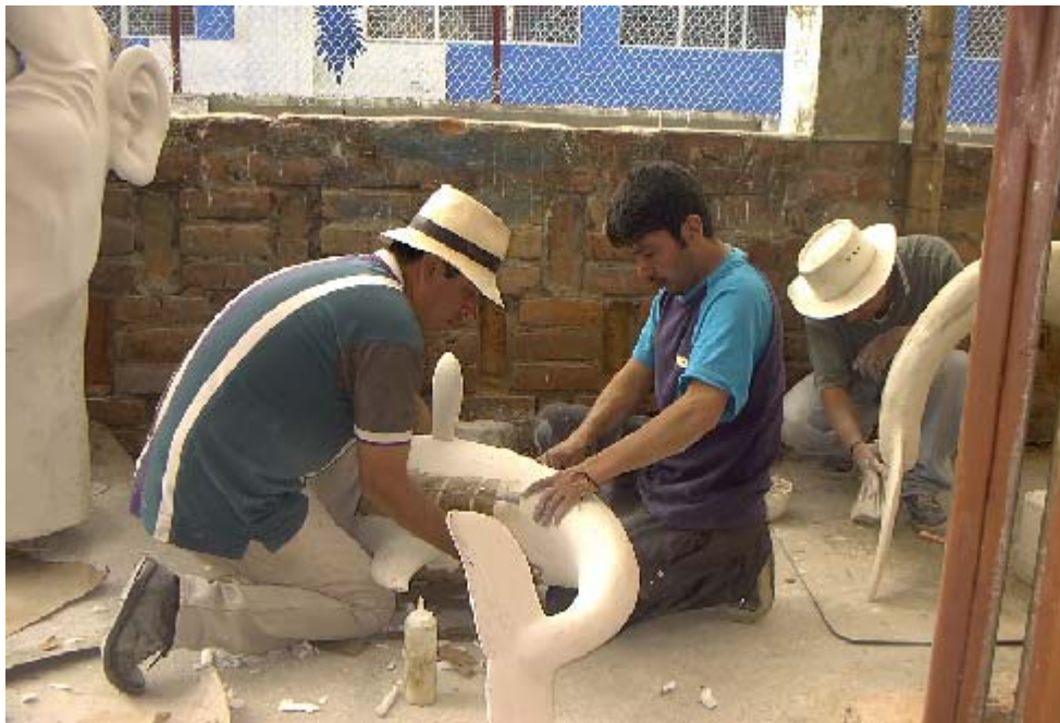
FIGURA 11 17

Es el producto de los conocimientos heredados por la tradición; el “saber-hacer”, se compone de numerosas y variadas formas de crear y conocer, únicas y auténticas, que no se aprecian a simple vista, se valora mas su representación que su escénica misma.