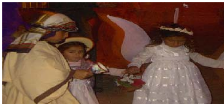
FIGURA 51, 52 63