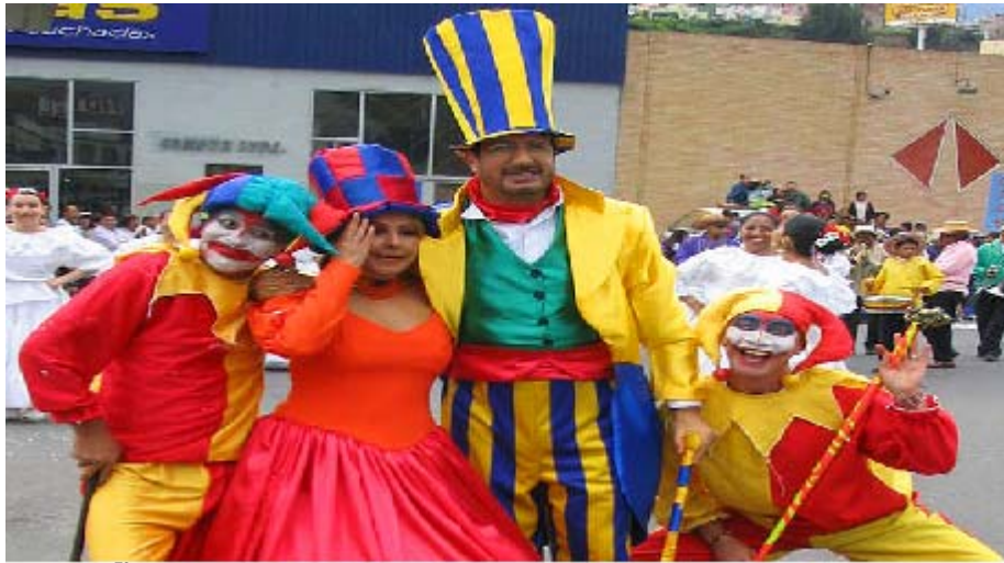
FIGURA 73 79