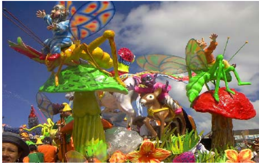
FIGURA 6 12

Hay magia en cada desfile y en la ruta por la que desfilan las carrozas, comparsas, murgas, etc. Hay una sensación de goce, de fiesta, parece que el corazón se quisiera salir del pecho porque late a millón, la comunión que se establece con el espectador hace sentir mas cerca de ellos, es la sensación que surge grata, emocionante, fuerte y sincera, sin reproches porque es carnaval y las dos partes espectadores y actores cumplen el ritual. Tal vez no hallan palabras que describan estas sensaciones, solo hay que vivirlo, porque son especiales.