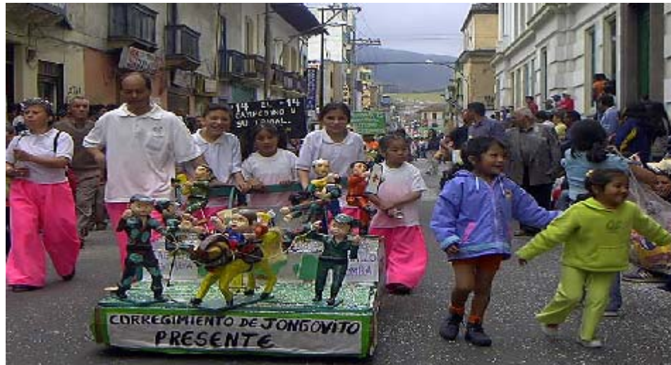
FIGURA 67 73

El carnavalito, es considerado como una escuela, porque es aquí donde los niños con sus pequeñas manos, inician sus pininos en la ardua labor del artista, en ocasiones movidos por su propia iniciativa y otras veces por sus padres, quienes financian los diseños.