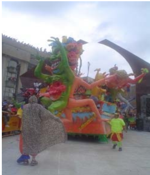
FIGURA 91 91

Como este conocimiento es restringido se hace a puerta cerrada, el maestro Edmundo, se da cuenta de la insistencia y la aventura del joven, a quien le da la oportunidad de ingresar al taller, el joven, con temor corrige las figuras que el maestro moldea, porque se hallan desproporcionadas. Es aquí donde su capacidad se pone en juego, y su habilidad se refleja.