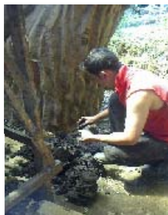
FIGURA 35: Cultor modelando en Barro. AUTOR: Claudia Afanador H.

Estas categorías enriquecen sensiblemente la puesta en escena de las diversas modalidades, además le imprime el toque personal que busca reconocimiento de un arduo trabajo. Sea cual sea el origen de su formación, o la motivación que tengan, lo entregan todo en cada representación.