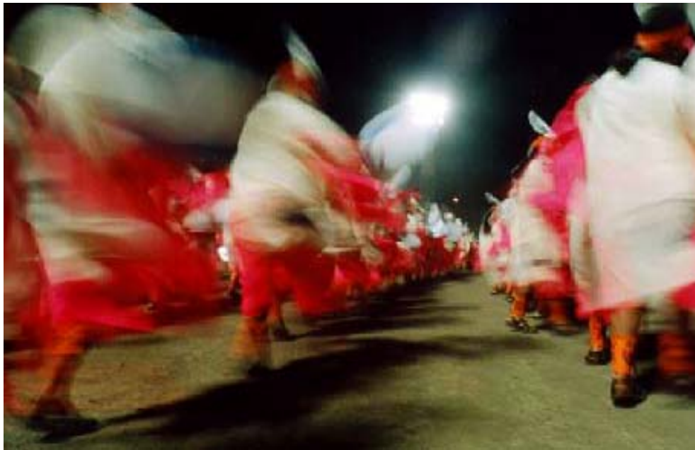
FIGURA 70 76

La imaginación y la creatividad se apoderan de este día, para sentirse no reconocido, bailan e interpretan un san juanito, un tinku, un nariñense mas todos y cada uno de los bailes y atuendos que se recrean en este desfile, con muchos colores, cintas, plumas, cascabeles, bordados, que junto a los cuerpos de los danzantes se unen y se alejan, e invitan a la felicidad y al goce.