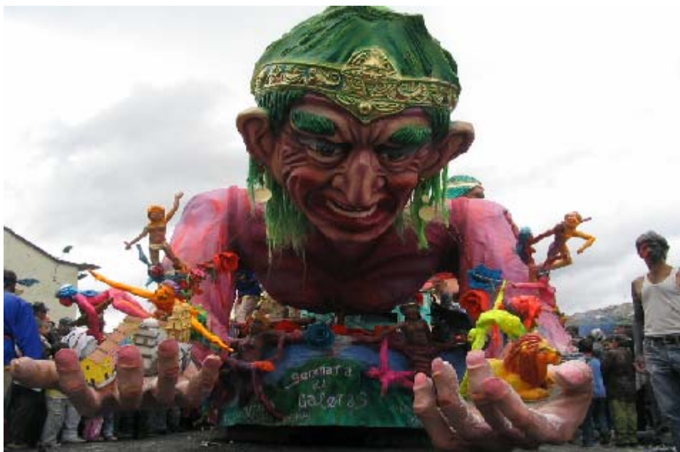
FIGURA 17 25

Ese modelo económico ha afectado para bien o para mal las culturas dependientes, que lentamente van perdiendo su identidad, al asumir patrones de comportamiento socioculturales a imagen y semejanza de los países mas desarrollados.