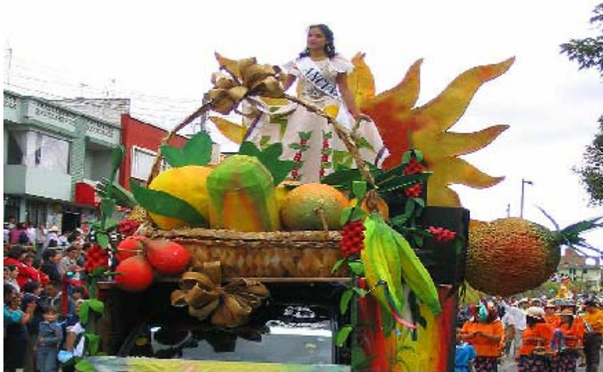
FIGURA 65 71