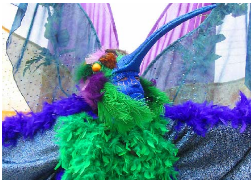
FIGURA 4 8