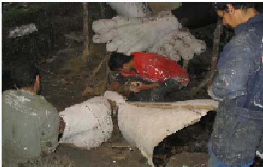
FIGURA 89 89

Pese a estos obstáculos el maestro Chicaiza, se involucra poco a poco en el medio, porque si quería seguir tenía que aprender, y lo hace. Con el manejo de la técnica, y el aporte de su estilo, se lanza a crear en las diferentes modalidades, que son el instrumento para obtener reconocimiento y dar el gran paso, elaborar una carroza.