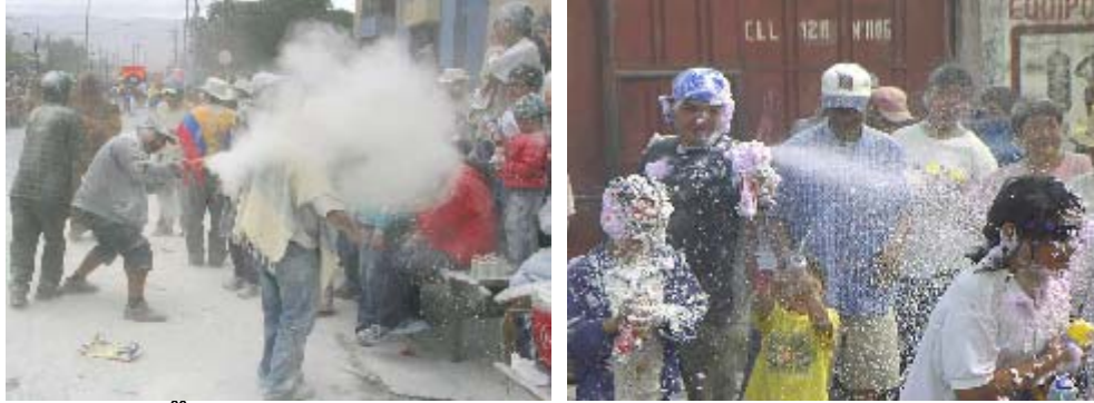
FIGURA 84, 85 86

se ausenta no se podría construir. Este es el principal atractivo para propios, visitantes, quienes al transcurrir el día no cesan de alabar la sorprendente capacidad creativa y humana de los cultores y en general de la cultura de los Pastusos