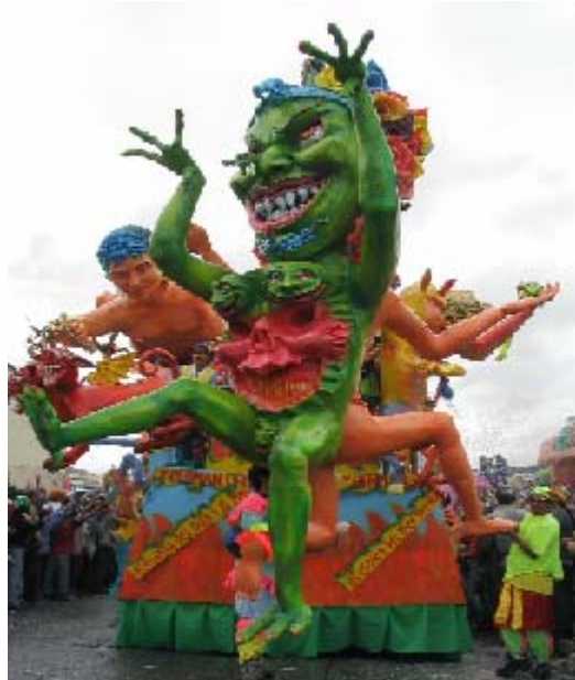
FIGURA 47 60

Carroza no motorizada , “auto alegórico, composición escultórica elaborada principalmente con técnica tradicional, papel, cola yeso, fibras, resinas; que recrean, mitos, leyendas, personajes o pasajes de la historia regional, nacional o universal. La carroza no motorizada es acondicionada en una plataforma móvil de tracción humana o mecánica, no automotor, que puede o no transportar jugadores. Los demás jugadores ataviados con disfraces acordes al tema animarán el motivo durante el desfile haciendo el recorrido a pie” 59 .