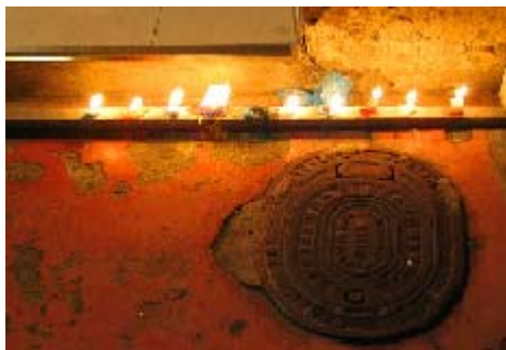
FIGURA 49,50: Celebración del Día de las Velitas, 07 de Diciembre de 2004.

Es el tiempo de unión, se dejan atrás los malos entendidos, los miedos y los disgustos, se da la oportunidad al otro, vale la pena soñar. Sé interactúa, entre extraños, se rinde culto a un dios lejano.....el fuego. Los individuos buscan dar y recibir.