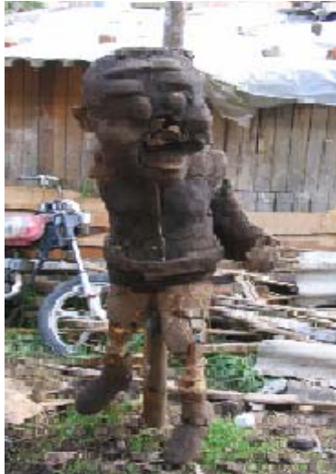
FIGURA 95 94

Para los cuerpos se elabora un esqueleto con palos de madera, que se atan con alambre, y sobre ellos se agrega el barro, al que se lo va moldeando. Y para las figuras pequeñas el modelado no se hace por partes, sino que sobre el esqueleto se arma la figura.