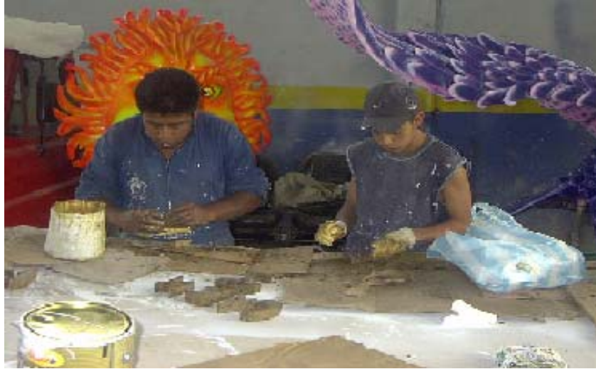
FIGURA 34 45

Artistas por iniciativa propia: son quienes poseen las habilidades, para el trabajo artístico, capacidades excepcionales, que les permiten mostrar su potencial en cada desfile, muchos de ellos con preparación académica, que encuentran el gusto por la fiesta carnavalesca.