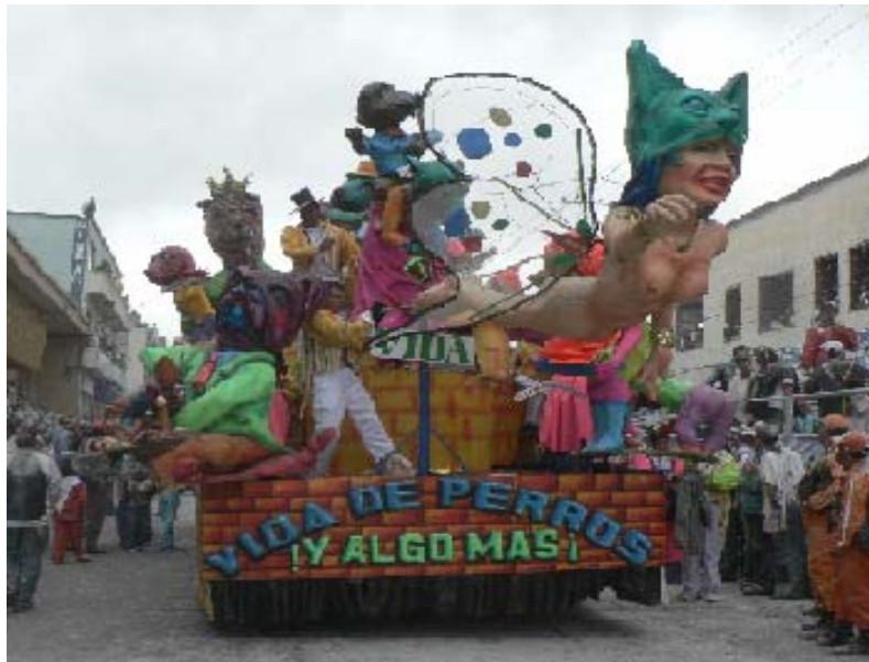
FIGURA 83 85

emerge con fuerza del publico, los gritos y vivas, forman una aura de fiesta en blanco. Al igual que el músico, deja escapar los mejores acordes, de su inspiración, que no podría ser otra, es música de carnaval, he invita a un viaje a través de cada nota interpretada, el alma se suelta a los acordes de los ritmos de esta región sureña.