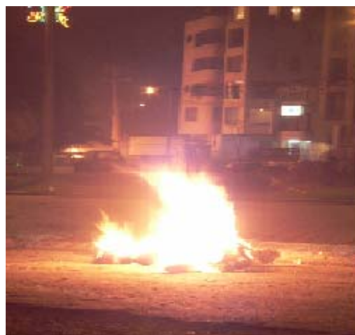
FIGURA 63, 64 70

Llegada las doce, toda la familia, los amigos, vecinos se reúnen fuera de la casa, para presenciar la quema del viejo, se le esparce gasolina y se quema, de fondo se escucha la típica canción, “faltan cinco pa’ las doce”, mientras se inicia el recorrido de los amigos y vecinos, deseando feliz año nuevo, un río humano se aprecia en las calles, en donde abrazos, besos, palabras, se conjugan e intercambian, y el licor, la comida, una pieza de baile, son el gesto para iniciar bien el año.