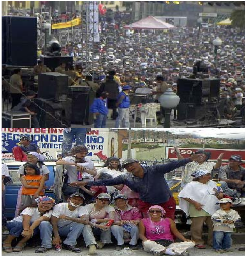
FIGURA 86, 87 87

Ahora, se decir sin temor a equivocarse que los Carnavales de Pasto, son únicos, populares, extrapolan los miedos, la calma, y llevan a un mundo lúdico y bullicioso, donde es posible jugar al negro y al blanco siendo o sintiéndose niños.