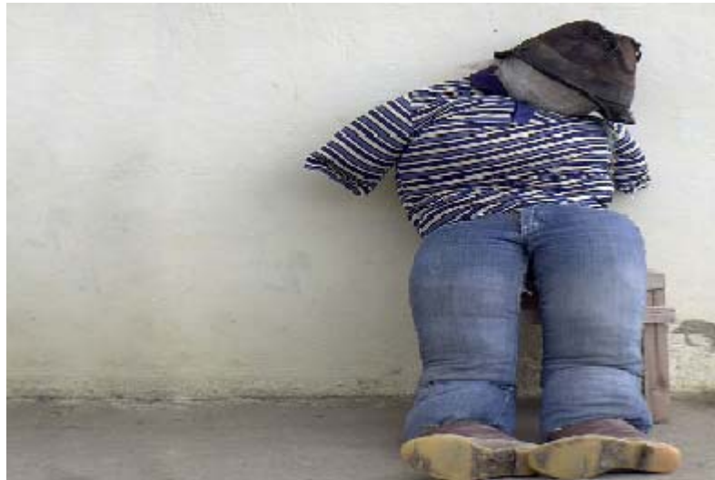
FIGURA 59 67

Por otro lado, se organiza el desfile de años viejos, es el primero de los desfiles de carnaval, y lleva una carga satírica, puesto que en la representación de los diferentes motivos se habrá el espacio para la crítica al sistema, sarcasmo político, reclamos y humor negro, de hechos ocurridos durante el año en el ámbito local, nacional e internacional.