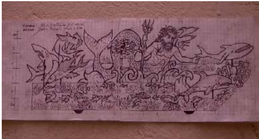
FIGURA 9 15