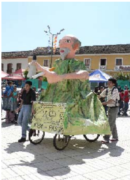
FIGURA 60, 61 68

Por otro lado, se organiza el desfile de años viejos, es el primero de los desfiles de carnaval, y lleva una carga satírica, puesto que en la representación de los diferentes motivos se habrá el espacio para la crítica al sistema, sarcasmo político, reclamos y humor negro, de hechos ocurridos durante el año en el ámbito local, nacional e internacional.