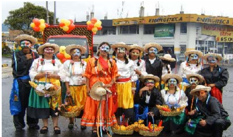
FIGURA 74 80