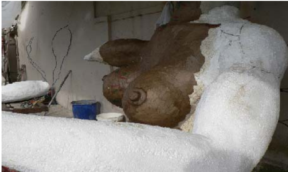
FIGURA 29 42