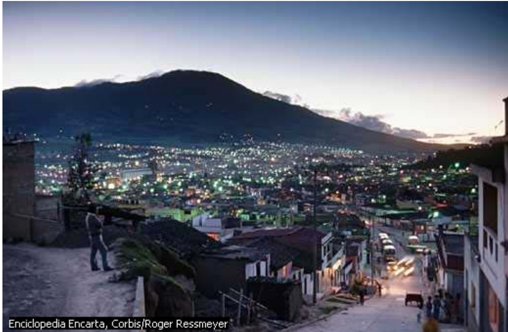
FIGURA 3. 73

hectáreas de aguas frías y profundas con una temperatura de 11° C. en el centro de la Laguna se halla la isla de La Corota, reserva vegetal de Fauna y Flora.