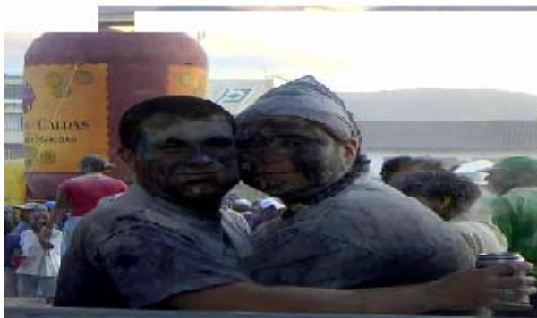
FIGURA 75, 76: Juego de Negritos, Carnaval 2004.

Es el juego, el ingrediente que hace único al Carnaval de Pasto, vemos que algunas personas aun usan, "la Pintica", pero, muchas otras se lanzan con ambas manos a untar la cara de cosmético, que ya no es Francés, sino nacional, de buena calidad y mucho más económico.