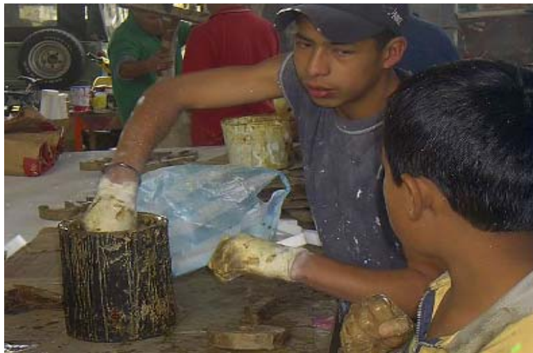
FIGURA 15 20

El costo de una carroza oscila entre los 7 y 10 millones de pesos para el carnaval 2006, los recursos son obtenidos de diferentes maneras, como el ahorro, durante todo el año y básicamente en los tres o cuatro meses que preceden al inicio del trabajo; el préstamo de dinero de entidades bancarias, familiares o prestamistas, la colaboración de los vecinos y familiares que creen en ellos; además, la administración del carnaval (CORPOCARNAVAL), da un auxilio que según los artistas es poco, la venta de puestos a los “jugadores” o personas que el día del desfile quieren participar en la fiesta desde las carrozas, el precio incluye el disfraz que concuerda con el motivo de la carroza.