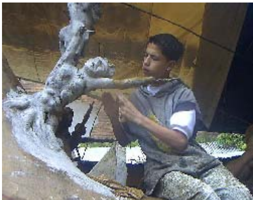
FIGURA 98,99 97

Otra característica que diferencia a los tres cultores del carnaval, es el estilo de empapelar, que hace únicas las creaciones del carnaval de Pasto, porque es un elemento que forma parte de la cultura, de la identidad del carnaval, que corresponde a una tradición milenaria y es el fruto de una evolución en el tiempo, el papel mache es un material económico, reciclado, pero a su vez escaso.