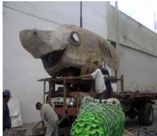
FIGURA 103 , 104, 105 100