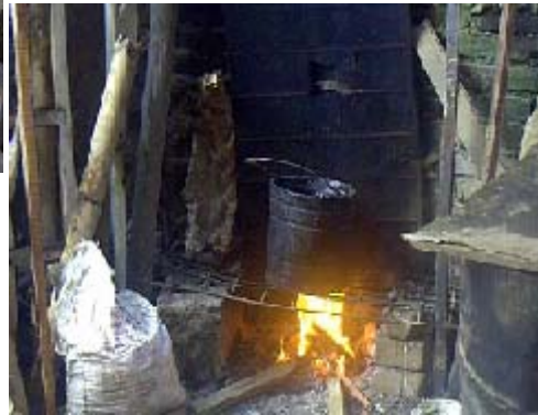
FIGURA 37,38 48

En los talleres se descubre la división del trabajo, existen maestros y aprendices del carnaval, las personas que se involucran al proceso inician con labores sencillas, hacen mandados, cocinan, preparan la cola, limpian el obraje y pasan posteriormente a encolar, traen el barro, lo preparan, unos hacen estructuras, otros movimiento, pero el artista, es el responsable, dueño de la obra y se halla enfrente del proceso.