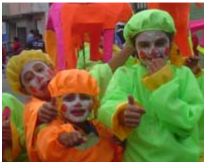
FIGURA 68 74

Los niños de manera permanente y dinámica enriquecen el carnaval, porque de ellos brotan los gestos más vivos y sinceros, brindando con sus creaciones otro estilo, aunque su trabajo no tenga perfección le aportan otra manera de ver el mundo y de su forma de relacionarse con él.