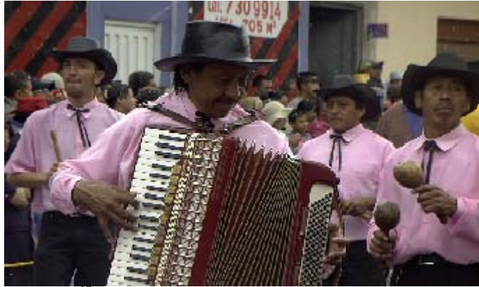
FIGURA 45 56

Las Murgas “Grupo de músicos no menor a siete y no mayor a veinte que participan en los desfiles de carnaval y se desplazan realizando coreografías al ritmo de los instrumentos que interpretan. Los músicos van disfrazados de acuerdo al tema inscrito” 55 . Para el año de 1940, una incursión popular se toma al carnaval, cuando aparecen por primera vez las comparsas de disfraces con música, hoy conocidas como murgas” 57