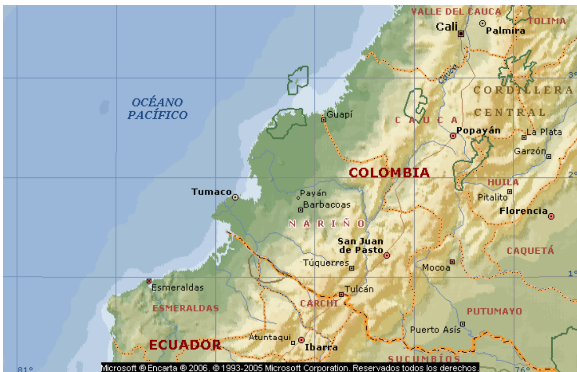
FIGURA 2 4

La población de Nariño, se encuentra repartida en forma irregular; mientras que el occidente y oriente tiene baja densidad, la zona central andina aglomera la mayor parte, es un departamento rural, puesto que un poco mas de la mitad de la población vive en el campo, únicamente Pasto, Ipiales y Tuquerres tienen una población mayor de 20.000 habitantes.