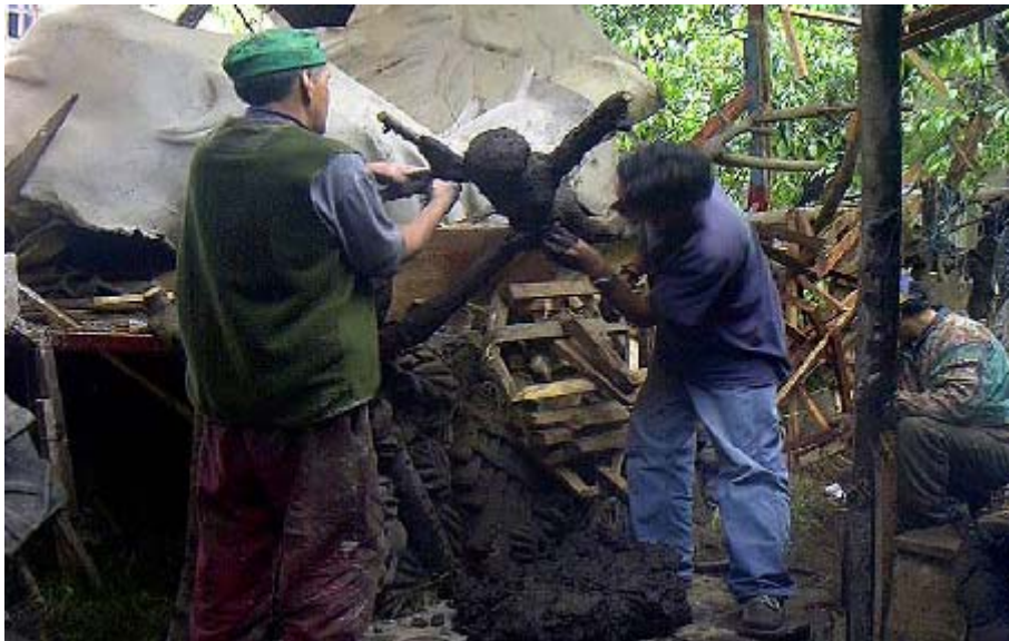
FIGURA 26 40

Técnica empleada desde los inicios del Carnaval, es la esencia y la característica primordial utilizada por los artistas en la elaboración de carrozas, murgas, disfraces individuales, en fin, todas las representaciones artísticas dentro del Carnaval Andino de Negros y Blancos; consiste en el uso del papel encolado junto a la cola y el yeso.