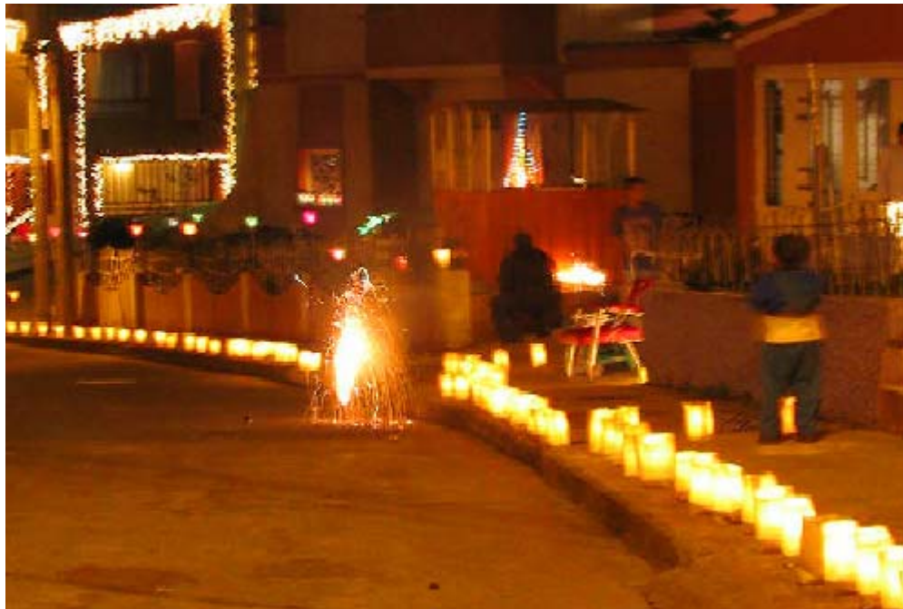
FIGURA 48 62

La tarde, en la mayoría de los barrios es como un día normal, únicamente el centro de la ciudad se agita con una ola de vendedores ambulantes que ofrecen a los transeúntes las velas para encender en la noche. Llegada la oscuridad las puertas de las casas se abren, la calle deja de ser un sitio frío para convertirse en el lugar de encuentro, amistad y comunión.