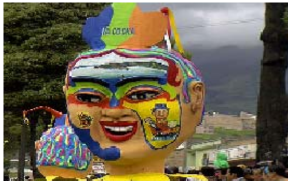
FIGURA 44 54 :

El Disfraz individual “Es una representación carnavalesca ejecutada por un solo individuo, quien personifica con su disfraz y sus movimientos situaciones o personajes del ámbito regional, nacional o universal. El disfraz realizado con técnicas artesanales lo constituye el mascarón, el vestuario y parafernalia” 53