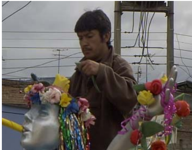
FIGURA 92 92