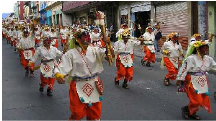
FIGURA 69 75

Las calles por donde desfilan los grupos coreográficos toman vida y son conformados por mas de cien personas, quien se entregan de alma y espíritu en la música y el baile, hacen que el corazón del público se estremezca e invitan a moverse, es aquí donde muchos colores, sonidos, gritos y sensaciones se mezclan, para invitar a soñar.