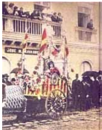
FIGURA 21,22 33

Con el transcurso del tiempo, los carros alegóricos toman forma de carroza, aumentan su tamaño con la utilización de carros a motor, y se muestran las primeras figuras rústicas, con temas específicos, además los participantes se disfrazan con ropas sacadas de los viejos baúles.