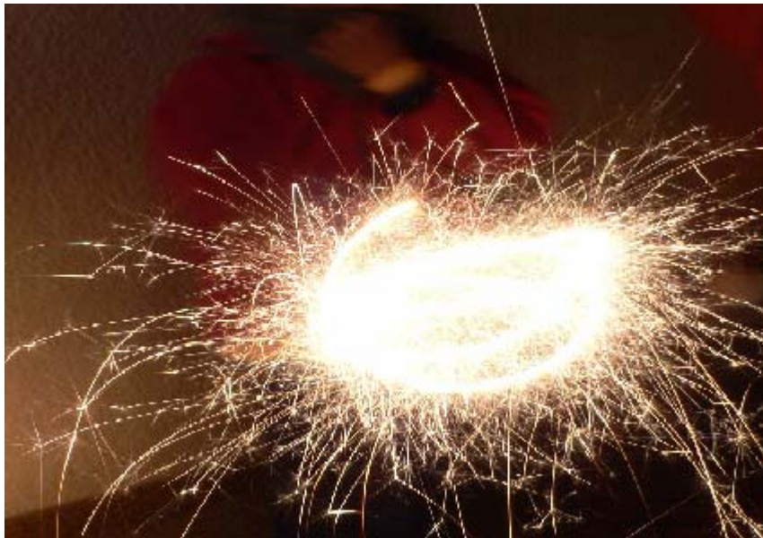
FIGURA 10 16

Es el periodo donde el gozo se mete en los poros, la gala se inicia, el día de las velas siete de diciembre, aquí parte el ciclo corto que finalizara el seis de enero, los habitantes van enfilando las fuerzas para arrancar con todo a celebrar, ya con esta conmemoración la rutina se rompe, la cotidianidad se trastoca y se dispone el espíritu para los días que vienen de dicha y festejo.