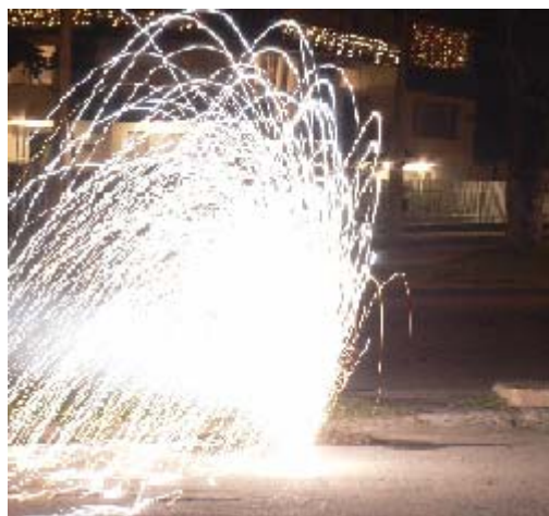
FIGURA 62 69