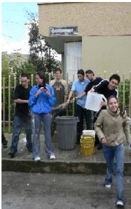
FIGURA 57 65

El juego inicia desde las primeras horas de la mañana, no importa el frío, y que mejor si hace sol, los jugadores se arman de los instrumentos, ropa cómoda, bombas, y baldes con agua, se ubican en las terrazas tímidamente a la espera de un despistado transeúnte, a medida que el día avanza la acción se torna más inquietante, ya no solo hacen participe a quien pasa por calle sino que se inicia la guerra entre terrazas, la idea es que nadie quede seco, para seguir en el diversión hay que tener agua, quien la tiene, tiene el poder.