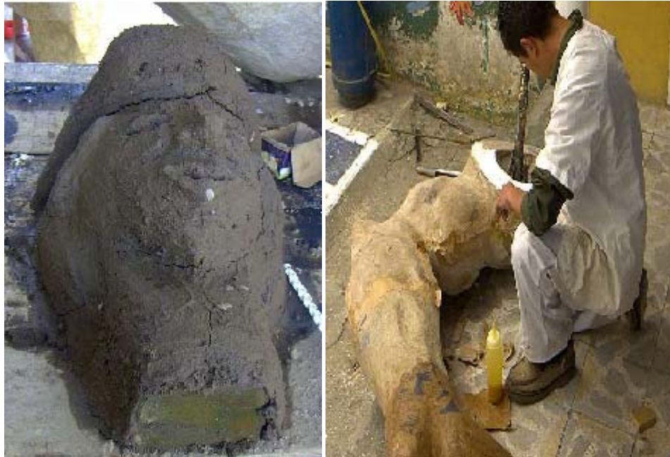
FIGURA 27, 28 41