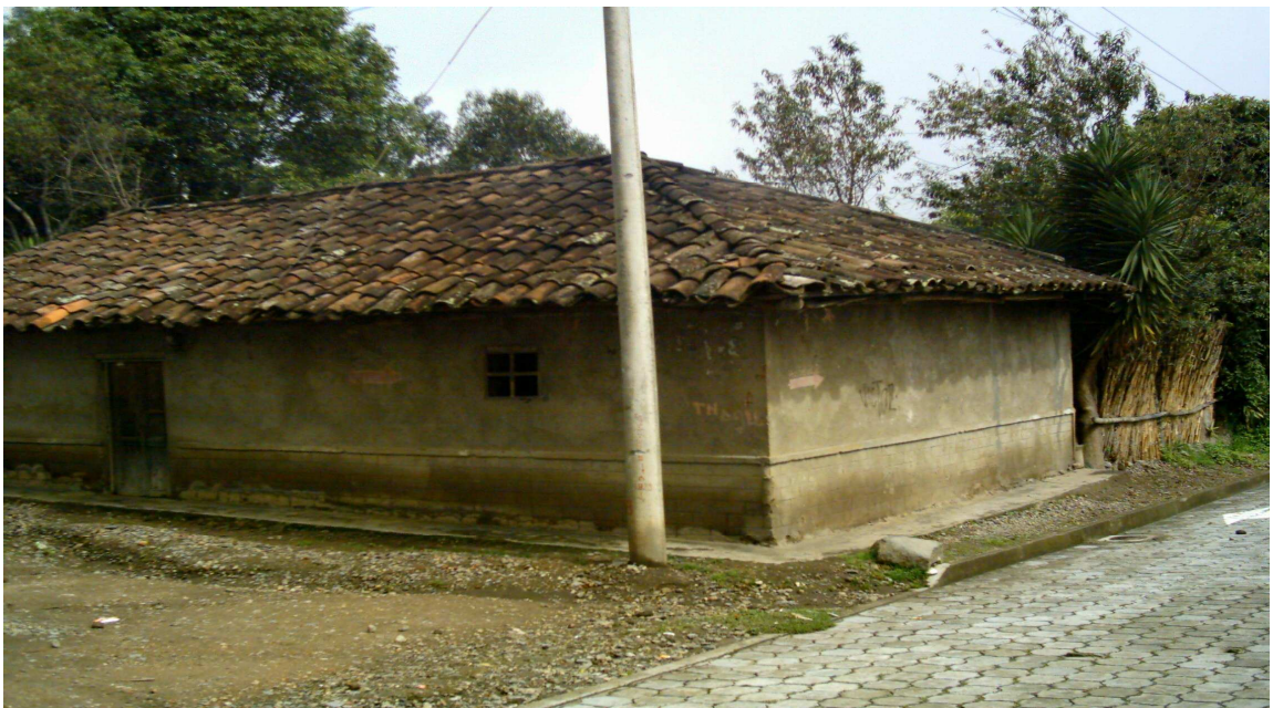
Figura 3. Vivienda genoyes.

“De modo general y hasta hace algunos años, la construcción de la vivienda se hacía en barro y madera, techo de paja y piso de tierra. Hoy en día predominan las construcciones de barro y madera, adobón en su gran mayoría, el piso de tierra y algunas de baldosa o cemento. Las de ladrillo, cemento y piso embaldosado son las más recientes. La utilización de materiales foráneos como: cemento, ladrillo y baldosa, entre otros, es para sus pobladores un indicador de bienestar económico y prestigio. El techo, igual para todas, es teja de barro. Las viviendas alejadas del sector nucleado están construidas con barro y madera, techo de paja y piso de tierra.