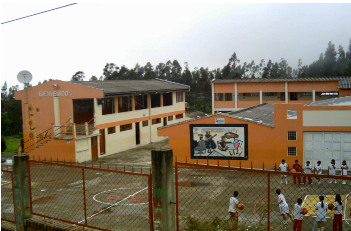
Figura 6. Sede: Colegio “Francisco de la Villota”