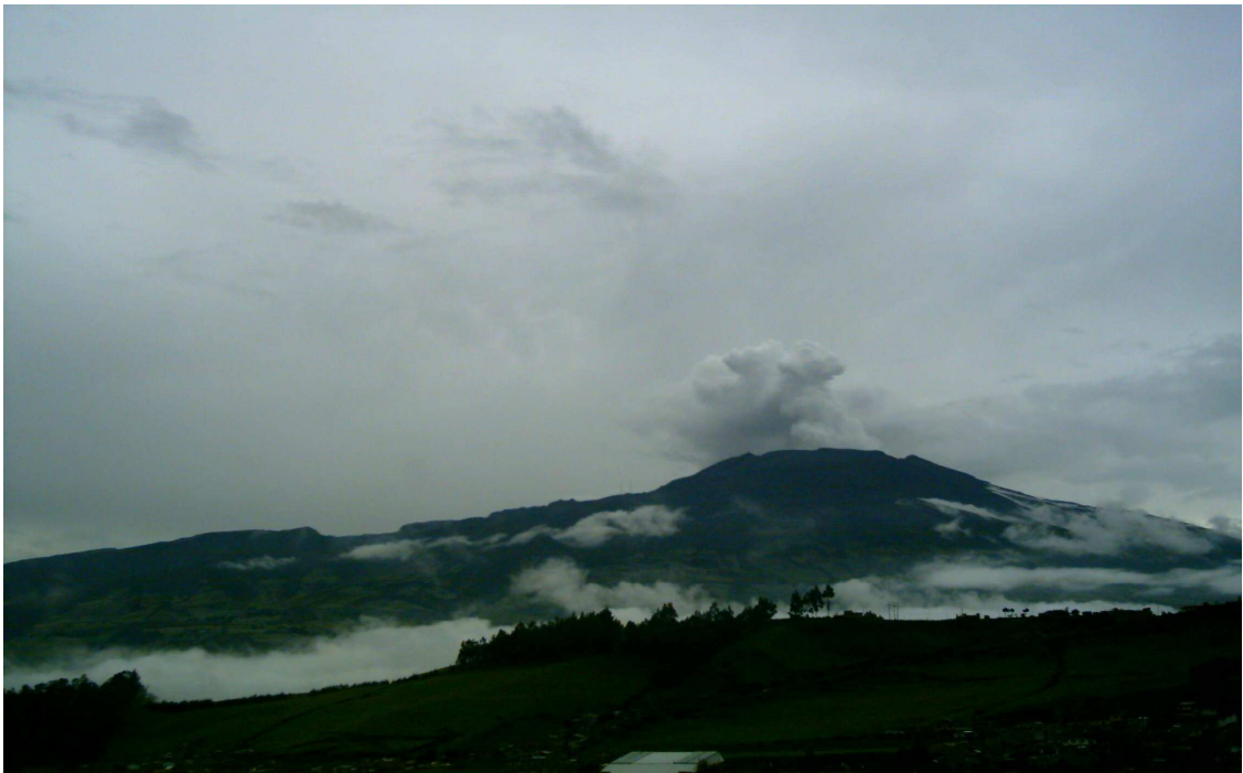
Figura 1. Panorámica del volcán Galeras.

Este departamento, que tiene una extensión de 33.268 km. 2 , es el más volcánico de Colombia, pues en su territorio se ubican los volcanes Azufral, Chiles, Cumbal, Doña Juana y Galeras.