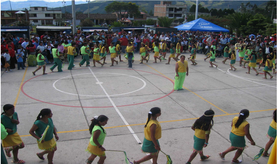
Figura 14. Coreografía sede colegio.

para lo cual, se dictaron unos talleres de elaboración de mascararas en diferentes materiales como: arcilla, yeso, papel y cola.