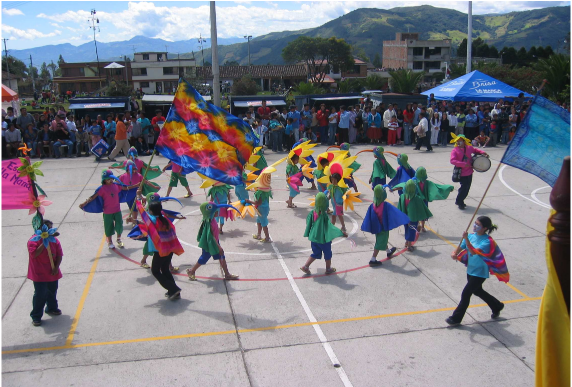
Figura 11. Coreografía: el Quinde pájaro de fuego.