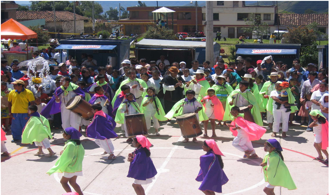
Figura 12. Coreografía: sede escuela Genoy.

sobre las tradiciones de tipo cultural y religioso del corregimiento de Genoy, para ello se contó con la participación de la comunidad educativa y contextual. La segunda actividad se enfocó en el diseño del vestuario que utilizarían los participantes en la danza y paralelamente se realizaban ensayos de la coreografía. La tercera y última actividad se concentró en la puesta en escena de la muestra, se confeccionaron los ciento cuarenta vestidos con cinco prendas cada uno, se contrató una papayera y se construyó la carroza representativa.