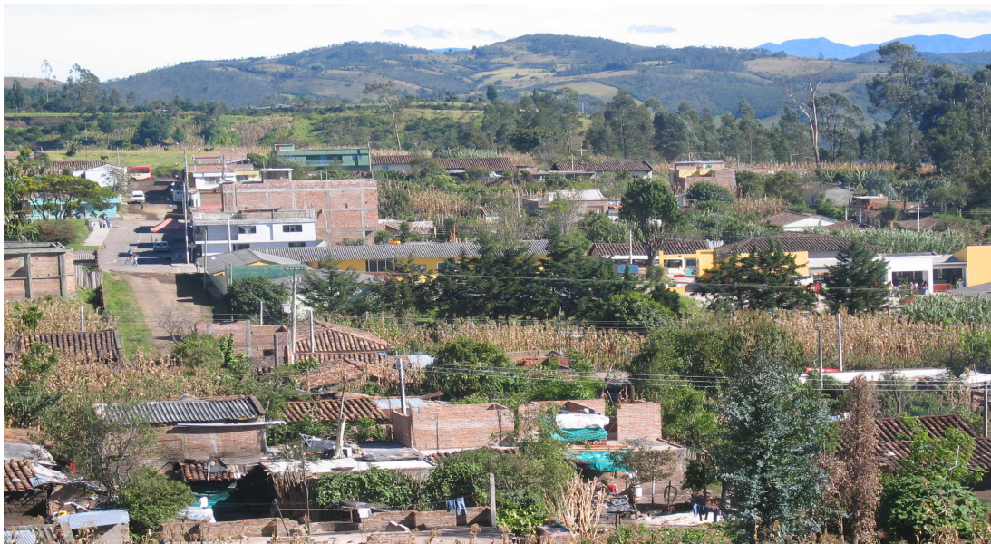
Figura 2. Casco urbano del corregimiento de Genoy.