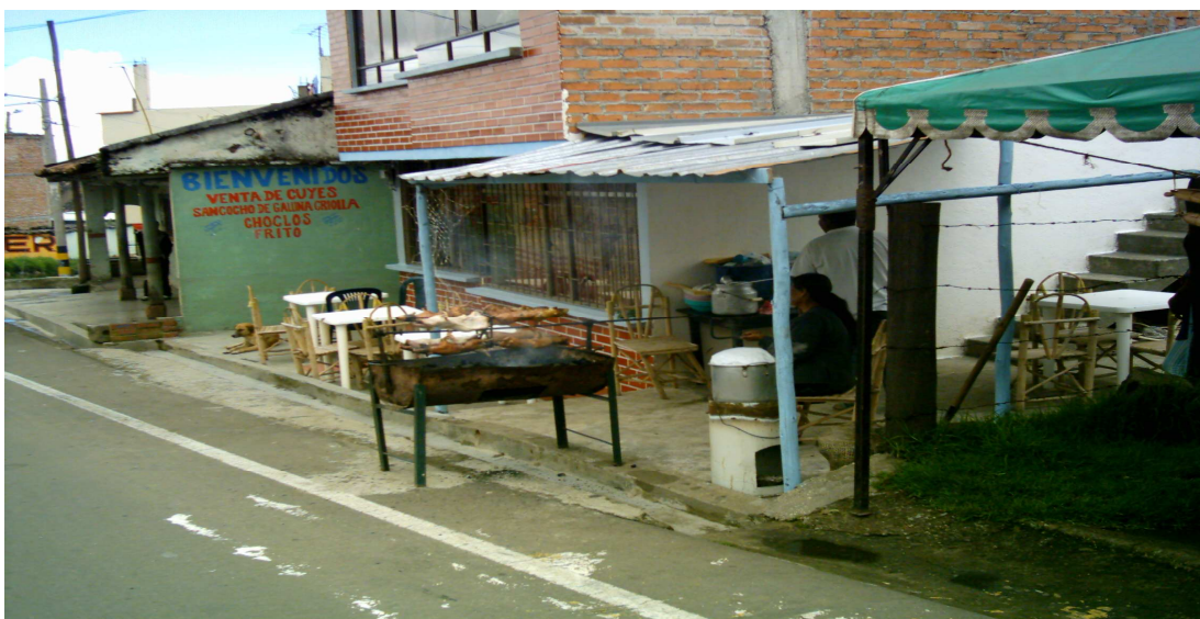
Figura 5. Venta dominical de cuyes.

El turismo es reconocido como una actividad de importancia económica para los Genoyenses, ya que es una fuente importante de ingresos personales para algunas familias, las cuales día a día tratan de preparar mejor los platos que ellas venden para poder ganar más clientela y ser reconocidos por los visitantes.