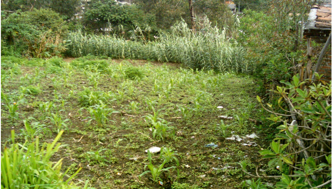
Figura 4. Cultivo de maíz y cañoto.