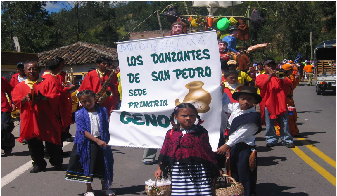
Figura 13. Carroza: los danzantes de San Pedro.