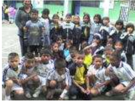
Estudiantes grado 3-1