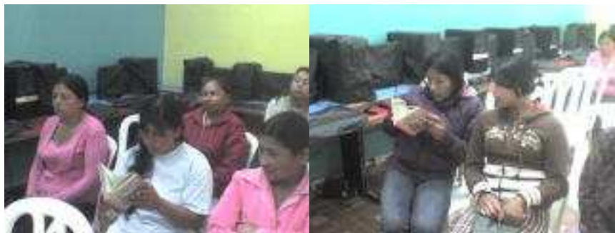
Taller con padres de familia