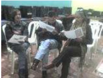
Taller con docentes del grado 3º