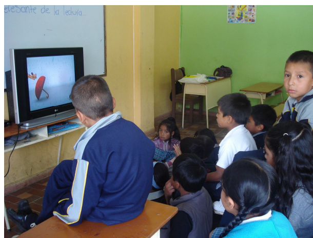
Talleres con estudiantes del grado 3º