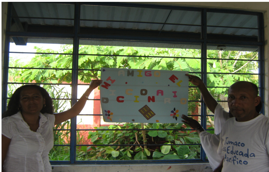
Figura 9. Promoviendo la estrategia: “Mi amigo el diccionario”