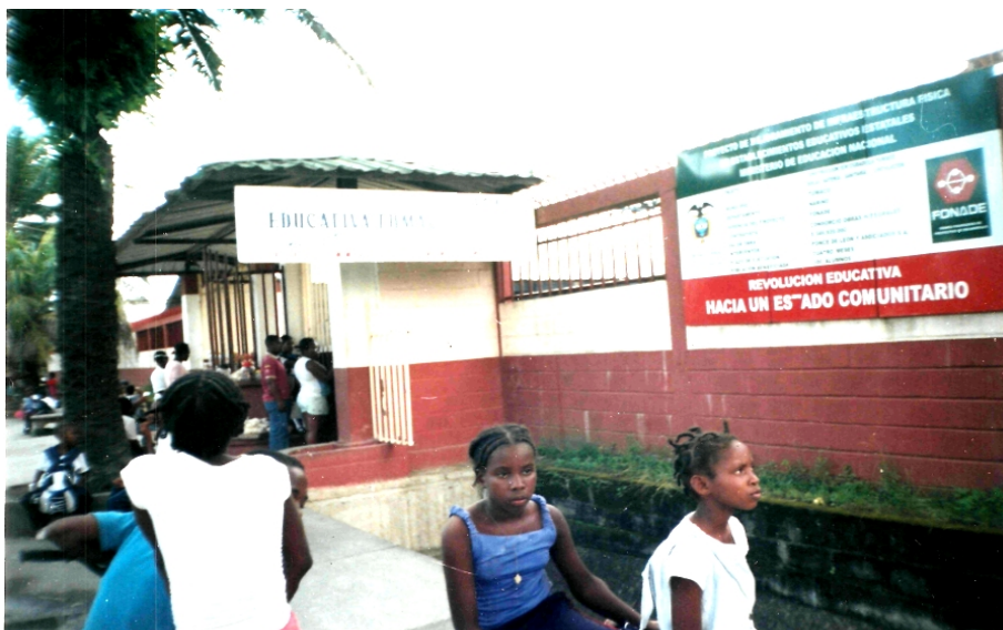
Figura 1. Planta física de la Institución Ciudadela Educativa Tumac