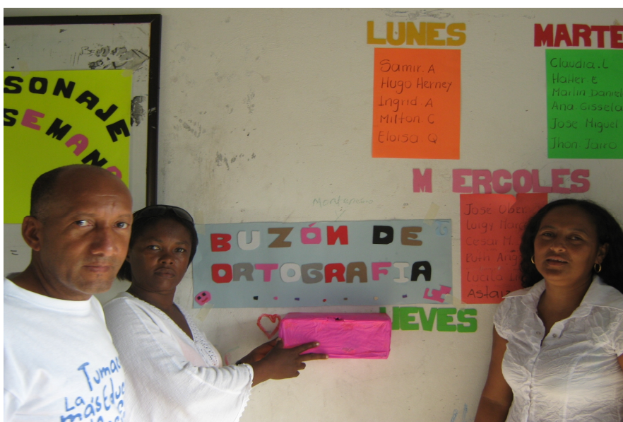
Figura 5. Estrategia del buzón de ortografía