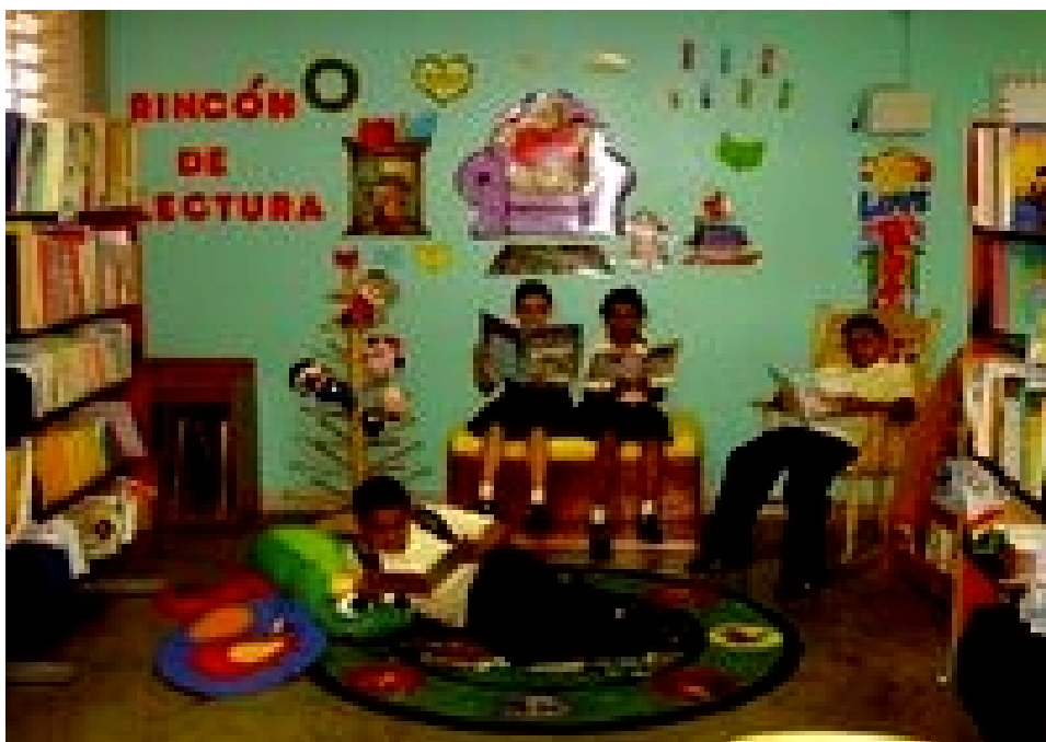
Figura 14. El rincón de lectura, nuevo espacio para el goce y disfrute de la lectura