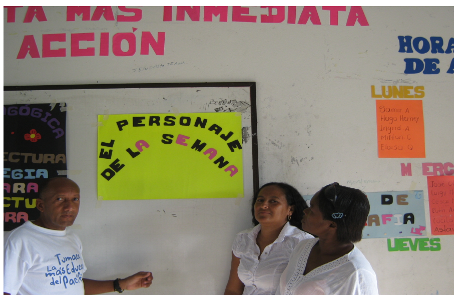
Figura 3. Invitación a ser el personaje de la semana