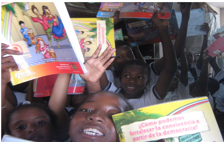
Figura 13. En el rincón de lectura, los estudiantes observan el material de trabajo