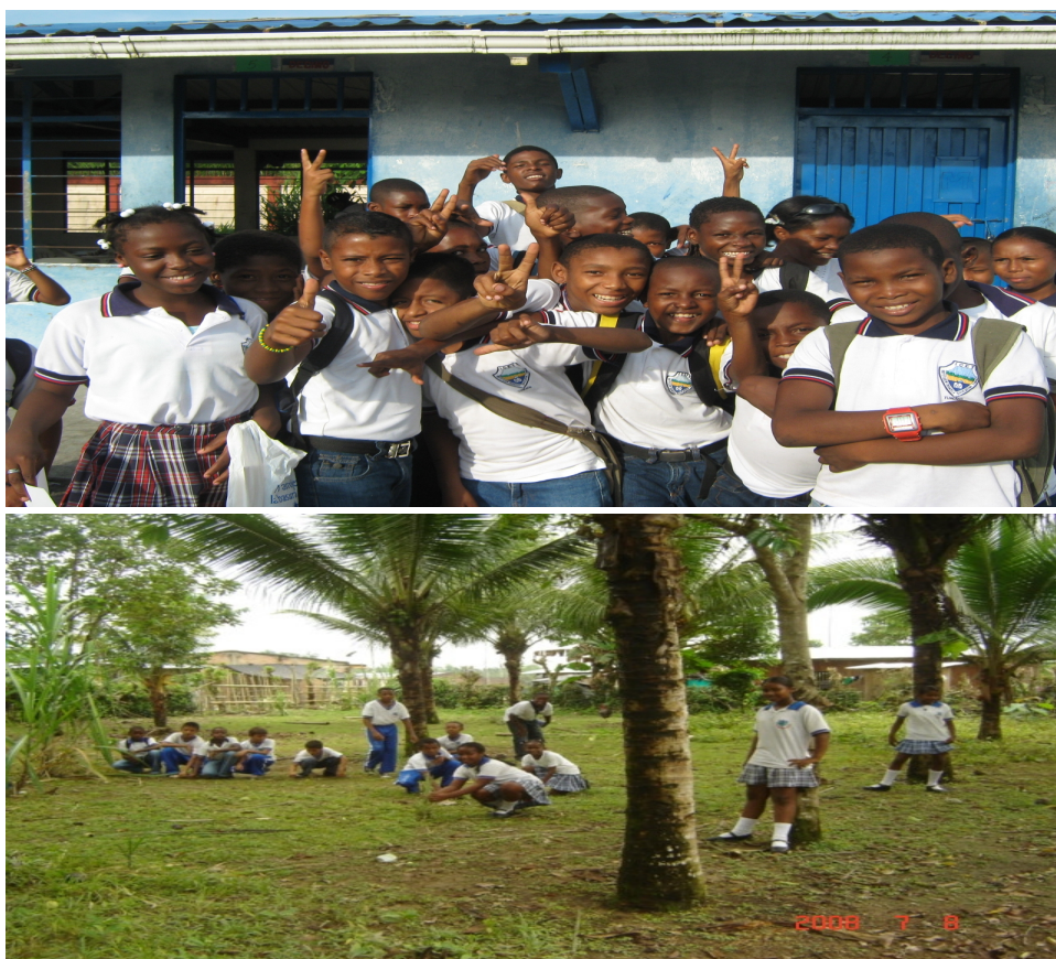
Figura 12. Al aire libre, debajo de los árboles, nuevos escenarios de aprendizaje