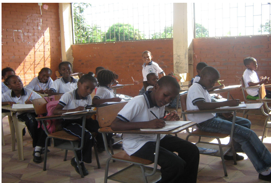
Figura 6. Los niños toman el dictado correctivo