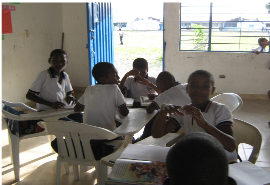
Figura 10. Los estudiantes leen y narran cuentos