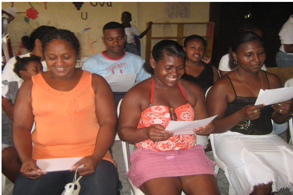
Figura 15. Los padres de familia, se vinculan al trabajo del aula