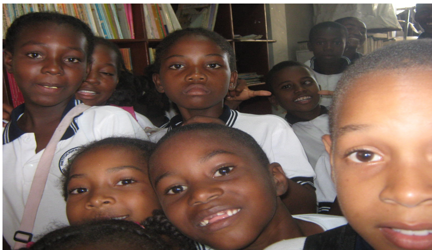
Figura 11. En la biblioteca, escenario de aprendizaje