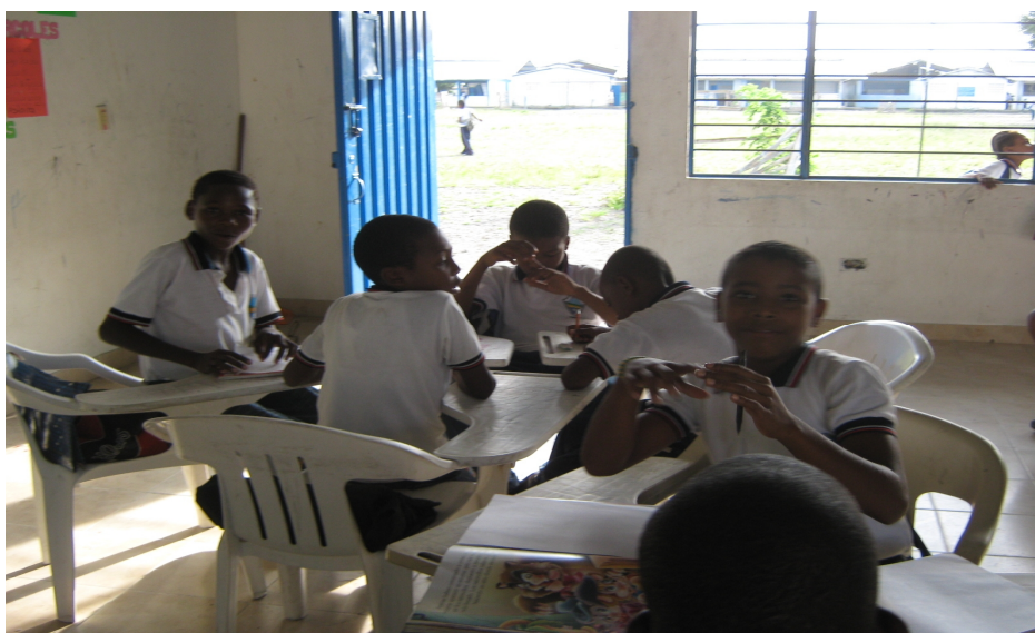
Figura 2. Realizando producciones con base en las fábulas