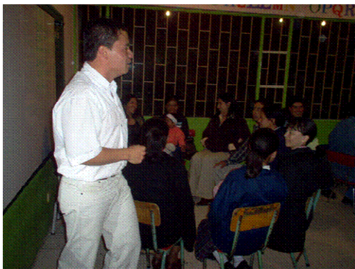
Foto 6. Facilitando la parte Teórica

Nota: todo lo que aquí se consigna es lo más relevante de los aportes de los padres y todo se construyo de mutuo acuerdo entre el padre de familia y el investigador.