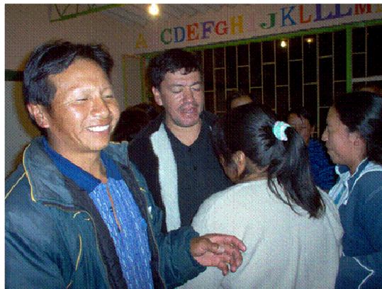
Foto 7. Dinámica para romper el hielo