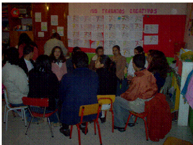
Foto 5. Trabajando en grupo

Nota: todo lo que aquí se consigna es lo más relevante de los aportes de los padres y todo se construye de mutuo acuerdo entre el padre de familia y el investigador.