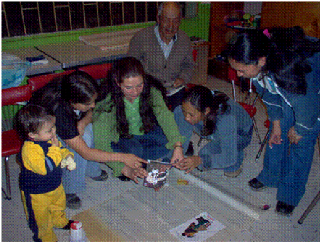
Foto 1. Construcción del programa de escuela de padres

Manejo inadecuado de pataletas, por lo cual se entenderá lo siguiente: manifestación acompañada por gritos y llantos exagerados por parte del niño o la niña frente a una exigencia que le hacen sus padres.