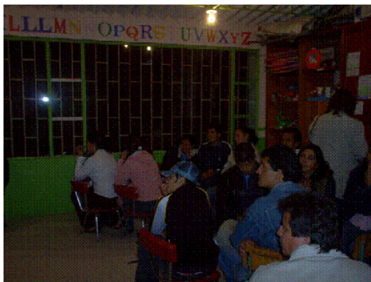
Foto 4. Observando el video