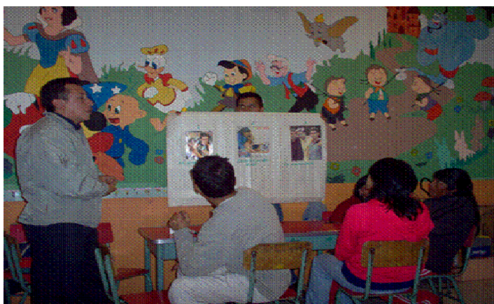
Foto 3. Socializando la propuesta

De esta manera se acordó con todos los padres de familia que el programa de escuela de padres estaría conformado por los tres ejes de acción antes mencionados y que cada tema se guiaría conforme a la propuesta que hizo cada grupo en la socialización; todos los participantes manifestaron estar de acuerdo con lo establecido.