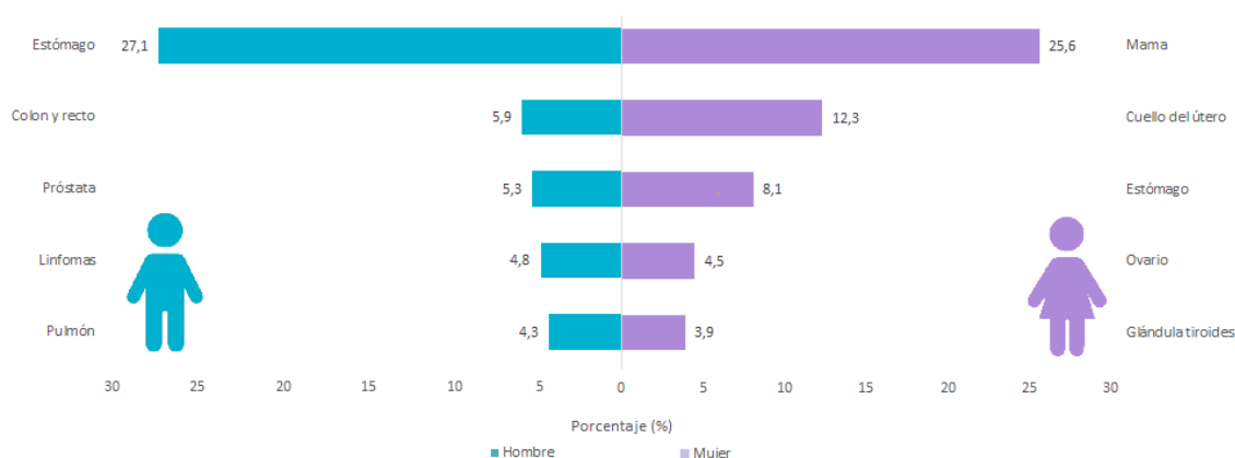
Gráfica 3. Porcentaje de tumores malignos por género, según localización. Fundación Hospital San Pedro 2011.