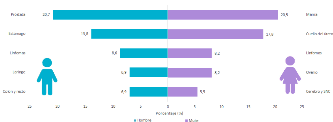
Gráfica 3. Porcentaje de tumores malignos por género, según localización. Instituto cancerológico de Nariño 2011.