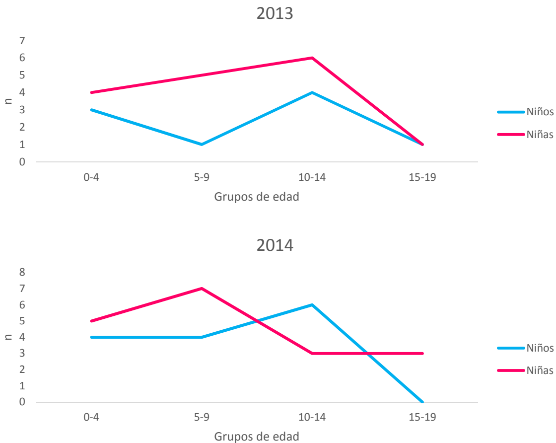
Gráfico 2. Casos de cáncer de comportamiento maligno por sexo, según grupos de edad. Hospital infantil los ángeles 2013-2014

Fuente: Registro Poblacional de Cáncer Municipio de Pasto. Centro de Estudios en Salud Universidad de Nariño. Base de Datos RPCMP. Pasto; UDENAR; 2018.