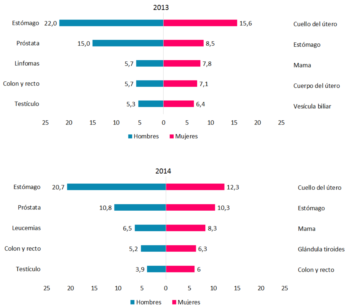
Gráfico 3. Porcentaje de tumores malignos por sexo, según localización. Hospital Universitario Departamental de Nariño 2013-2014

Fuente: Registro Poblacional de Cáncer Municipio de Pasto. Centro de Estudios en Salud Universidad de Nariño. Base de Datos RPCMP. Pasto; UDENAR; 2018.