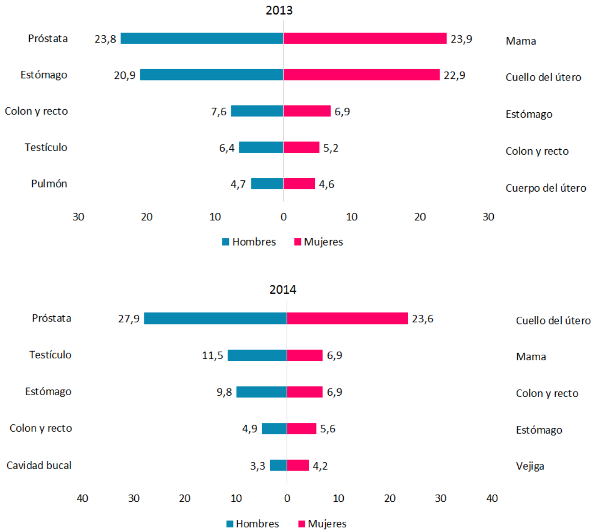
Gráfico 3. Porcentaje de tumores malignos por sexo, según localización. Instituto Cancerológico de Nariño 2013-2014

Fuente: Registro Poblacional de Cáncer Municipio de Pasto. Centro de Estudios en Salud Universidad de Nariño. Base de Datos RPCMP. Pasto; UDENAR; 2018.