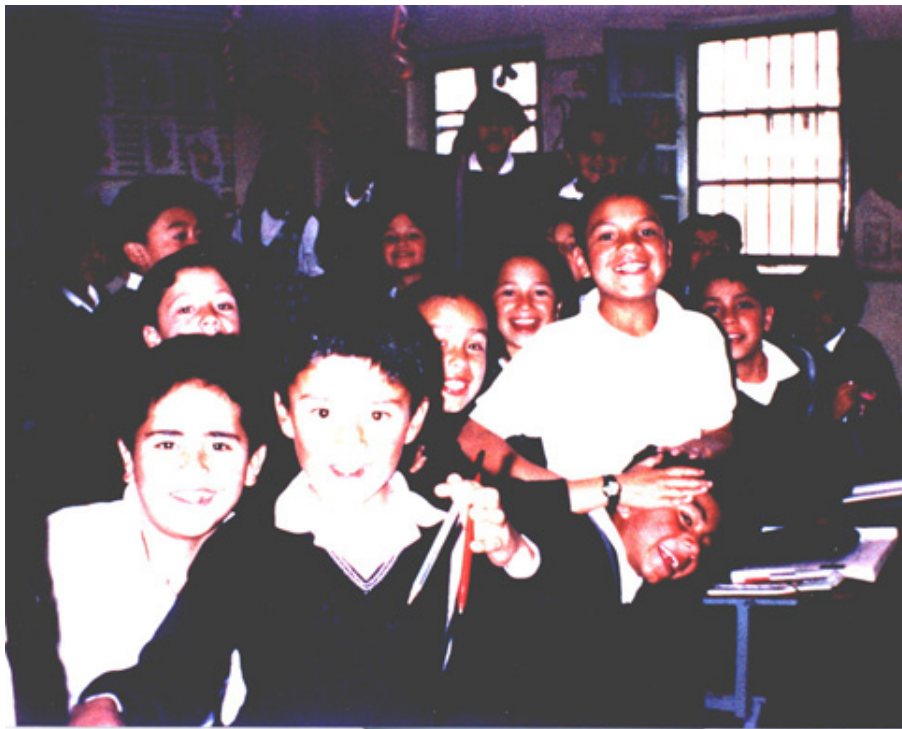
Figura 4. Entrevista a estudiantes

En cambio otros docentes optan por reflexionar, analizar y cuestionar los resultados de sus alumnos. Pero también cabe destacar las opiniones de algunos docentes que reaccionan con insatisfacción, decepción, preocupación y a veces se sienten defraudados porque los resultados evaluativos obtenidos no eran lo que ellos esperaban, como lo menciona en su respuesta un docente así: “Hay muchas veces que uno se siente defraudado porque uno está enseñado a evaluar conocimientos, pero sin embargo es importante este proceso donde se tiene en cuenta todos los aspectos positivos y negativos, sicomotores y socioafectivos”.