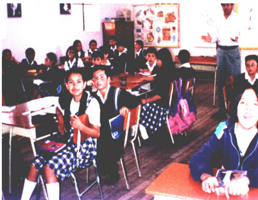
Figura 1. Observación de clases

Pero la debilidad radica en que cada profesor dirige el criterio de evaluación y la eficacia y efectividad del proceso dependen de la preparación de cada uno, y en la institución no se han realizado estudios concretos sobre evaluación para capacitar a los docentes. Los talleres que se han llevado a cabo han servido para aplicar nuevas metodologías y temáticas pero como ellos dicen el tiempo dirá si lo están haciendo bien o mal.