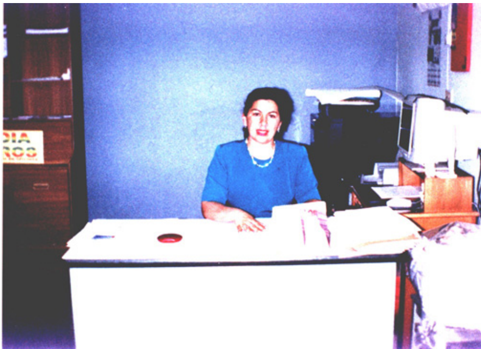
Figura 2. Entrevista con directivos

los propósitos planteados dentro de las bases legales y de la misma institución, con el fin de brindar a la sociedad personas capaces de desenvolverse en cualquier ámbito.