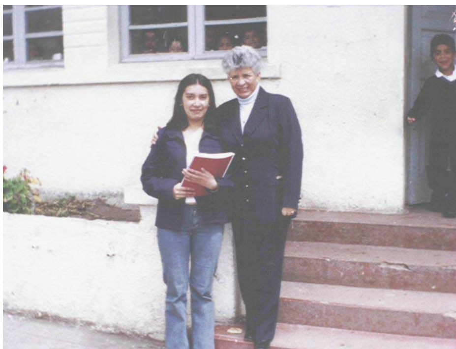
Figura 3. Entrevista con profesores

proceso”. Los directivos son los encargados de dirigir y tomar las decisiones en torno a la evaluación.