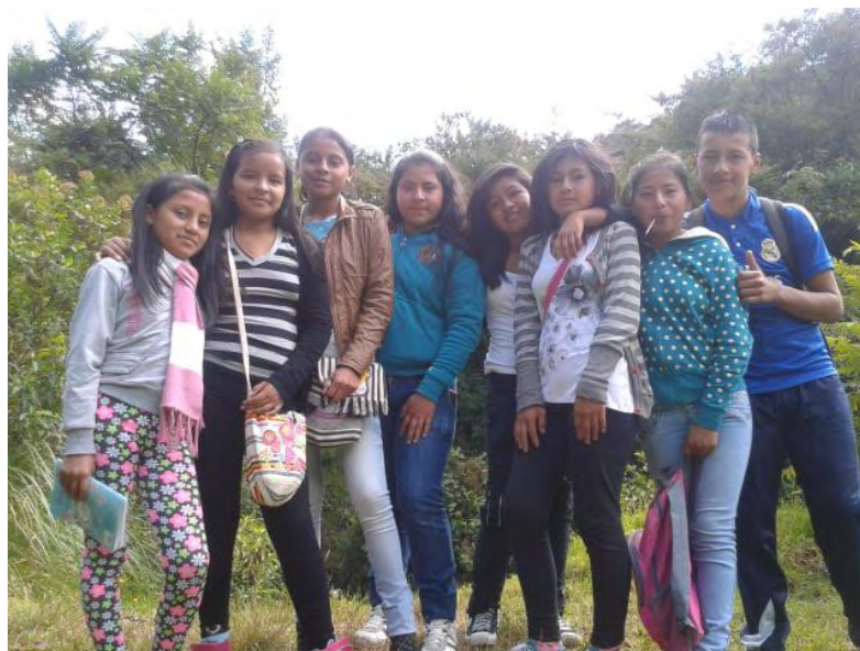
Fotografía C2. Todo el grupo participante que acompañó la realización de la actividad.