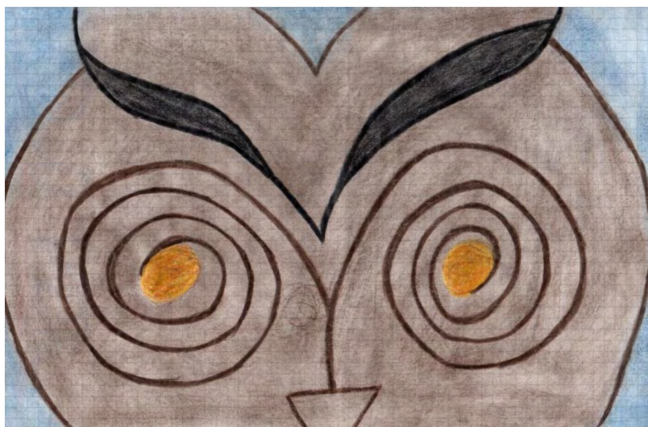
Figura 10. Obra impactante. Dibujo: Mayli Viviana Melo Daza.

Pintar cuadros o murales no es aburrido, como otra gente piensa; al contrario, es lo más emocionante que hay y que habrá siempre.