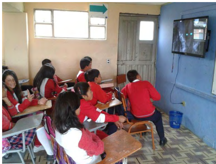
Fotografía A6. Algunos niños si muestran mucho interés en la Actividad.