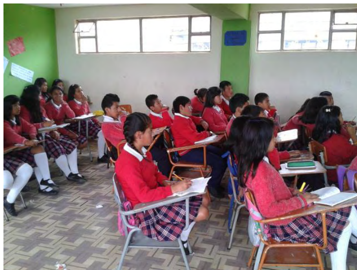
Fotografía A9. Evidencia de Atención en los niños al realizar la actividad.