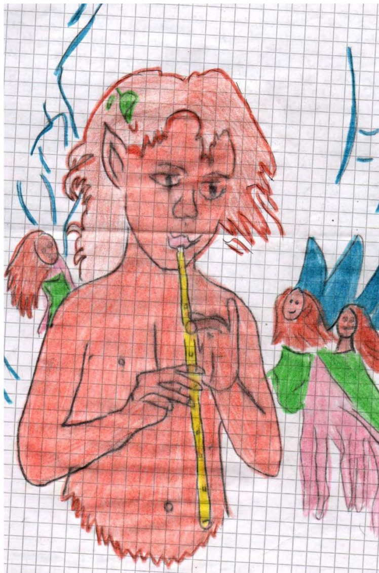
Figura 2. El duende niño. Dibujo de Yuliana Gomajoa.

—¿Dónde está tu mamá?—y él les contestó: