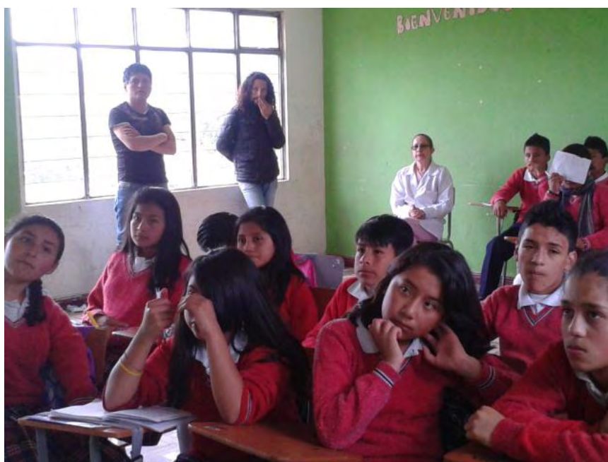
Fotografía B4. El Maestro presenta un corto video en el que pinta un mural.