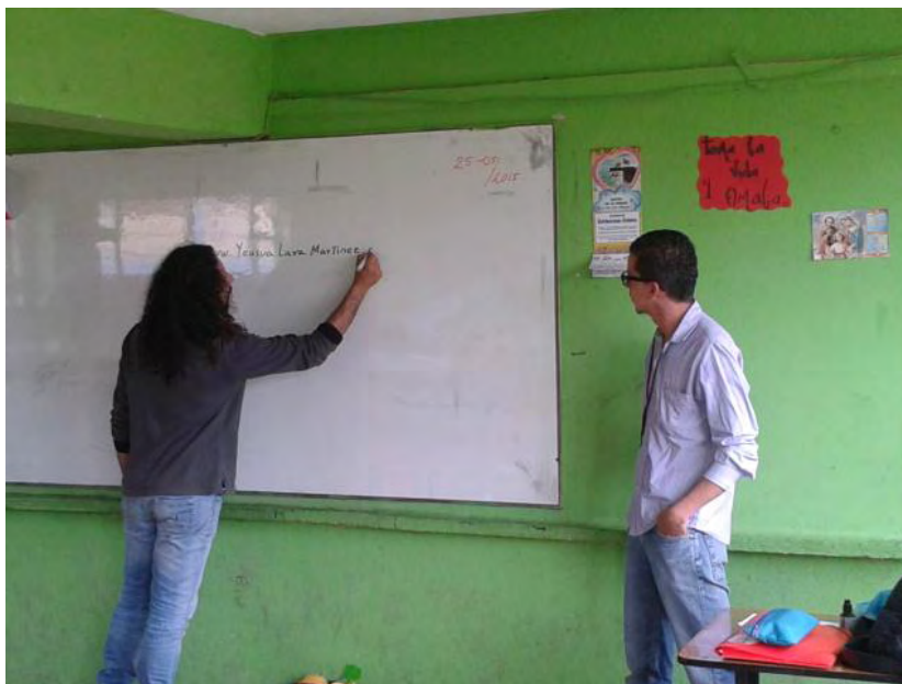
Fotografía B1. Presentación del Maestro de Artes.