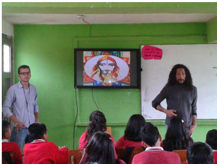
Fotografía B3. El Maestro presenta y comenta sus obras y aventuras a los niños.