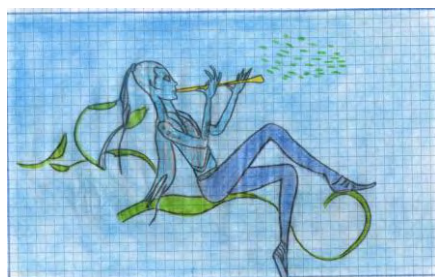
Figura 6. La imagen misteriosa. Dibujo de: Aylin Yuliana Gomajoa López.

—No, m' hija, no me va a pasar lo mismo que a tu padre; yo sé hasta dónde bebo tranquilo; yo me sé cuidar solo.