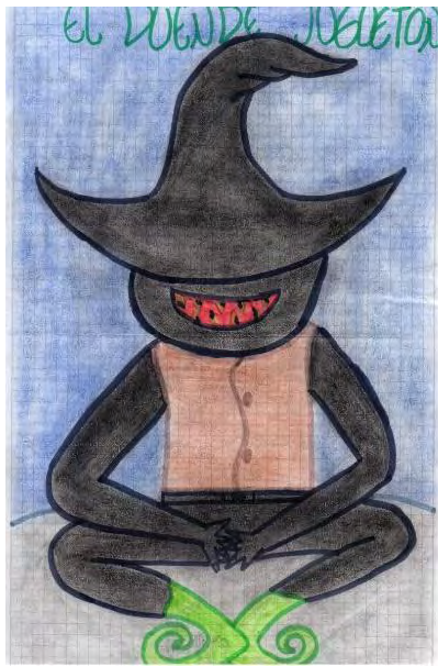
Figura 8. El Duende Juguetón. Dibujo: Maily Viviana Melo Daza.