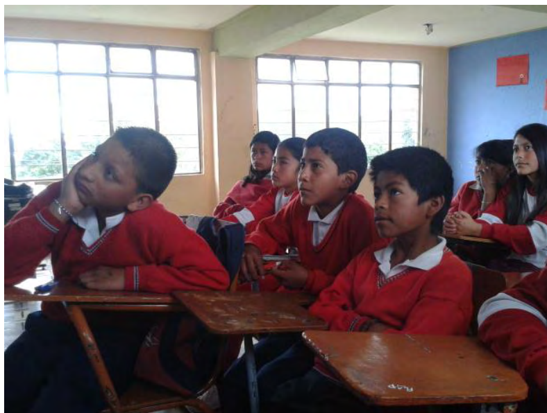
Fotografía A7. Evidencia de interés y concentración en la realización de la Actividad.