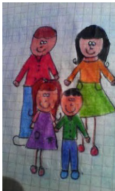
Figura 5. La Llorona y su familia. Dibujo de Angielly Eliana Jenoy Criollo.

—Del problema que te molestaba, nuestros hijos; esos mocosos ahora están muertos y, mi amor, ahora sí me vas a querer.