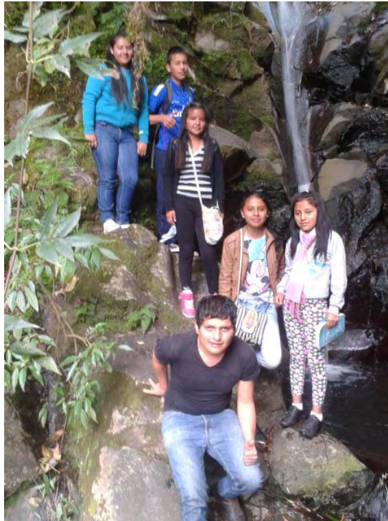
Fotografía C3. En la Cascada los niños se muestran más activos e inspirados por la naturaleza.