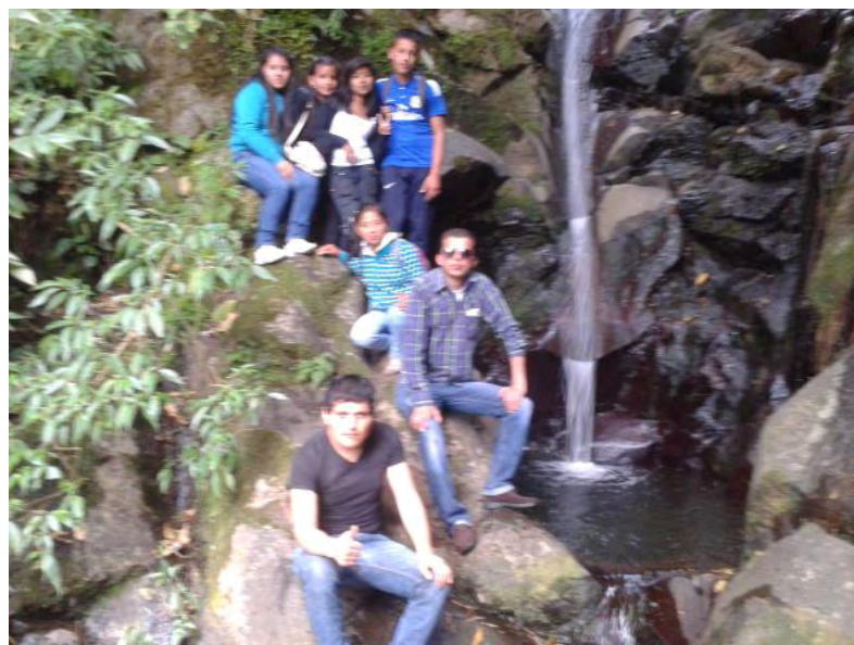
Fotografía C4. Panorámica del grupo de trabajo.