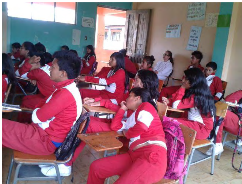
Fotografía A8. La Profesora del área de Filosofía supervisaba la actividad.