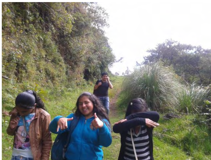
Fotografía C1. Ya casi se llega a la Cascada, muestra de timidez en las niñas.