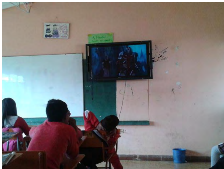
Fotografía A5. Y... si me ubico mejor veo con atención la película?