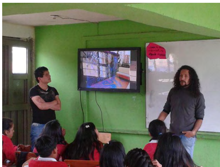
Fotografía B2. El Maestro charla con los estudiantes y ellos muestran atención.