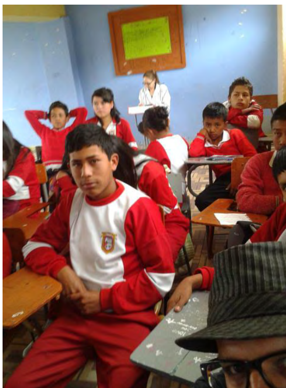
Fotografía A10. Evidencia de Curiosidad y Disposición para realizar la Actividad.