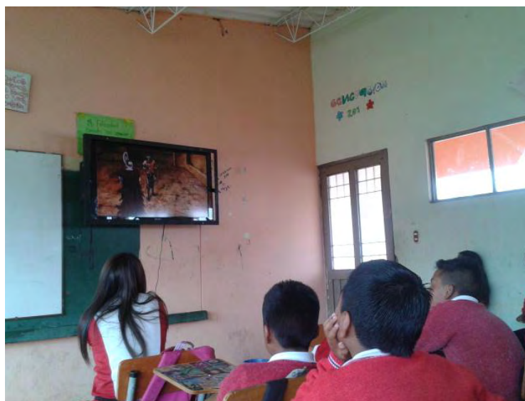
Fotografía A2. Niños observando la película del Infierno de Dante