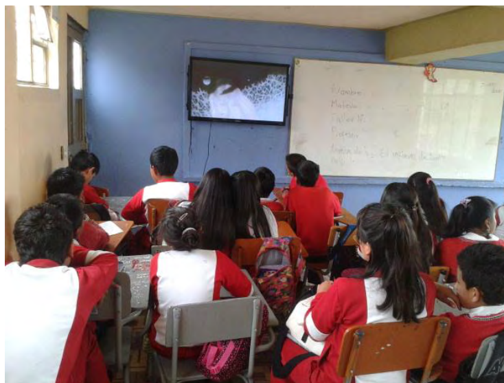
Fotografía A1. Instrucciones en el tablero para la creación literaria.