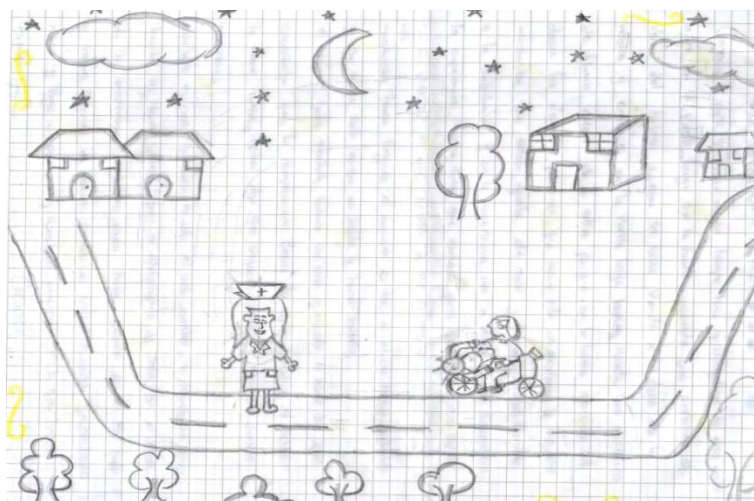
Figura 3. La enfermera. Dibujo de Angie Katerine Guerra Yaqueno.

Contaba mi papá que hace mucho tiempo, hace aproximadamente unos cinco años, en La Vuelta Larga, se le había aparecido una enfermera; él venía del trabajo a casa, se había venido a las doce la noche y, entonces, en La Vuelta Larga, había mirado una muchacha de blanco entero; él no sabía porqué se le había aparecido; solo decían las demás personas que había habido un accidente y era una muchacha que estaba a punto de morir y, entonces, habían llamado a la ambulancia y en la ambulancia iba el chofer y una enfermera. La enfermera había dicho que acelere, para que vayan más rápido, con más velocidad, porque estaba a punto de morirse la muchacha; había llegado el momento en que el chofer había acelerado y se había ido contra un bordo y habían muerto.