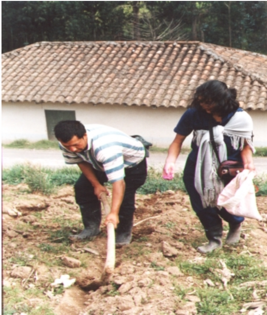
Figura 6. Sembrando maíz.

“La tierra produce el pan diario con la voluntad de Dios, para todo es Dios, la humanidad no tiene ningún poder” 6 .