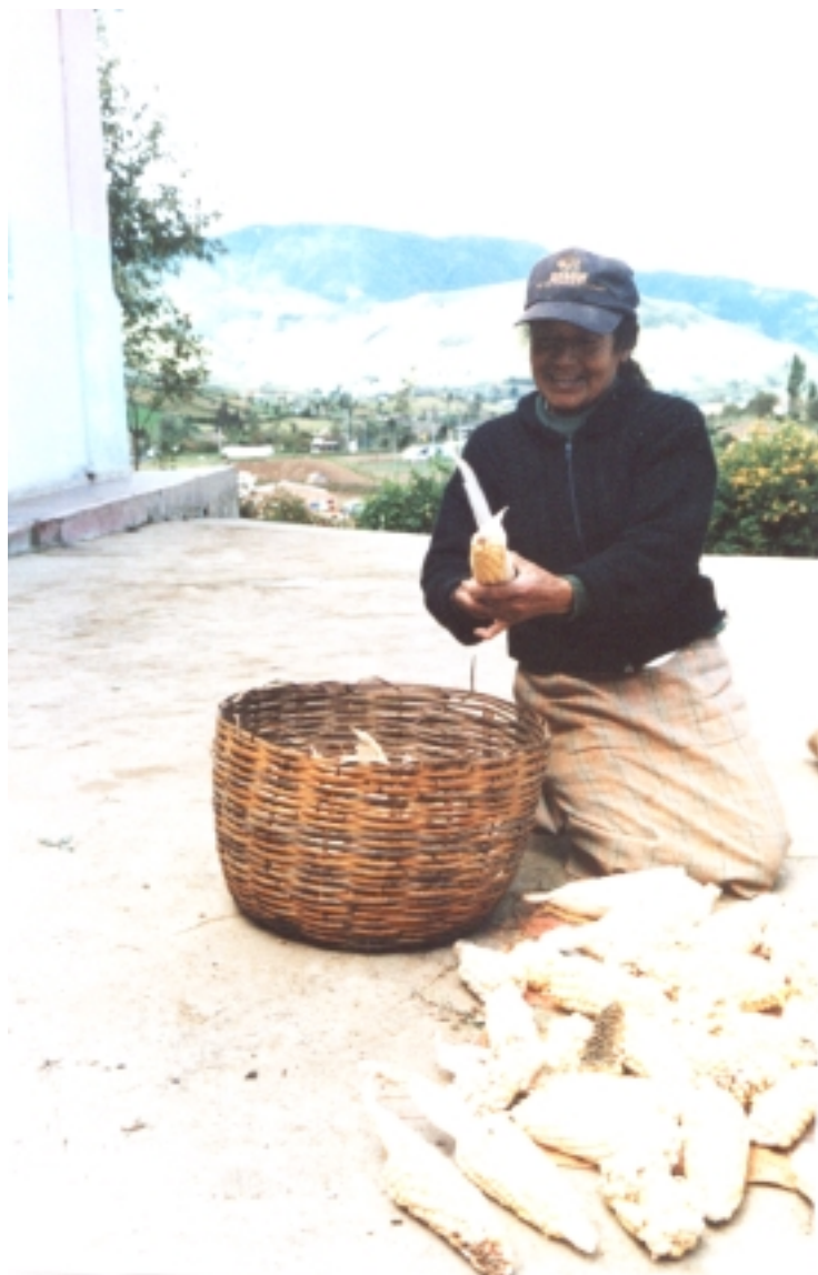
Figura 8. La mujer y el maíz.

respondió: “¿se acuerda? yo le dije al mono échele cinco, no más, más no, y qué