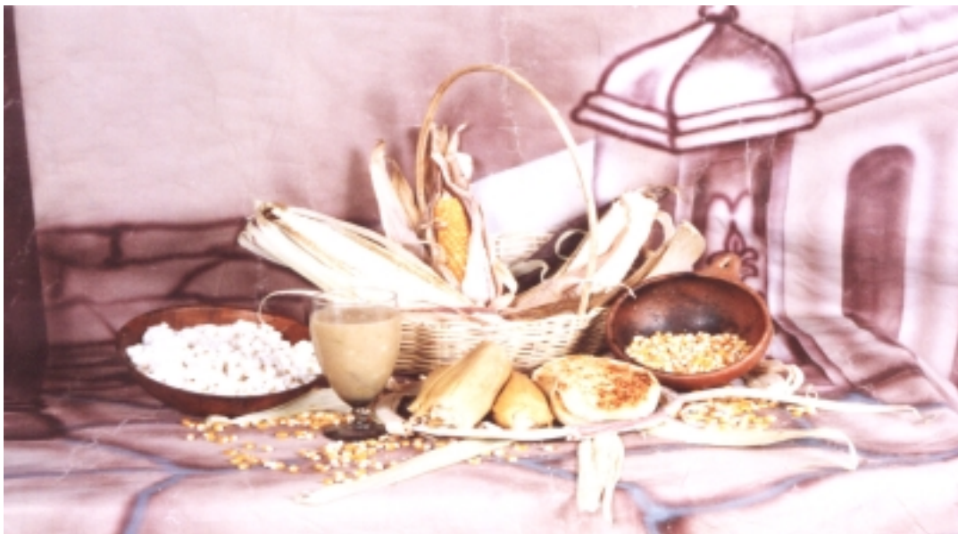
Figura 12. Alimentos del maíz.

“Se muele, se revuelve con huevo y se pone en la callana, se las pone a dorar despacio y se las sirve con café, quedan bien sabrosas” 68 .