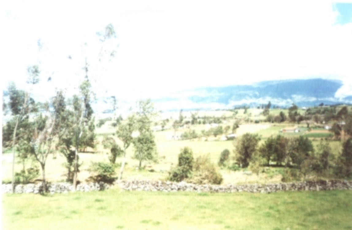
Figura 19. Vereda La Paz – Cabrera.

Entonces nuestra experiencia giro en torno a las inquietudes anotadas dentro del ámbito pedagógico, sobre una base etnoeducativa, el que se convertiría en nuestro campo de acción. Es desde ahí que debíamos responder inquietudes y