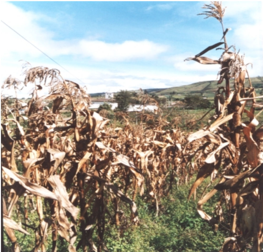
Figura 4. Maíz seco listo para abono.

La altura del maíz puede superar los 3 metros. Procedente de América Central, fue introducido en Europa en 1493, difundiéndose posteriormente su cultivo por todo el mundo.