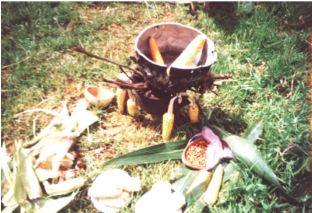
Figura 11. Productos del maíz.

“Arepas, envueltos con queso, con pollo. Con el maíz se hace tanta cosa linda” 52 .