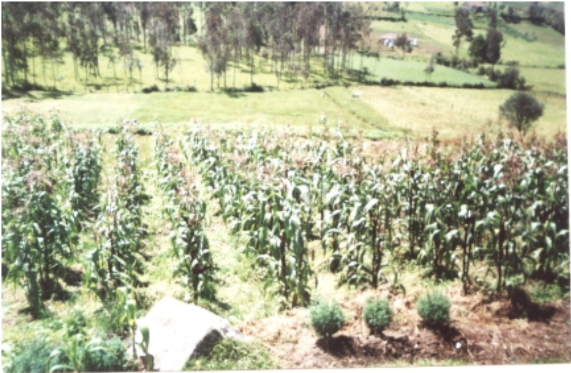
Figura 3. Plantaciones de maíz