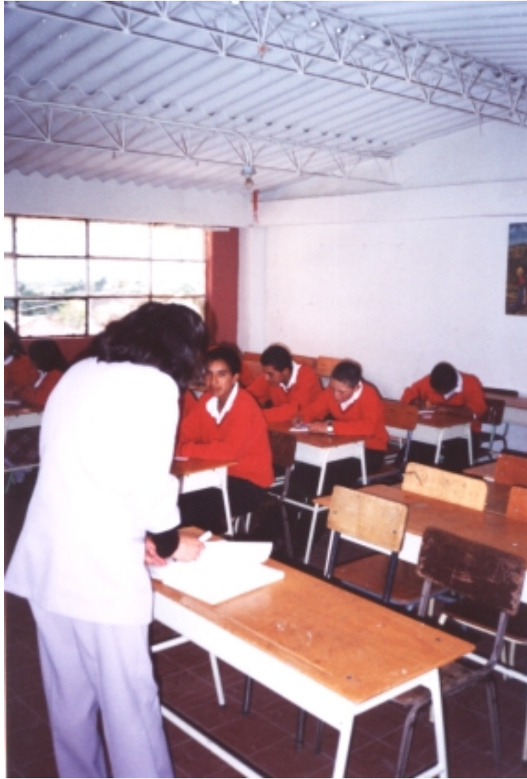
Figura 17. Socialización de la cartilla.

Ante esta significación los hombres de Cabrera, siembran y cosechan de tal forma que la actividad sea una muestra de su principio de cosmovisión, las propias técnicas para adecuar este espacio – tierra, son un canto que se vivifica al