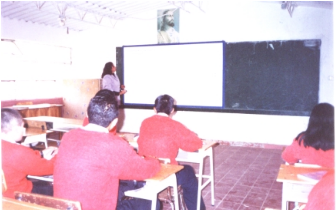
Figura 15. Herederos del saber.

La intención de este capítulo es profundizar sobre una propuesta que propenda por definir espacios orientados hacia la etnoeducación, a partir de las connotaciones sociales y culturales del maíz, y en este inferido todo un andamiaje de saberes, que pueden implementarse dentro de un plan de estudios.