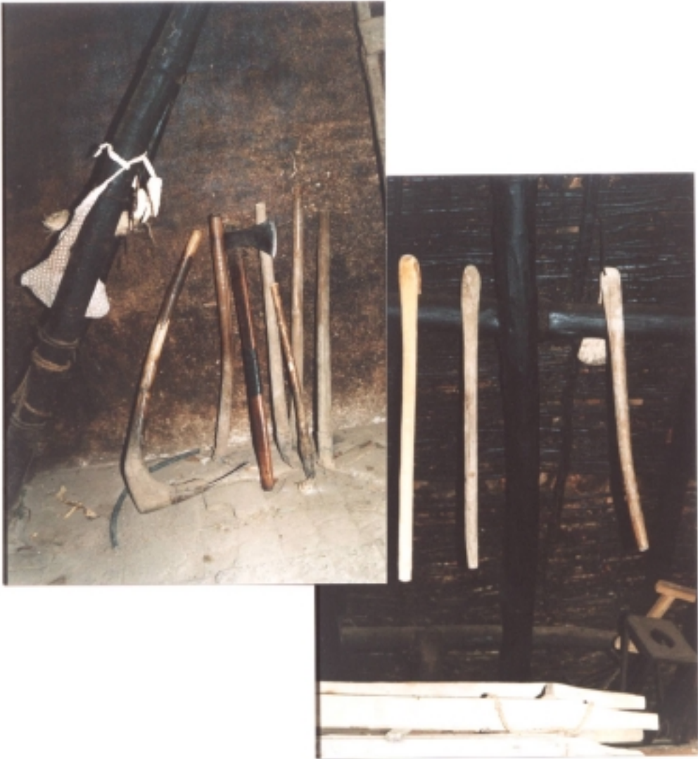
Figura 10. Algunas herramientas para sembrar y cosechar maíz.