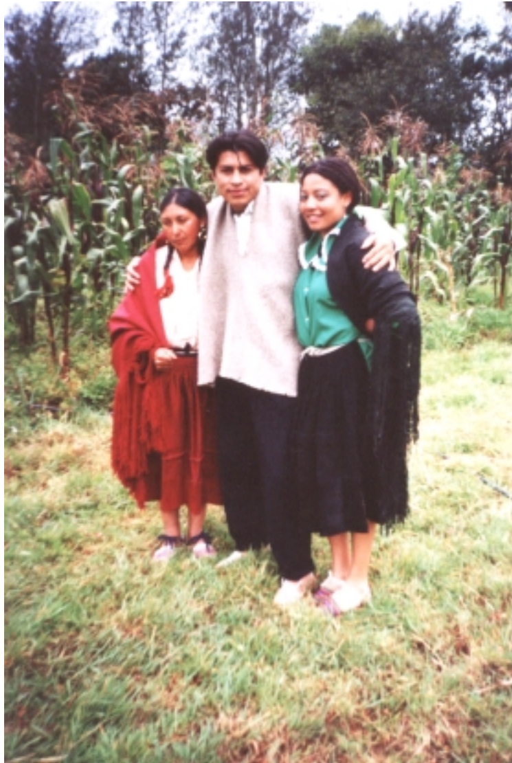
Figura 18. Contacto con la comunidad.