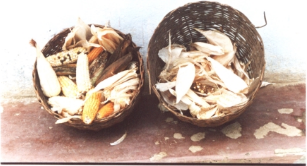
Figura 5. Maíz y frijol.