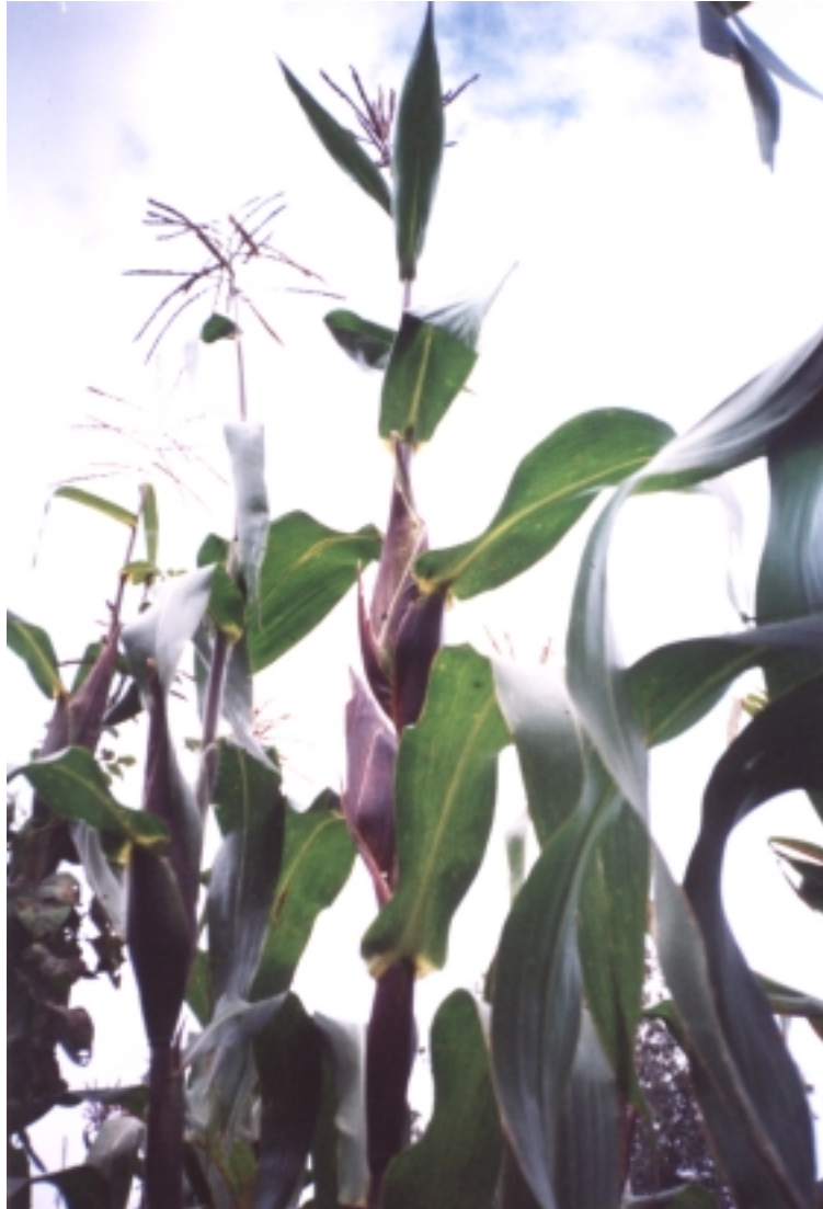
Figura 14. Maíz, regalo de los dioses.

Este brebaje se puede tomar frío o caliente, pero no debe nunca utilizarse cuando la inflamación de la vejiga provenga de un problema prostático.