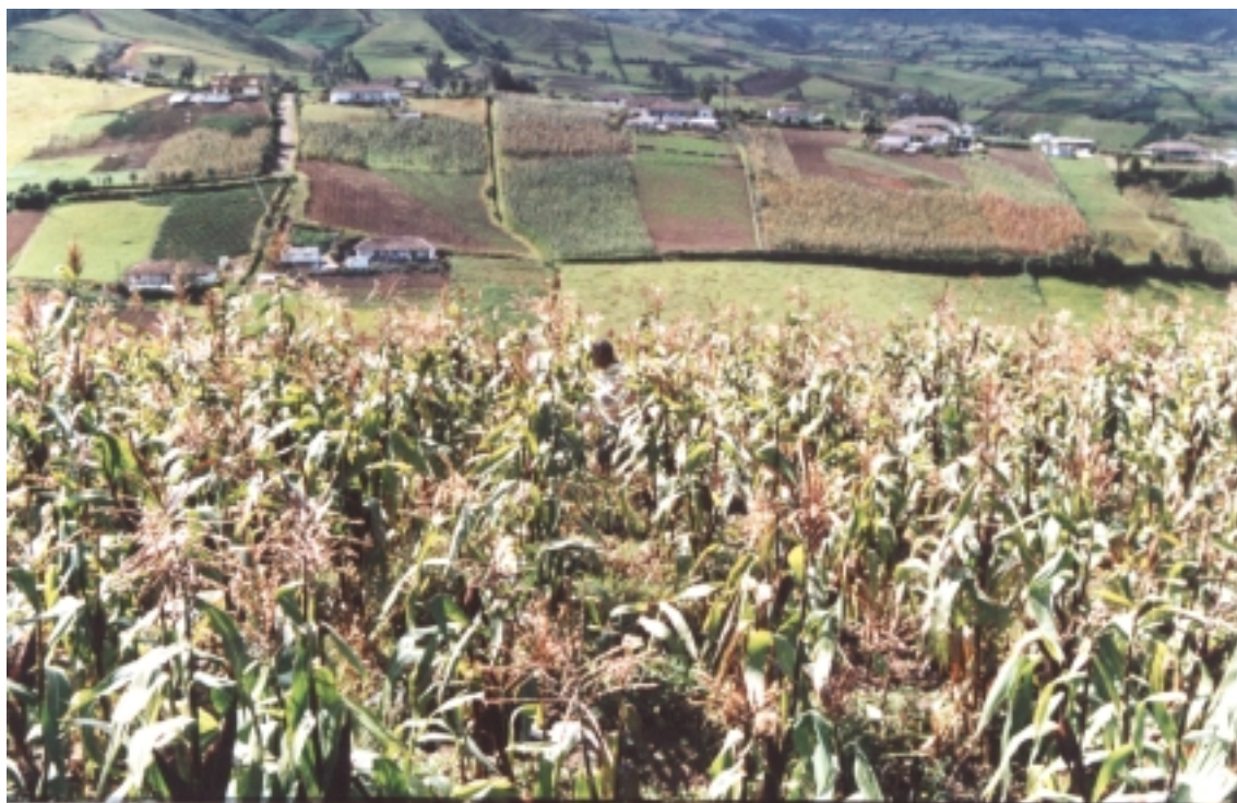
Figura 9. Plantación de maíz, vereda La Paz – Cabrera.