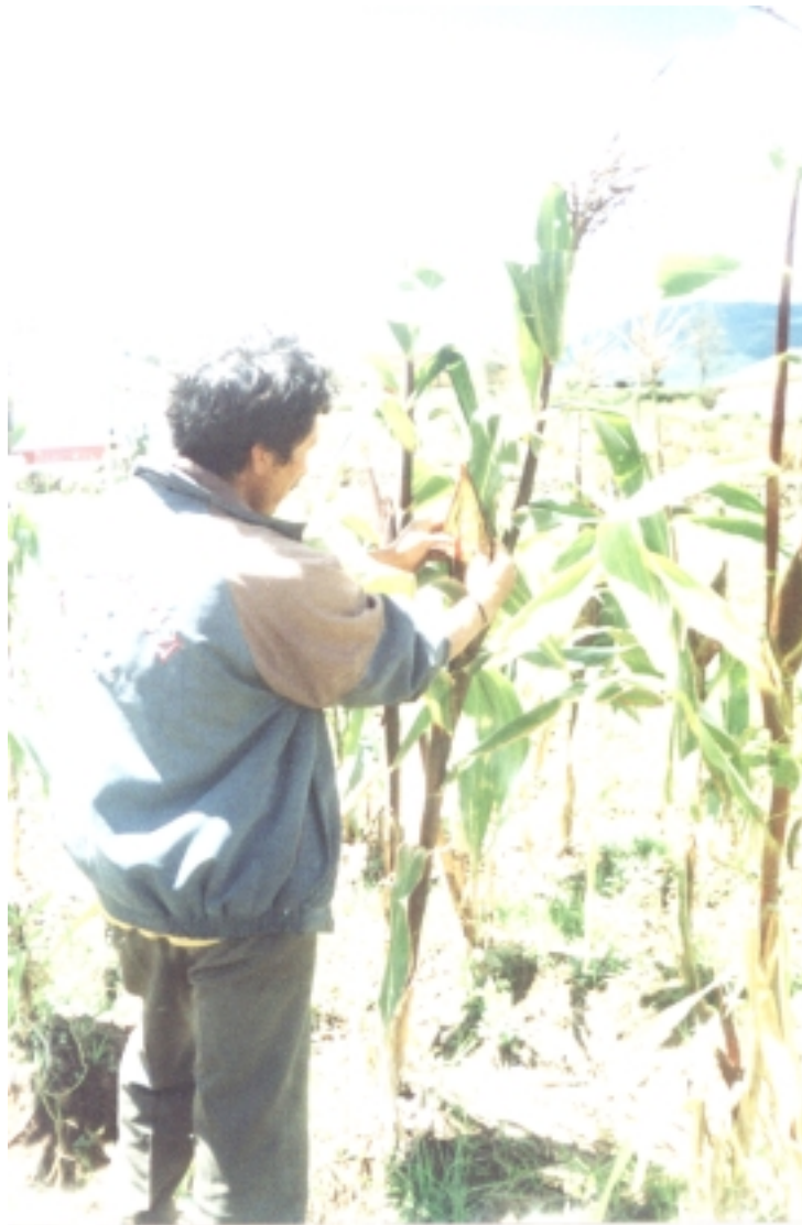
Figura 13. Recolectando pelo de choclo.

El tema del maíz en la medicina tradicional, se torna interesante, puesto que por medio del mismo, podemos comprender la riqueza cultural que nos rodea.