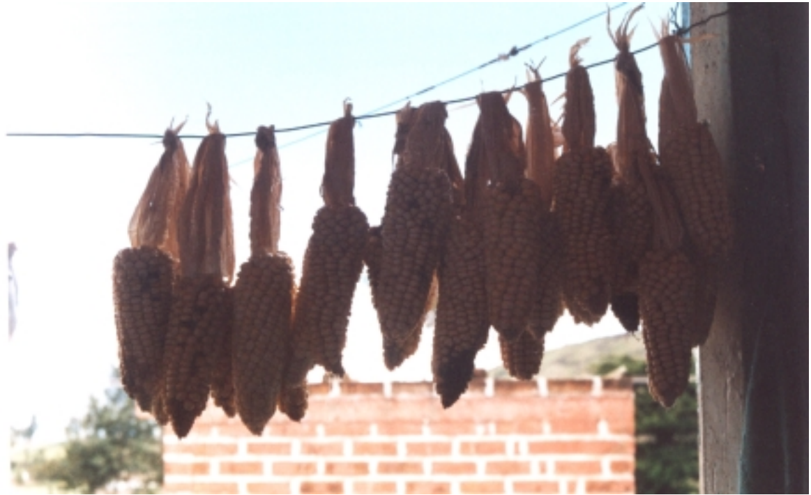
Figura 20. Guayungas de maíz.