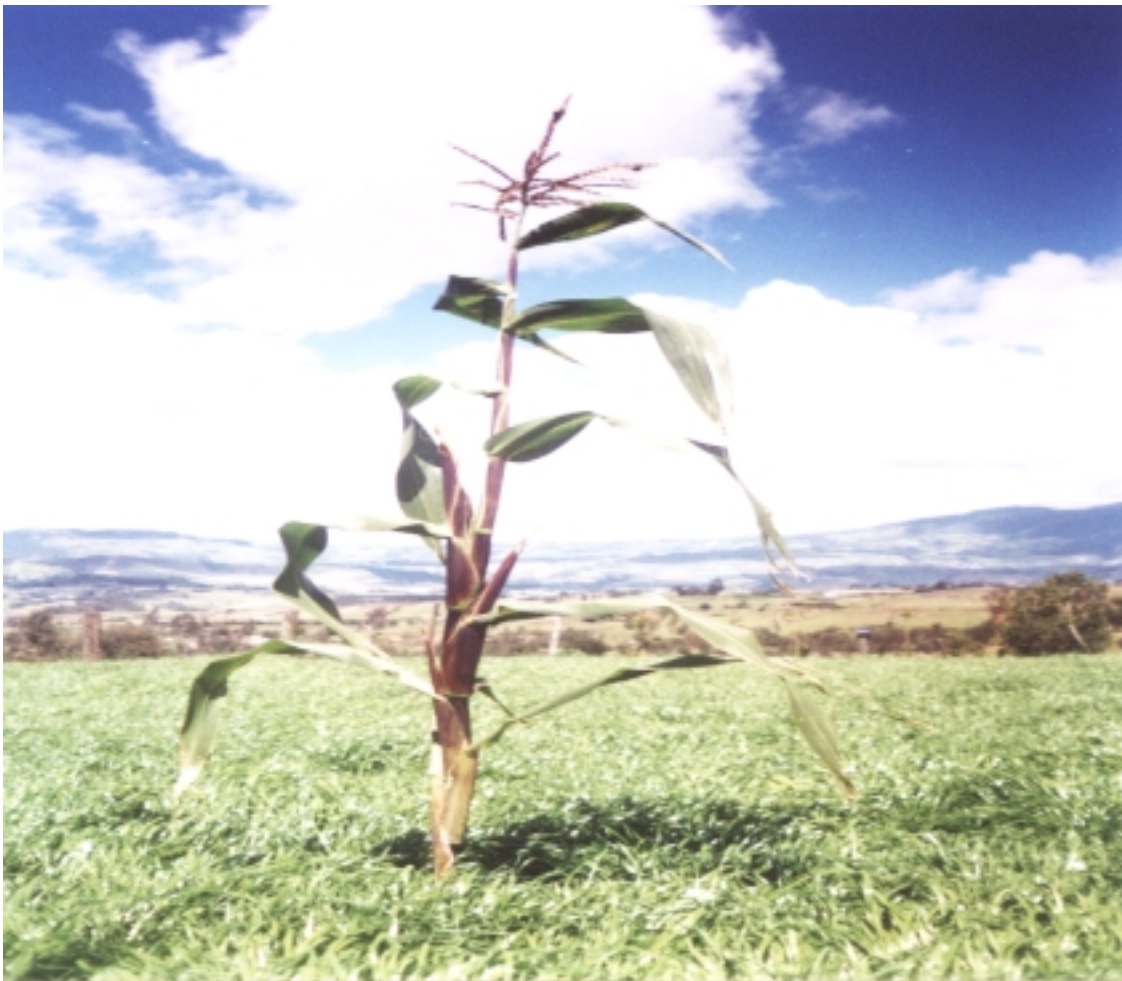
Planta de maíz.

La agricultura se ha constituido como factor fundamental en la historia de la civilización humana desde sus inicios. Esta actividad hace que el hombre se instaure en un lugar específico, permitiéndole desplegar su cultura en todas sus manifestaciones.