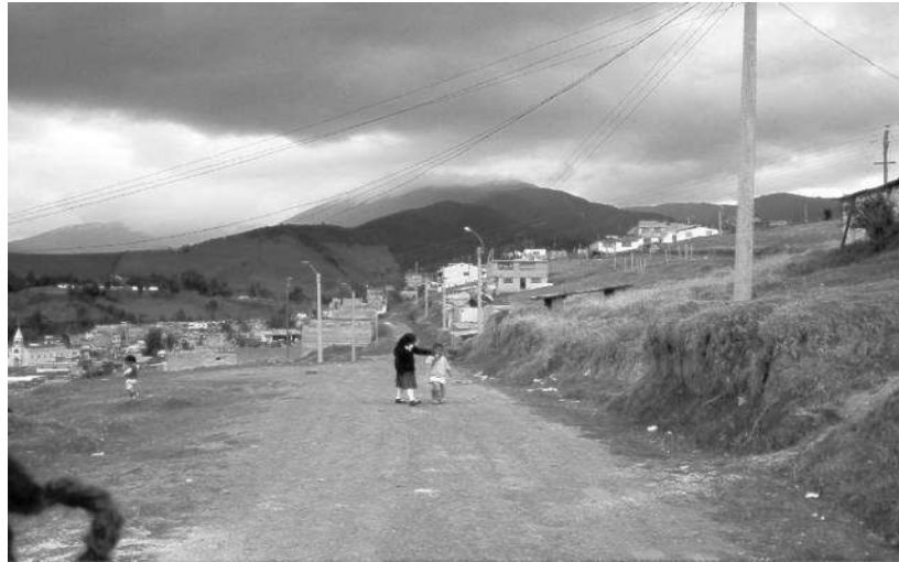
Calles despavimentadas y lotes que por falta de dinero no pueden edificarse.

Por medio del taller realizado con los futuros dirigentes, donde se aplicó la técnica cualitativa “Árbol de Problemas”, fueron ellos mismos quienes identificaron las causas y efectos de la “crisis de la participación comunitaria” (problema central), que hasta la fecha, se observaba, y quienes identificaron las posibles actividades a planificar, con el fin de participar, a mediano plazo, en el cabildo municipal presentando un buen proyecto.