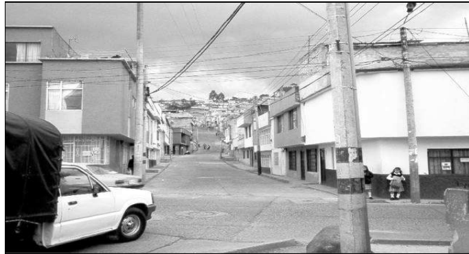
FOTO No. 2 Calle Principal Barrio Santa Fe I