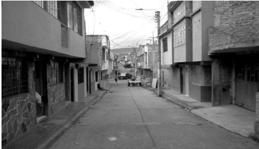
Calles y viviendas del barrio Santa Fe I

Aunque en esa convocatoria se tienen en cuenta las cualidades básicas de la organización comunitaria: intereses comunes, decisión libre y voluntaria, toma de decisiones por mayoría, soluciones con máximo de cobertura, desde la perspectiva integral de desarrollo, se dejan a un lado aspectos verdaderamente importantes como: planificación conjunta de todas las acciones, la solidaridad, cooperación y responsabilidad compartida, la capacidad de crear, coordinar y sistematizar los talentos y recursos de los grupos que pueden ser dirigidos hacia la realización de los ideales de la comunidad y hacia el desarrollo de las potencialidades de sus miembros logrando procesos de desarrollo social, económico y cultural.