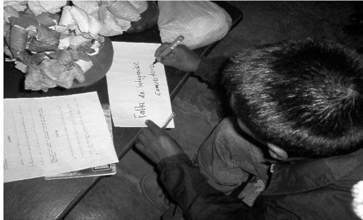
Líder del barrio 7 de Agosto identificando como problema la falta de integración comunitaria