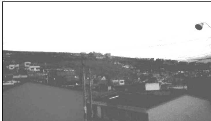
FOTO No. 3 Barrio Siete de Agosto