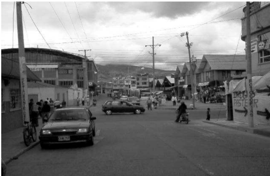
FOTO No. 13 Principal eje de desarrollo Económico Barrio Tejar

Es un proceso para tratar de mejorar el nivel de vida de la comunidad, creando espacios y dando oportunidades, para proyectar el pensamiento y las actividades que tienen que ver con el bienestar conjunto: socioeconómico, físico, ecológico, ambiental, cultural y, lo mas importante, la mente humana, que representa, la concientización de la gente.