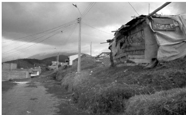
Pobreza, hacinamiento y Autoconstrucción