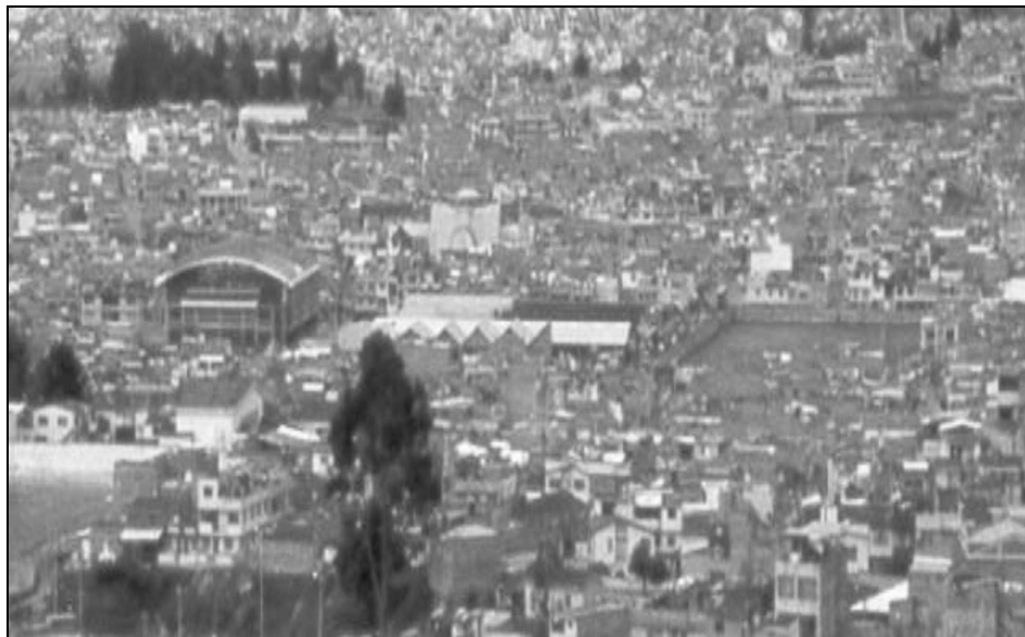
Panorámica donde sobresale el Coliseo sur-orientales, el mercado Tejar, el Estadio y la Iglesia El Carmen