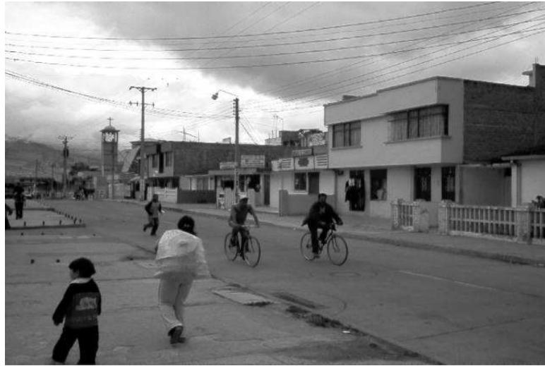
FOTO No. 5 Comercio Barrio Tejar

La primera conquista, se traduce así, en tener acceso a una vivienda donde la familia pueda realizarse y resguardarse, y conforme vaya pasando el tiempo y conforme cada uno de los integrantes del hogar, se desenvuelva en los diferentes espacios, se van identificando nuevas necesidades. Este es el caso de las luchas del barrio el Tejar, que a diferencia de los otros barrios, tuvo una vinculación más decidida y beligerante en su trayectoria, logrando un reconocimiento político y cultural, de gran nivel, en todo el departamento de Nariño.