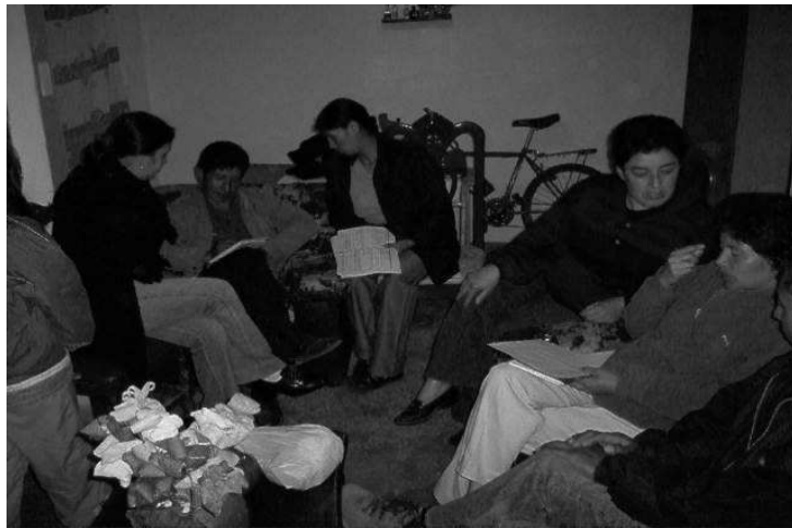
FOTO No. 10 Identificando causas y efectos

Las grandes transformaciones, en la mayoría de los procesos sociales, se originan cuando, los actores involucrados, identifican el sentimiento de injusticia en algún factor de su vida cotidiana. Aunque la movilización popular, en torno al sentimiento de injusticia, hace parte ya de la tradición histórica de los barrios. Ya sea porque en la actualidad, ese paso se ha visto obstaculizado por ciertas barreras y desventajas que ocasionan los efectos de la globalización neoliberal, como se especifica en capítulos anteriores; estos efectos (consumismo, individualismo, desterritorialización, abstracción de la realidad) corren poco a poco, la posibilidad de vivir solidariamente y de acrecentar la iniciativa de organización y de participación comunitaria.