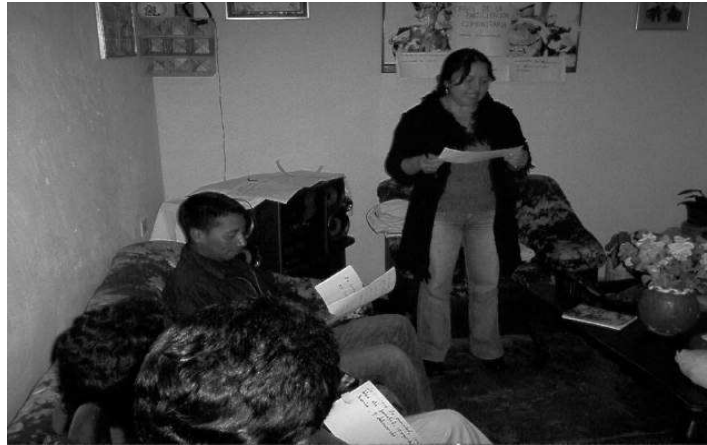
FOTO No. 8 Participación Mujer

Es posible que la influencia del hombre (jefe del hogar), se deba a patrones culturales arraigados en nuestra sociedad como el machismo, y la diferenciación sustancial con la situación de la mujer, en cuanto al nivel educativo como a la remuneración económica. Pero hay que destacar que la participación de la mujer, así sea en menor proporción, acarrea una modificación del lugar que tradicionalmente se le había asignado dentro de las relaciones de poder familiar y social. Cada vez más, la mujer adquiere mayor libertad para ejercer su capacidad de ser, tener, hacer y estar.