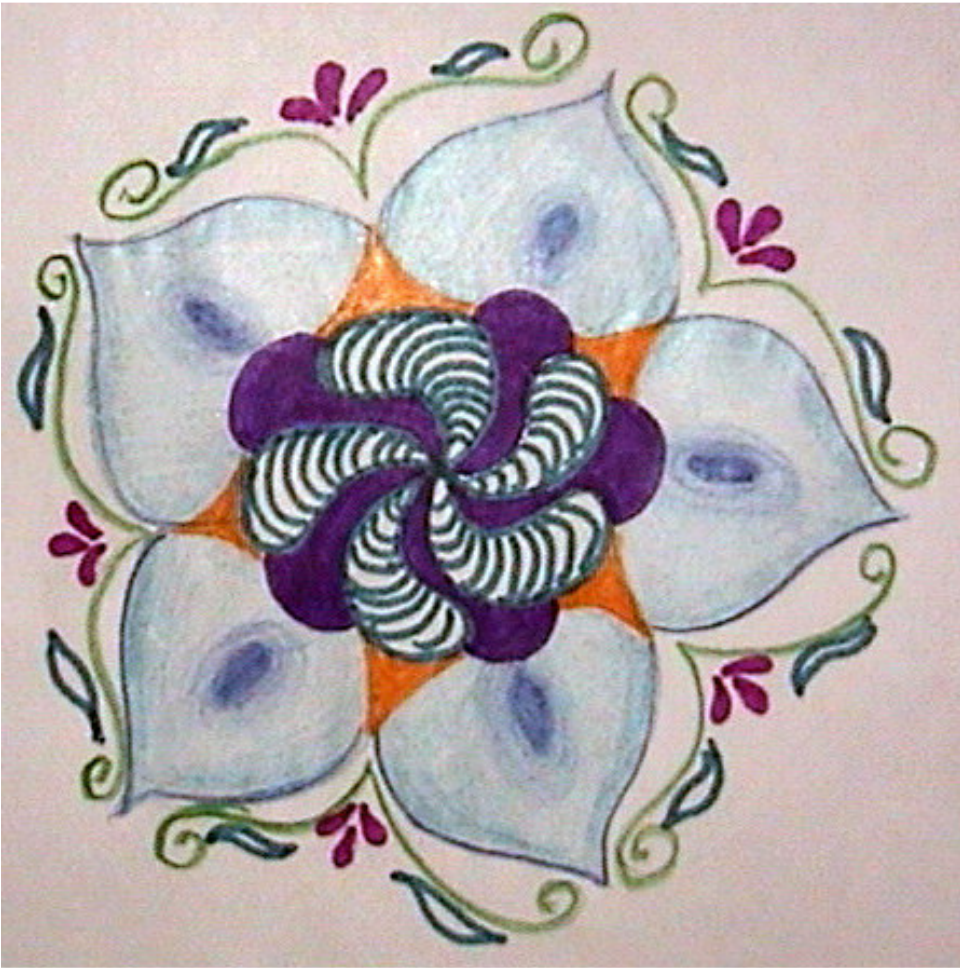
FIGURA 4: Mandala N° 32 hecho pensando en una sanción mental de las molestias causadas por la herida.