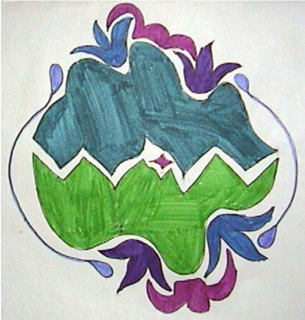
FIGURA 1: Mandala N°13, pensando en la ruptura vaginal como molestia.