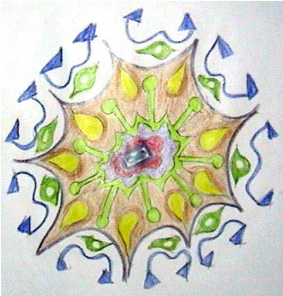
FIGURA 2: Mandala N° 23, pensando en una progresiva sanción de la sugestión que causa la herida.