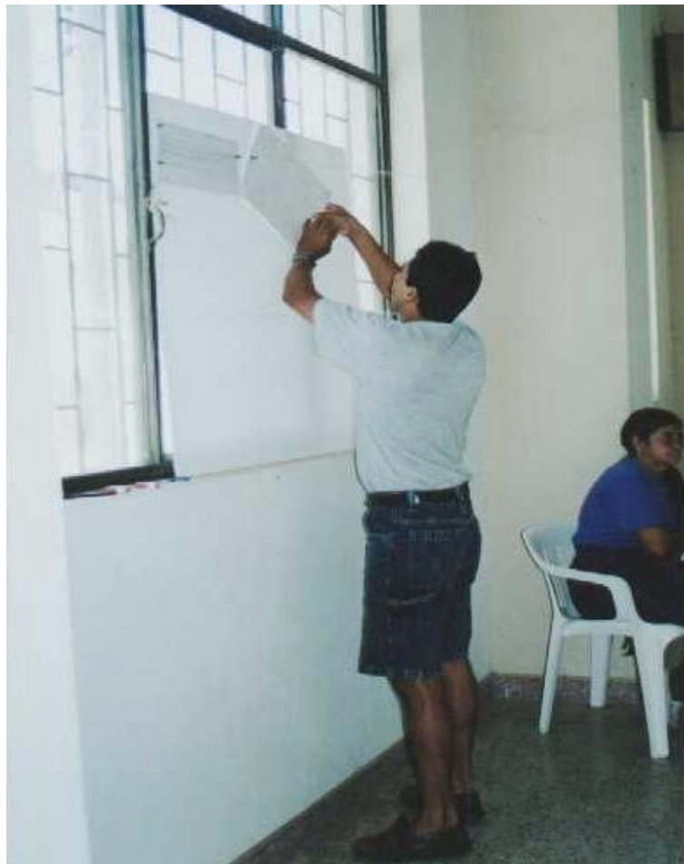
Figura 4. Formulación de Estrategias por parte de la comunidad desplazada.

La comunidad desplazada conciente de la problemática en la que viven, afirmó que la atención institucional recibida ha sido insuficiente, argumentando que la atención prestada no ha contribuido a mejorar la calidad de vida. A través de un taller con la comunidad desplazada formuló unas estrategias , para lograr mejorar sus condiciones de vida.