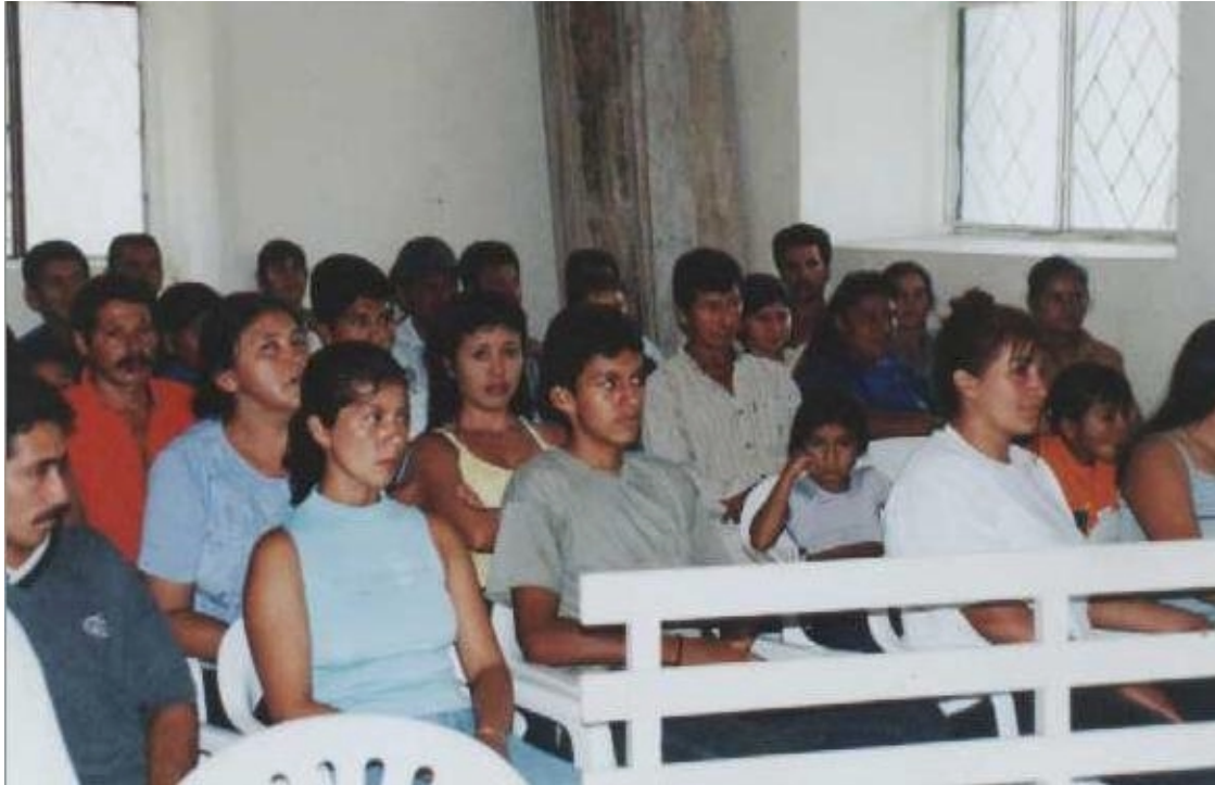
Figura 3. Comunidad desplazada presente en la realización de talleres.

Como primera instancia se indagó el grado de conocimiento que posee la población desplazada sobre disposiciones legales, políticas y programas en materia de atención y protección al desplazado, para cumplir con este objetivo se realizó un taller denominado: ¿Qué tanto conocemos sobre disposiciones legales, instituciones, programas, políticas, responsabilidades en materia de desplazamiento?. En segundo lugar para la evaluación institucional se indagó con la comunidad desplazada de Linares, qué instituciones les han brindado atención y protección. Para cumplir con este objetivo se realizó un taller denominado: ¿En qué hemos recibido ayuda y cómo ha sido la ayuda recibida?,