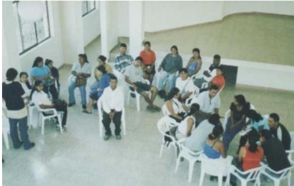
Figura 2. Interacción con la comunidad desplazada.