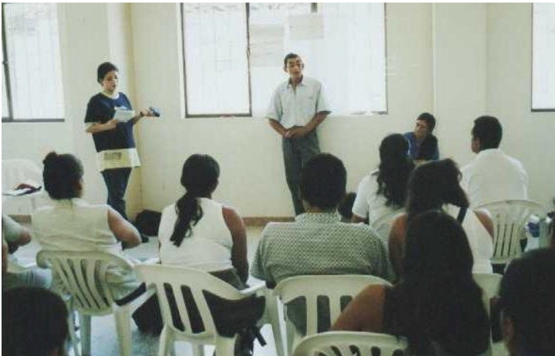
Figura 5. Líder desplazado planteando estrategia para la mejor atención al desplazado.