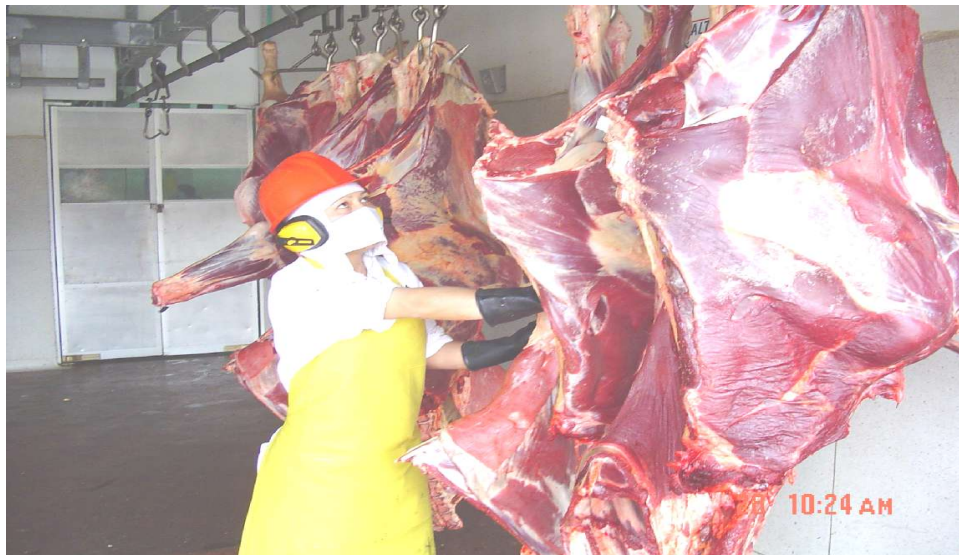
Frigovito Jongovito S.A.

El Tratamiento de la carne en Frigovito es realizado por personal especializado, como se puede observar en la siguiente fotografía.