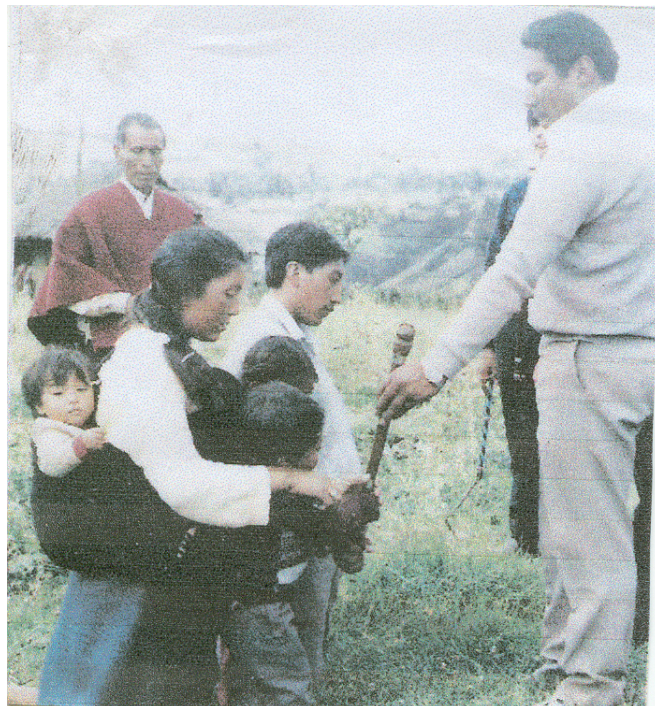
Figura 6. Ritual de la posesión de tierra

La tenencia de tierra no es solamente un tecnicismo legal relacionado con la propiedad, es "un sistema de relaciones jurídico - políticas de dominio sobre la tierra, que adoptan diversas formas históricas. Unas fundamentales en las propiedad (de carácter estatal,