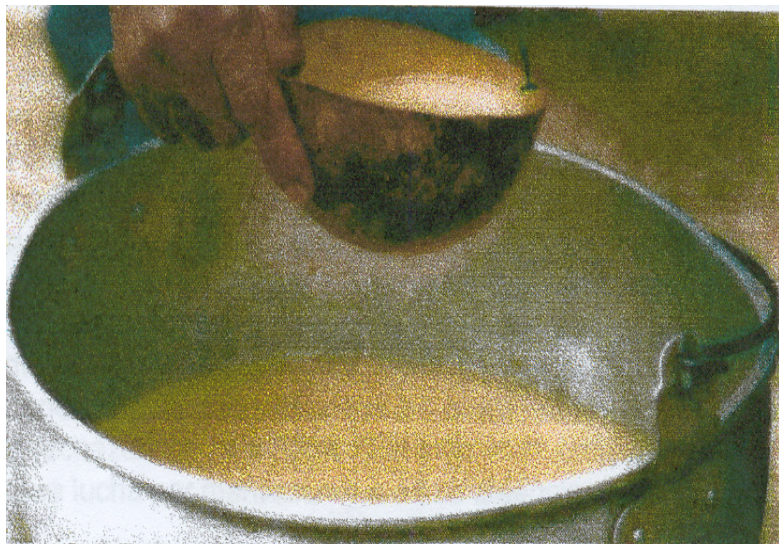
Cuadro 23. Participación.