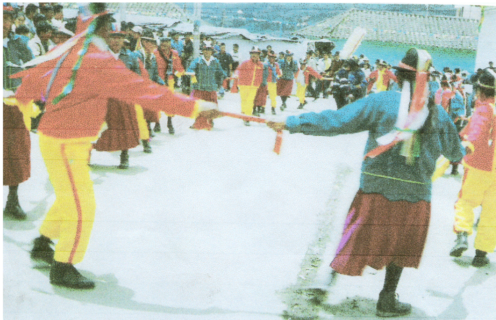
Figura 5. Danza en Males

Las danzas en este territorio cumplen un papel importante en el mundo tradicional, donde las creencias de sus habitantes, junto con la religión católica guardan un profundo vínculo ya que forma parte del universo espiritual y cultural de los pastos; por eso los danzantes y sanjuaneros manifiestan sus costumbres con los auténticos bailes donde participan hombres con vestimenta de mujeres con colores vivos y utilizan sonoros cascabeles que suenan estrepitosamente, la música corresponde a una melodía particular que se realiza en honor a San Bartolomé. La danza no es solamente parte directa de la ceremonia, el culto, es también la expresión colectiva de lo imaginario en el pensamiento mágico religioso. Para el indígena es un rito religioso trascendental incorporado a su propia vida, es una ceremonia mágica, telúrica, cósmica. En esta ceremonia, la música, el danzante, los movimientos y el desplazamiento están en común unión con la naturaleza.