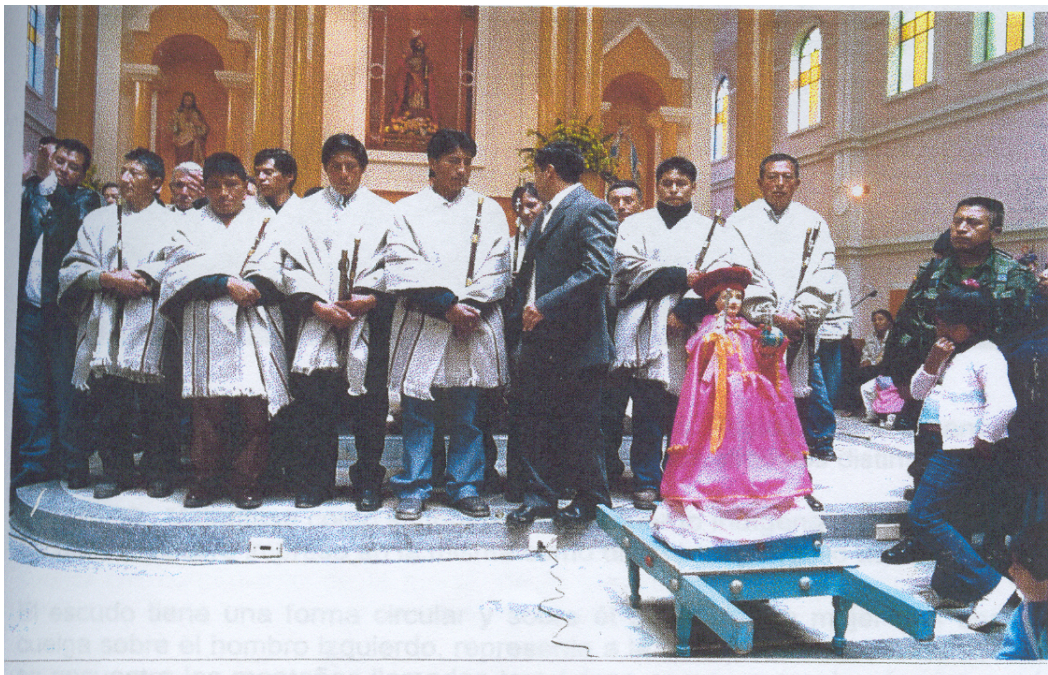
Figura 1. Posesión del Gobernador del Cabildo de Males

Las varas de la justicia son seis y tienen longitudes diferentes así: de 64 centímetros para el uso exclusivo del señor Gobernador y de 60 centímetros para los alcaldes y regidores; sin embargo todas coinciden porque tienen cuatro anillos de tres centímetros de longitud y finaliza en una punta o pie que tiene el mismo material de los anillos con significados precisos de sus partes.