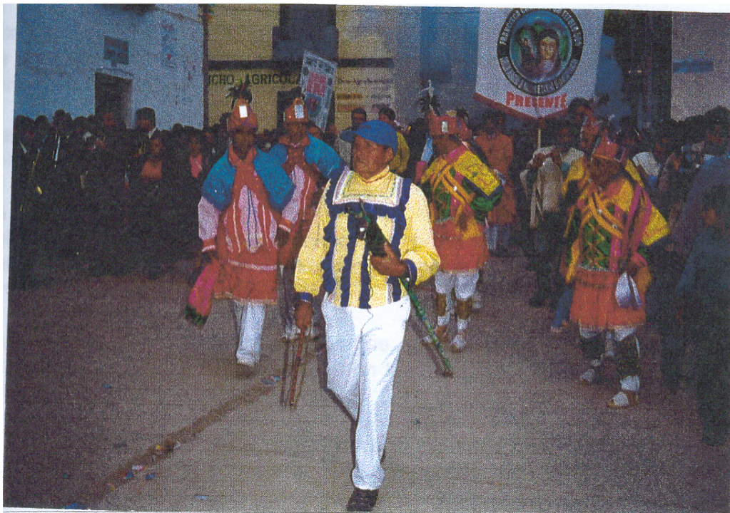
Figura 2. Escudo del Cabildo de Males

La tribu indígena de Males, descendientes de los Pastos, debe organizarse legal y constitucionalmente como resguardo, y debe tener los símbolos distintivos.