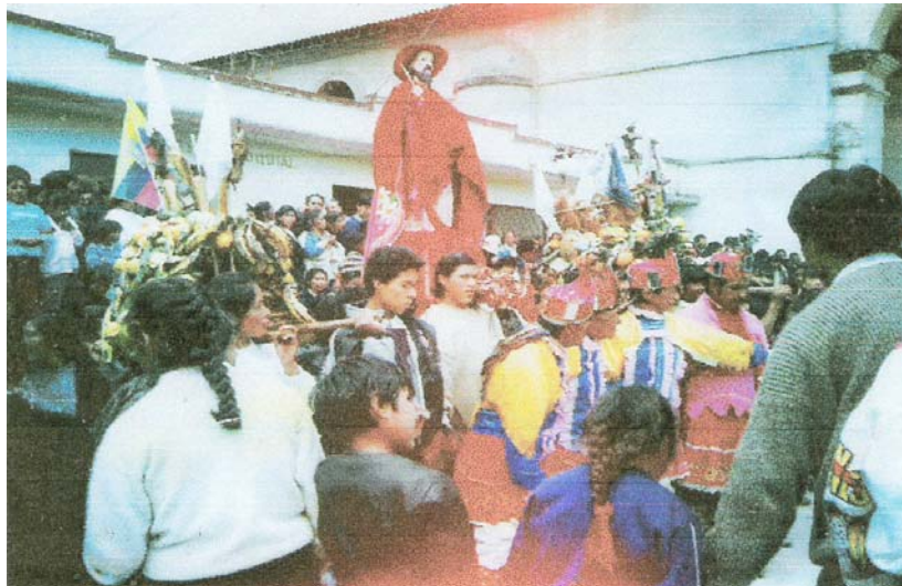
Figura 9. Fiestas patronales de San Bartolomé

De igual modo se celebran festivales bailables en pro de la institución educativa, aquí la gente se prepara con anticipación para poder disfrutar de estas actividades, en la parte municipal están las celebraciones de fin de año donde la comunidad campesina e indígena recibe a su futuro gobernador para que los guíe todo el año también las fiestas