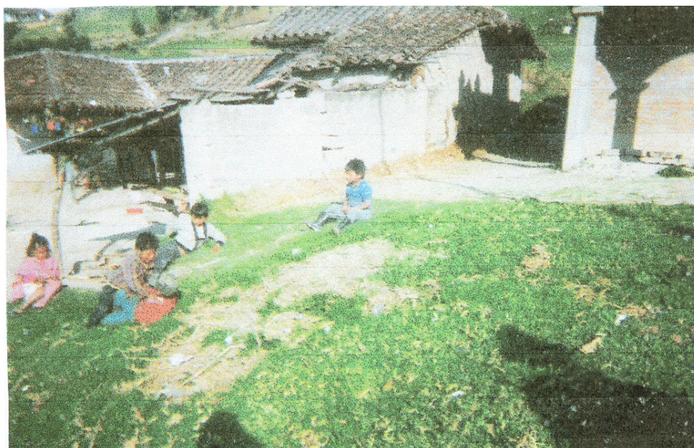
Figura 8. La vivienda en Santa Brigida Tequí

Piso: en la mayoría de las viviendas es común encontrar los pisos en tierra apisonada porque no disponen de ningún otro material que no sea éste.