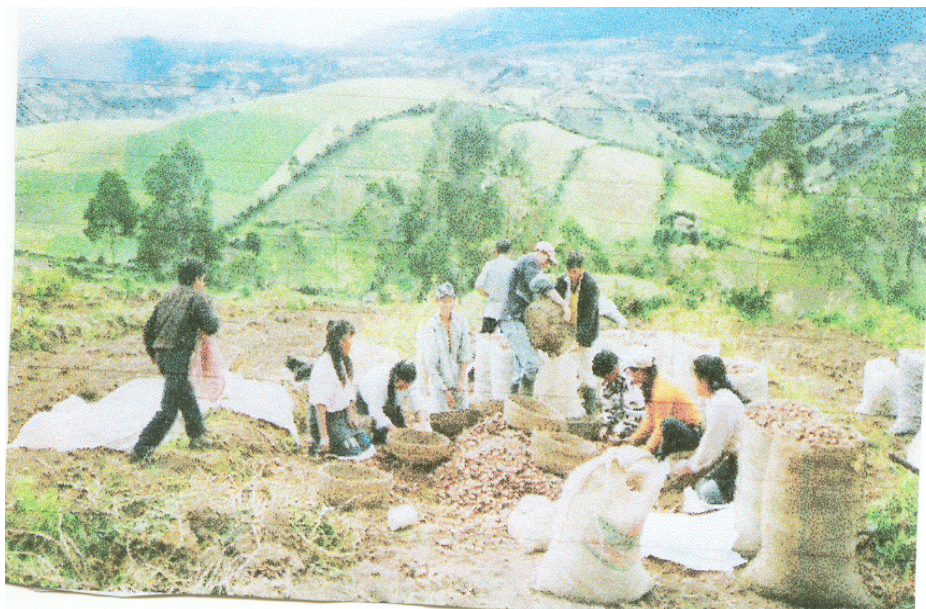
Figura 7. La agricultura

Tequíz limita al norte con las veredas del Páramo y la Laguna en el Municipio de Puerres separadas por el Río Tescual por medio, al oriente con la vereda de Santa Brígida y La Florida, caminos de herradura por medio y por el occidente con la Vereda El Salado, Quebrada de Tequíz por medio.