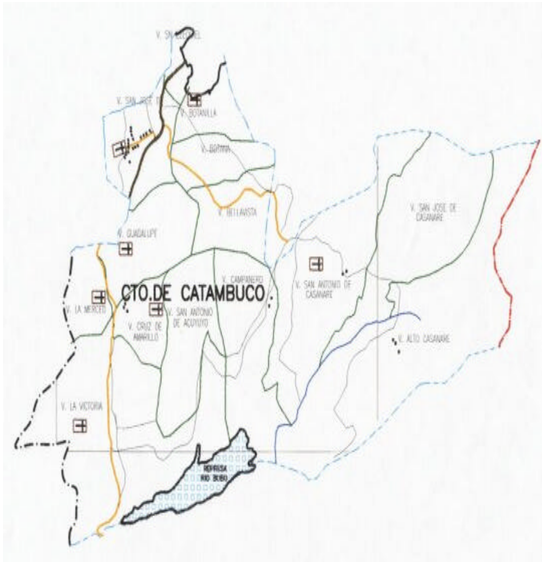
Figura 1. Mapa de la zona.