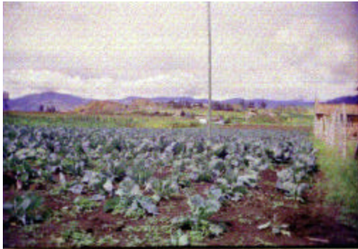
Figura 3. Cultivo de repollo