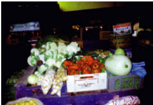
Figura 6. Plaza de mercado Los dos puentes