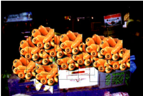
Figura 9. Venta de zanahoria plaza de mercado

En la vereda de Botanilla del Corregimiento de Catambuco el producto más representativo es la zanahoria. Aproximadamente cosechan 30 bultos. Los comercializadores compran los lotes de zanahoria, luego los cosechan y realizan un tratamiento postcosecha que consiste en: lavar, seleccionar, clasificar y empacar. Ello sin importar las condiciones climáticas.