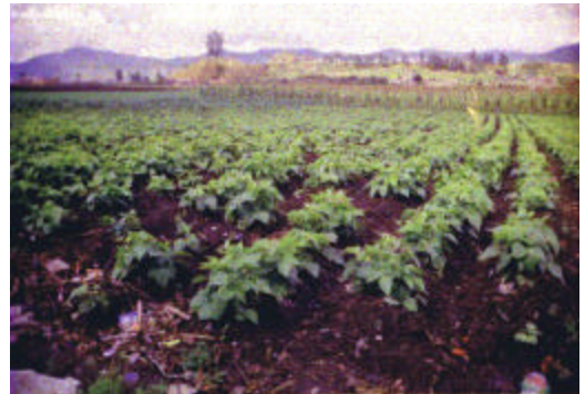
Figura 4. Cultivo de frijol