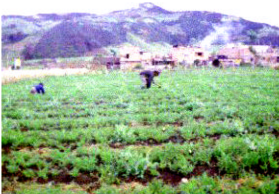
Figura 8. Cosecha cultivo de zanahoria

La producción de hortalizas y demás productos de procedencia agrícola es de tipo familiar, el campesino produce parte para el autoconsumo y otro tanto para la venta. Se presenta generalmente en predios menores a 5 hectáreas