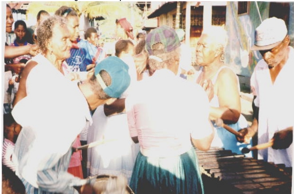
Fotografía No. 3 Expresión Cultural en Francisco Pizarro