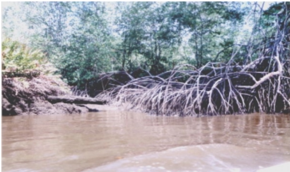
fotografía No. 4 Riqueza de los Recursos Naturales

Tiene en cuenta la preservación, recuperación y aprovechamiento sostenible del ambiente como proveedor de bienes y servicios indispensables en la vida, educación y cultura para la preservación del ambiente.