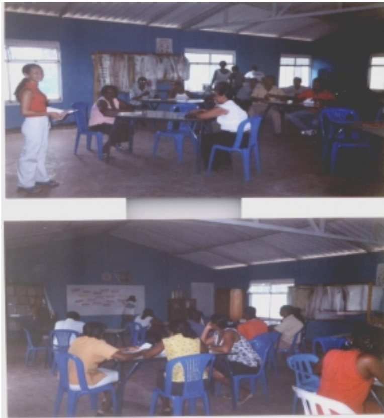
Fotografía 5 y 6 Realización taller Participativo en Salahonda