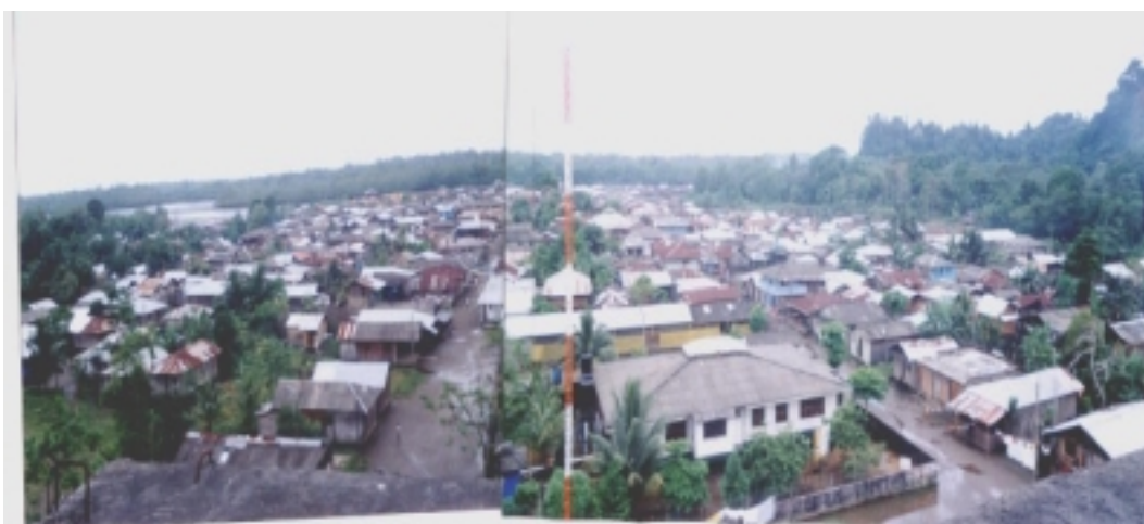
Fotografía No.1 Vista parcial de Salahonda

El Municipio de Francisco Pizarro hace parte del denominado pacífico biogeográfico. Se sitúa entre las fronteras con Panamá por el norte, y con el Ecuador por el sur, en una longitud aproximada 1.300 kilómetros, correspondiente a la costa sobre el Océano Pacífico al occidente. Sobre el mar Caribe posee también costa en una longitud de 350 kilómetros, con sus correspondientes áreas marinas. Por el oriente tiene como límite la cresta de la cordillera occidental e incluye las serranías del Baudó y Darién, la cuenca del Río Atrato y San Juan y finalmente la zona del alto Sinu y San Jorge, por sus similitudes biofísica. El área encierra entonces alrededor de 113.000 kilómetros cuadrados correspondientes al 10% del territorio nacional.