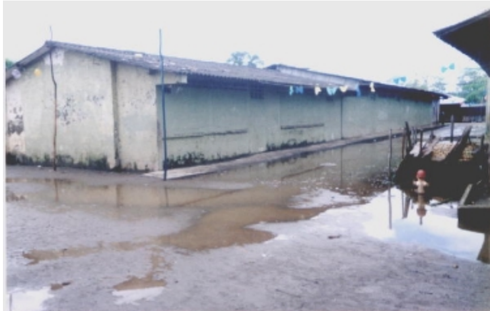
Fotografía No. 2 Escuela Urbana Mixta Salahonda

La educación en el municipio de Francisco Pizarro es deficiente. El deterioro de la infraestructura física de los establecimientos educativos, la dotación didáctica desactualizada, las unidades sanitarias en mal estado y en general la falta de equipamiento generan la baja calidad educativa en el municipio. Se presenta hacinamiento, por ello gran número de estudiantes quedan por fuera del servicio educativo.