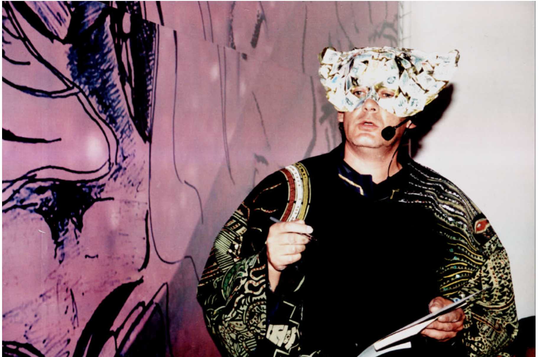
Figura 8. Sustentación real de la obra – memoria íntima afectiva y percepción infinitas