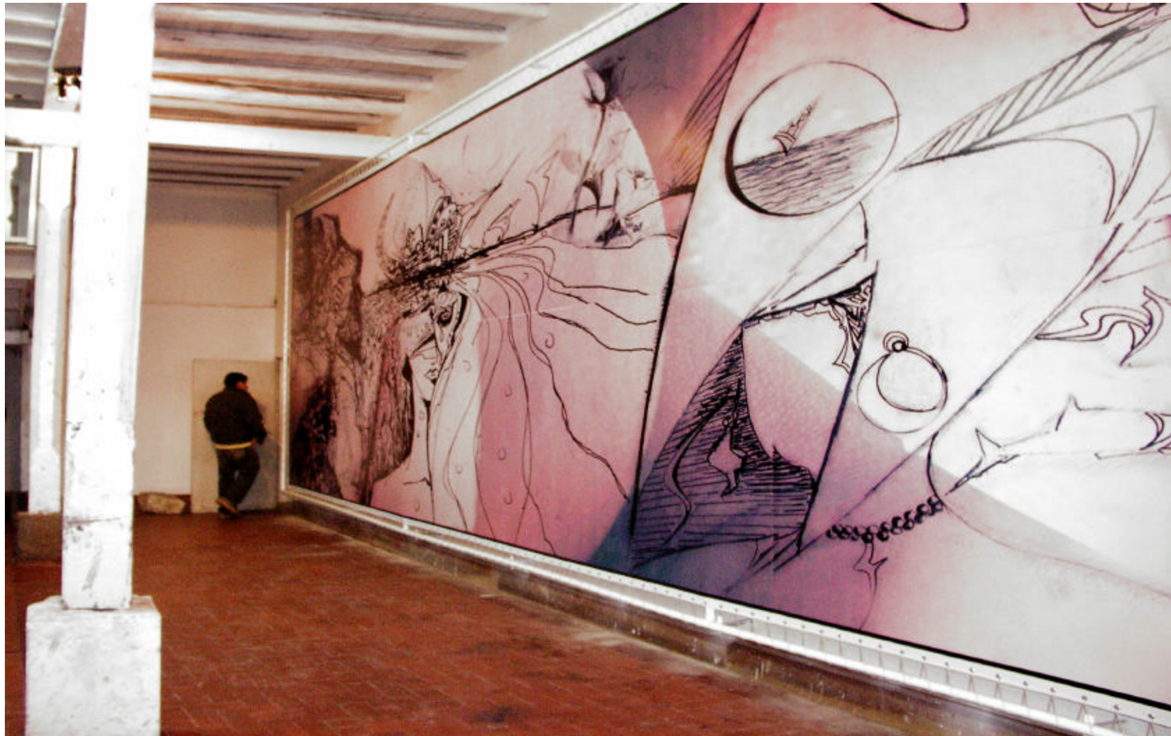
Figura 12. Montaje e instalación real de la obra – memoria íntima afectiva y percepción infinitas