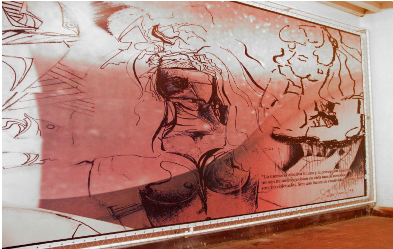
Figura 7. Montaje e instalación real de la obra – memoria íntima afectiva y percepción infinitas