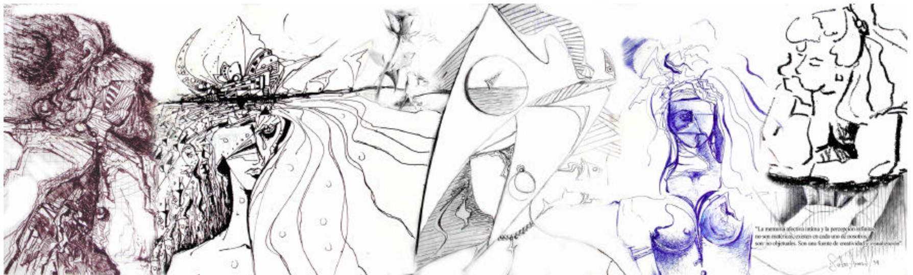
Figura 4. Grafica real de la obra – memoria intima afectiva y percepción infinitas - dibujo