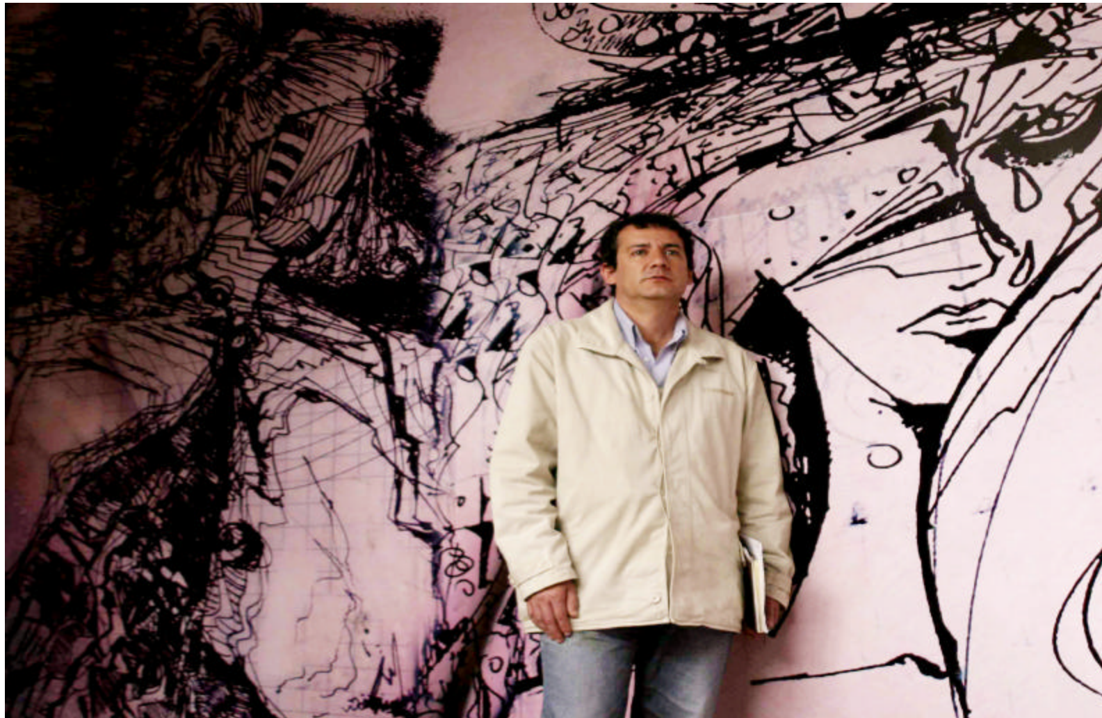
Figura 6. Montaje e instalación real de la obra – memoria íntima afectiva y percepción infinitas (palatino de la facultad de artes visuales universidad de Nariño-centro)