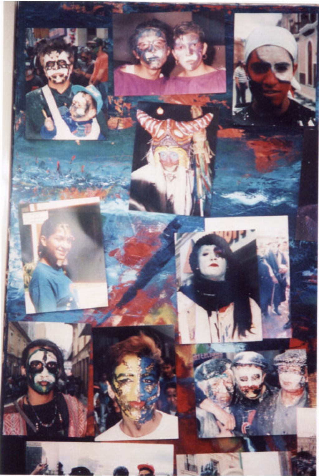
Figura 9. Aproximación gráfica – carnavales de blancos y negros San Juan de Pasto (Nariño)