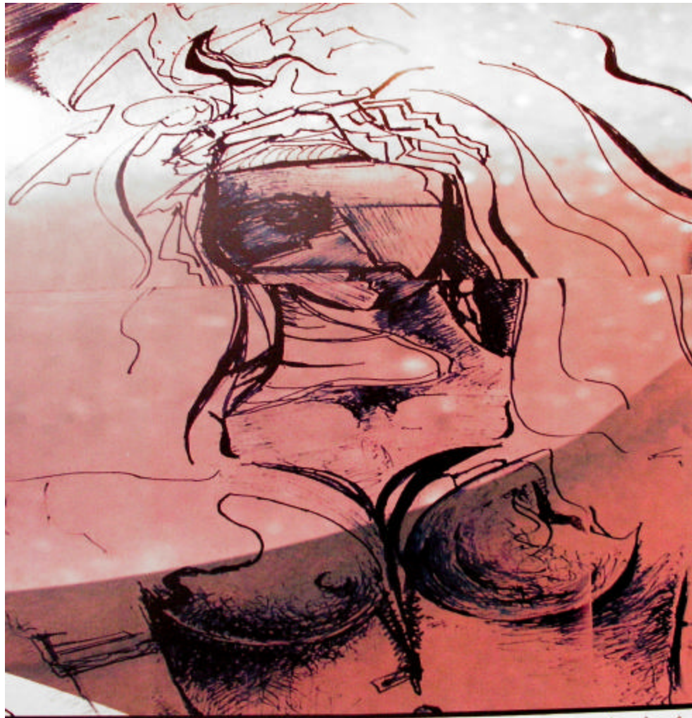
Figura 11. El montaje e instalación real de la obra – memoria intima afectiva y percepción infinitas