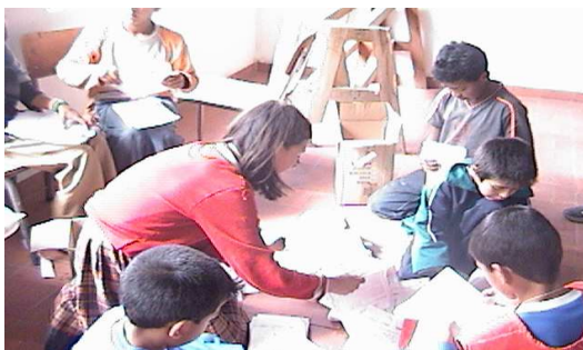
Fotografía 6. Seleccionando papel

En aspectos socioafectivos, se perciben conductas de excesiva emotividad en algunas personas y una actitud demasiado introvertida en otras, sin embargo se concluye que al aplicar la pedagogía centrada en el estudiante y la lógica cooperante, los niños y niñas de este grupo conciben el valor de trabajar en equipo y de respetar a los demás, proceso afectivo que puede verse incrementado en el transcurso de los talleres.