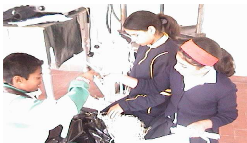
Fotografía 5. Reciclando papel

La evaluación, se efectúa de manera cualitativa a cada uno de los estudiantes y se basa en la propia observación y descripción del grupo hacia cada uno de sus compañeros, luego se realizan una serie de preguntas sobre el taller, con el fin de analizar que percibió el niño durante este proceso, como por ejemplo; ¿Por qué cree que es importante reciclar papel?, ¿cree usted que si realiza esta actividad de manera frecuente, esta contribuyendo a la protección del medio ambiente?; se puede analizar que los estudiantes, están abiertos al proceso y a su dinámica, se observa la necesidad de realizar actividades nuevas, dinámicas y practicas, dentro de la vida escolar o institucional, que los motiven a generar su propio trabajo y que a partir de este puedan llegar a una autorreflexión. Este taller es una buena opción de educación didáctica en cuanto al tema del reciclaje, ya que de esta manera los niños perciben directamente que el papel que se había desechado, sirve nuevamente y puede ser reutilizado.