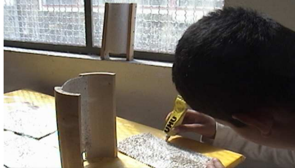
Fotografía 13. Elaborando lámparas artesanales