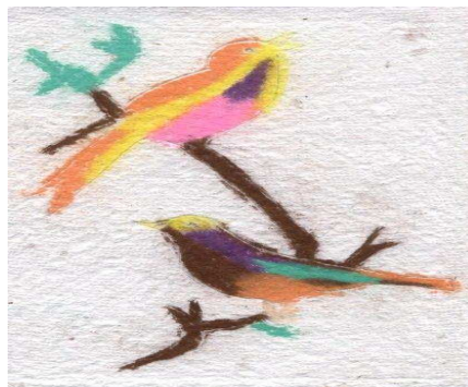
Fotografía 15. Pájaros, trabajo de oralidad y plástica

Se puede concluir que el arte y la metodología humanista de empatía, respeto y lógica cooperante, empleada en todos los talleres ha favorecido enormemente el proceso cognitivo y afectivo de niños y niñas.