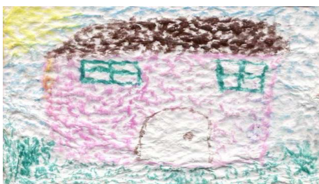
Fotografía 2. La casa, prueba de dibujo libre