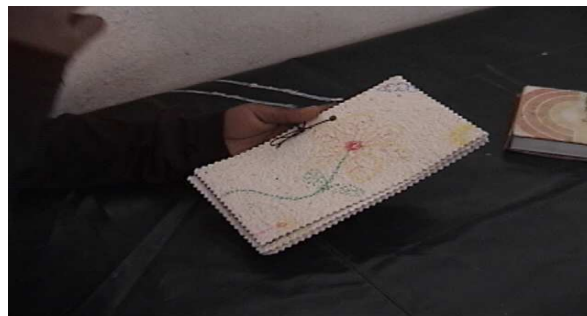
Fotografía 11. Elaborando cuadernillos artesanales

A nivel general se puede concluir que el taller le permite al niño conocer la elaboración de un material útil y cotidiano como es el cuaderno, que puede además de generarle una posibilidad factible de conseguir su material escolar, es una forma de encontrarse con el mismo, de encontrar su sensibilidad de reconocer su yo y de encontrarse con sus memorias.