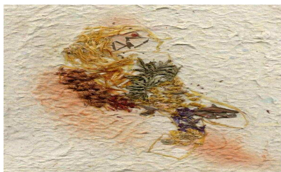
Fotografía 14. Guacamaya, trabajo de texturas con fibras vegetales

La motricidad fina se encuentra en óptimo proceso de desarrollo, al igual que la percepción y la expresión, se observa que los procesos creativos tienen un desarrollo más lento en los estudiantes, tal vez se puede concluir que la creatividad puede ser la aptitud que más conexiones y enlace de conocimientos y pensamiento requiere para su buen desarrollo.