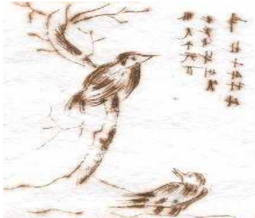
Fotografía 19. El bosque, trabajo de grabado en acrílico

En cuanto a procesos sociafectivos se percibe buenos resultados evolutivos en todos los estudiantes del grupo. Teniendo en cuenta la individualidad de cada ser, se puede concluir que el arte ha potencializando de forma progresiva el proceso cognitivo y afectivo de niños y niñas.