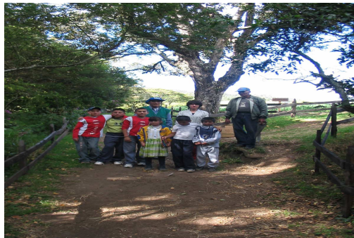
Fotografía 4. Visita ecológica al centro ambiental “Chimayoy”

Durante el recorrido los estudiante se muestran dinámicos, extrovertidos, perceptivos y muy interesados en el tema, sobre todo se observa un incremento en los niveles de socioafectividad de personas de carácter ciertamente conflictivo en el grupo.