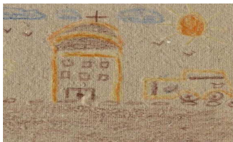
Fotografía 2. La casa, prueba de dibujo libre