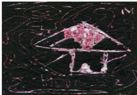
Fotografía 18. Trabajo de esgrafiado, partiendo de la musicalidad

La valoración de los estudiantes se hace mediante la observación mientras realizan su trabajo y con el resultado final del mismo. Se percibe gran control de los movimientos finos de la mano, buena percepción y asimilación del conocimiento que se ha expuesto, se observan buenos procesos perceptivos, expresivos y creativos, niños y niñas presentan facultad para realizar trabajos de expresión individual, habilidad para discriminar e interpretar sensaciones, habilidad para manifestarse de forma verbal y plástica y revelan grandes facultades afectivas durante el proceso de interrelación, como liderazgo, compañerismo, los estudiantes que presentaban carácter introvertido han adquirido facultades de integración y comunicación con sus demás compañeros de grupo.