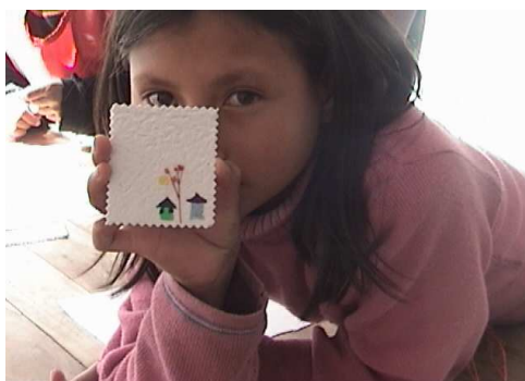
Fotografía 10. Elaborando tarjetas artesanales

En el aspecto sociafectivo, el taller deja ver una buena evolución de los estudiantes, se percibe cierta integración entre todos los miembros del grupo, no se observan formas de rechazo hacia ningún niño ni niña, a medida que transcurren los talleres se observa como la actividad artística enmarcada en procesos constructivos y humanos va generando buenos proceso sobre todo en lo que tiene ver con el desarrollo moral del niño.