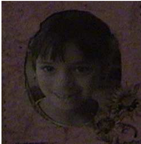
Fotografía 12. Portarretrato artesanal

Se puede concluir también que el círculo mágico, metodología tomada de la educación centrada en el estudiante, es una buena opción a trabajar para un aprendizaje significativo, crítico y reflexivo.