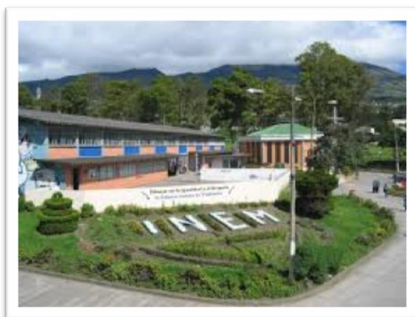
Figura 1. Institución Educativa Municipal Luis Delfín Insuasty Rodríguez

El presente trabajo de investigación se llevará a cabo en la Institución Educativa Municipal Luis Delfín Insuasty Rodríguez, institución de carácter público ubicada en la ciudad de San Juan de Pasto capital del Departamento de Nariño. Institución Educativa Municipal Luis Delfín Insuasty Rodríguez inicia sus labores en el año de 1970. A partir del