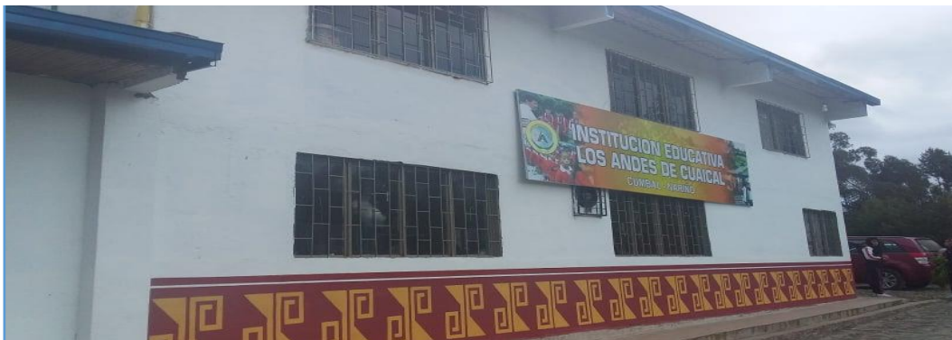
(Cumbal. 2018). Instalaciones I.E.M. Los Andes de Cuaical.

Este trabajo de investigación se realiza en La Institución Educativa Los Andes de Cuaical ubicada en la vereda Cuaical a 6 km de distancia del casco urbano de Cumbal municipio del Departamento de Nariño.