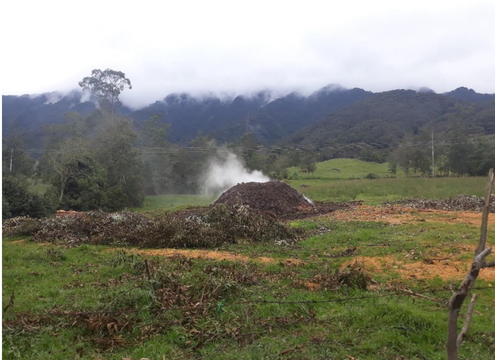
Figura 7. Carbonera en el Encano. Noviembre 2018