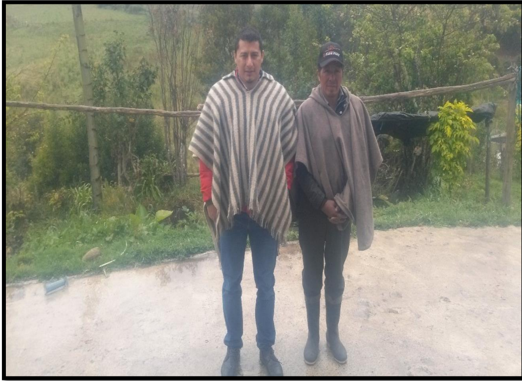
Figura 5. Carbonero del Encano. Junio 2018.

“Carbonero participando en el proyecto de investigación realizado en el corregimiento del Encano del municipio de Pasto”. (Efraín Delgado, 2018)