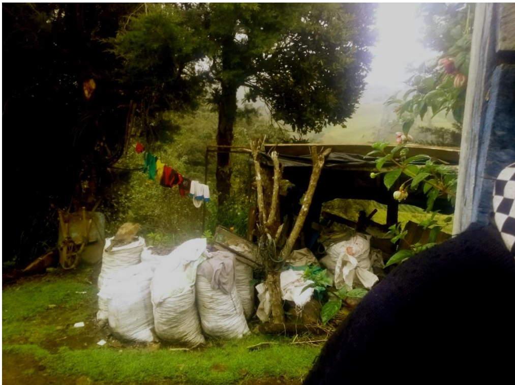
Figura 8. Carbón empacado en el Encano. Julio 2018.