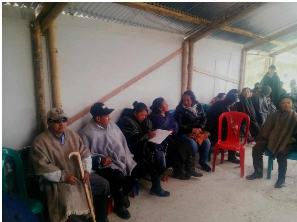
Figura 10. Reunión, carboneros del Encano. Agosto 2018.