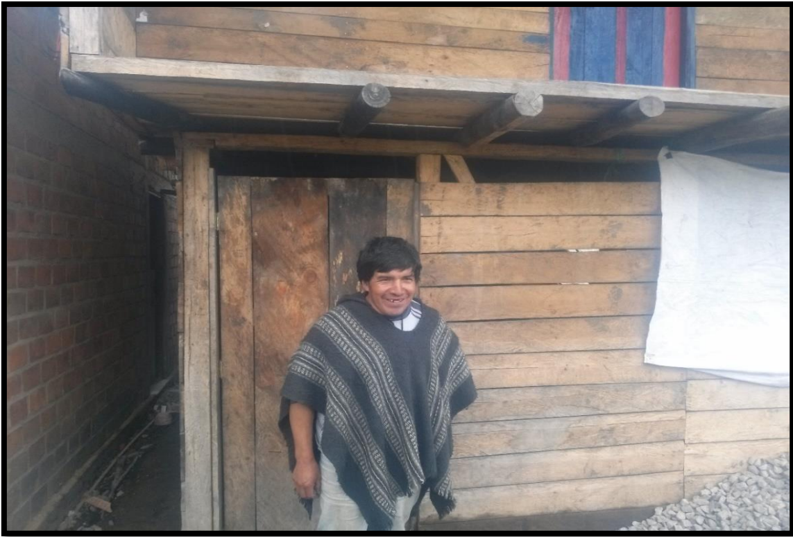
Figura 2. Carbonero del Encano. Febrero 2018. Autor: Efraín Delgado.

“Diario vivir de un carbonero, en el cual se dispone a salir en busca de árboles para armar su carbonera”.