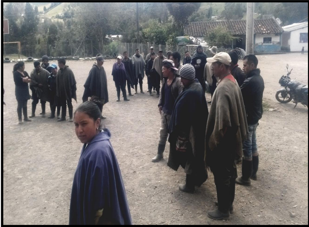
Figura 4. Familias Carboneras del Encano. Noviembre 2018. Autor: Efraín Delgado.

“Reunión de familias carboneras con el objeto de conformar la junta directiva de la asociación de carboneros del Encano”.