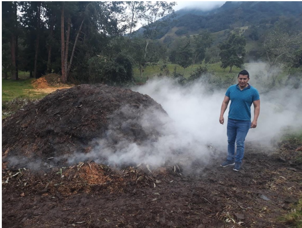
Figura 9. Carbonera en el Encano. Junio 2018. Autor: Efraín delgado.