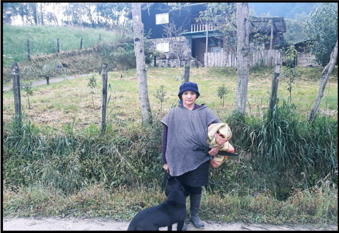
Figura 3. Carbonera del Encano. Noviembre 2018.

“Carbonera de regreso a casa después de una larga jornada de trabajo, empacando carbón”.