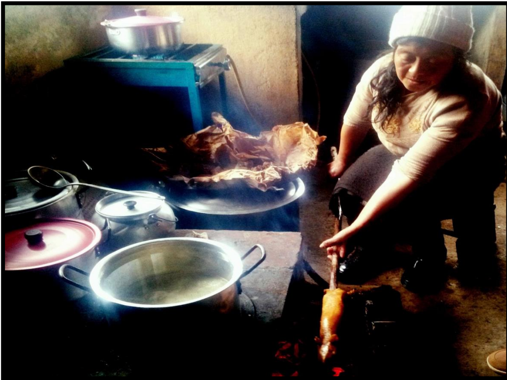
Figura 1. Carbonera del Encano. Enero 2018.

“Carbonera preparando sus alimentos, después de una larga jornada de trabajo, en la vereda Santa teresita del corregimiento del Encano”.