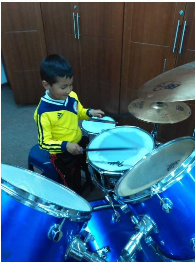
Fotografía 7. Clase de percusión.