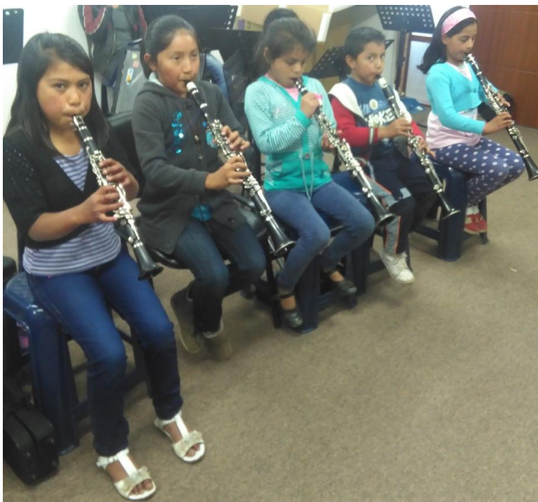
Fotografía 8. Clase de clarinete.