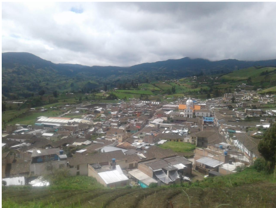
Fotografía 1. Municipio de Córdoba - Nariño.