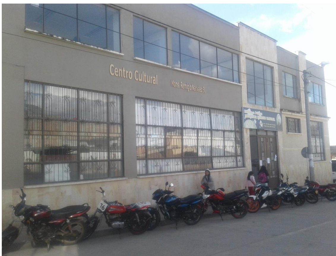
Fotografía 2. Sede Centro Cultural Monseñor Remigio Narváez Benavidez.

Para llevar a cabo un mejor despliegue cultural, el municipio dispone de un lugar que consta de una planta física en excelentes condiciones llamado Centro Cultural “Monseñor Remigio Narváez Benavidez”, donde funciona la Biblioteca pública, sala de Informática, auditorio, museo, teatro y la Escuela de Música. Para el adiestramiento y el entrenamiento físico cuenta con muchos escenarios deportivos: dos en el juego autóctono de la chaza, chazodromo de tabla y de mano, el estadio municipal, el centro de integración ciudadana (CIC), polideportivo municipal, y en general todos los centros educativos tienen su espacio recreacional.