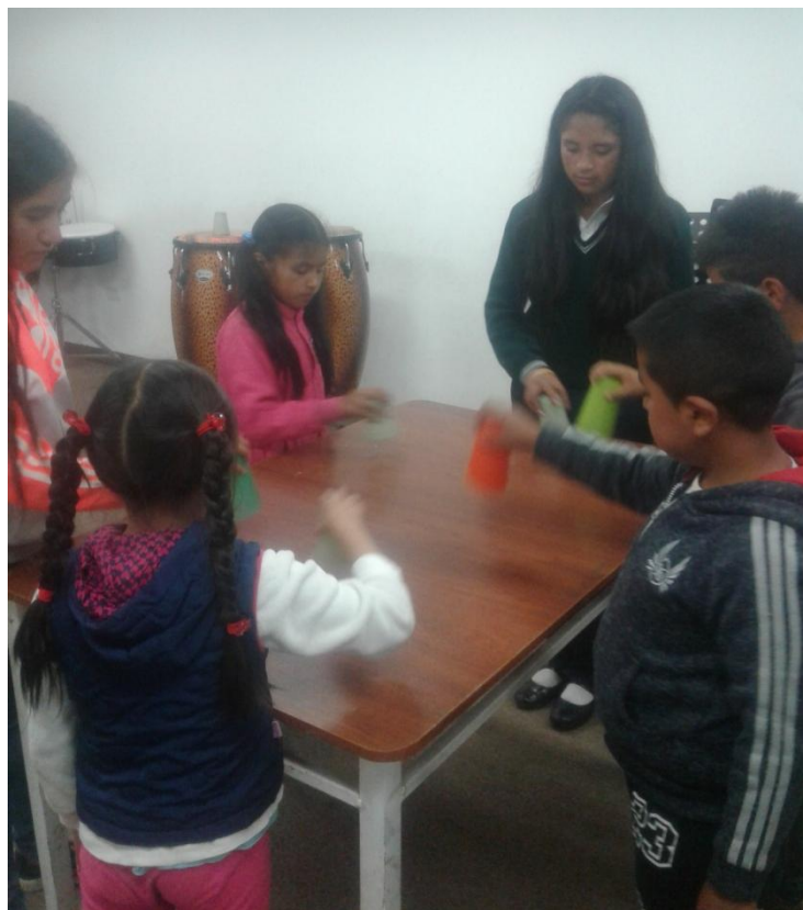
Fotografía 10. Rítmica con vasos.