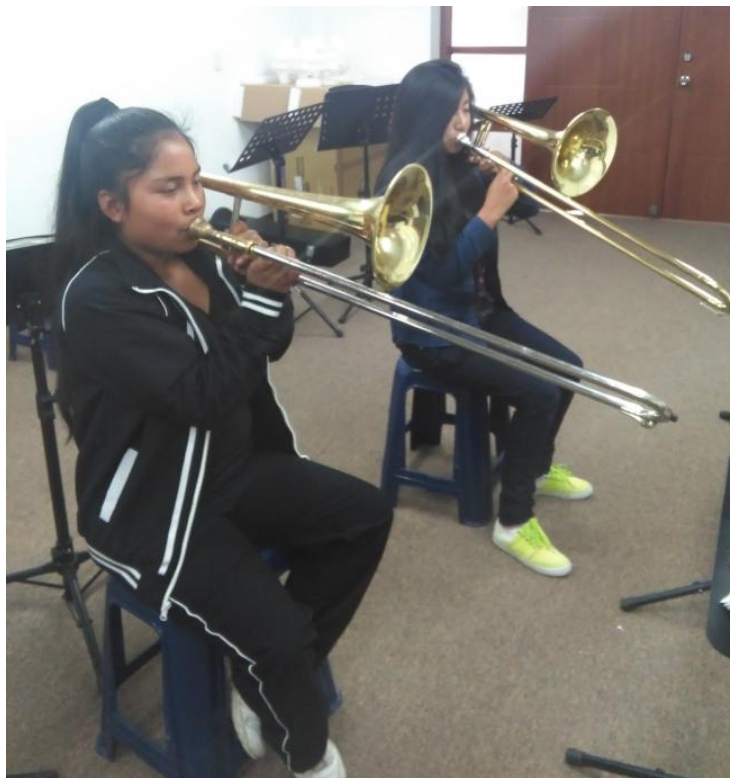
Fotografía 5. Taller de trombón.