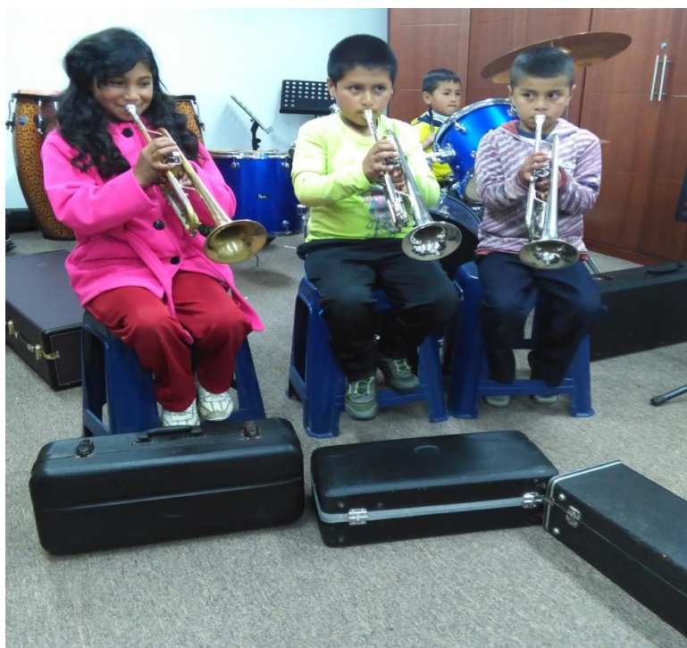
Fotografía 6. Clase de trompeta.