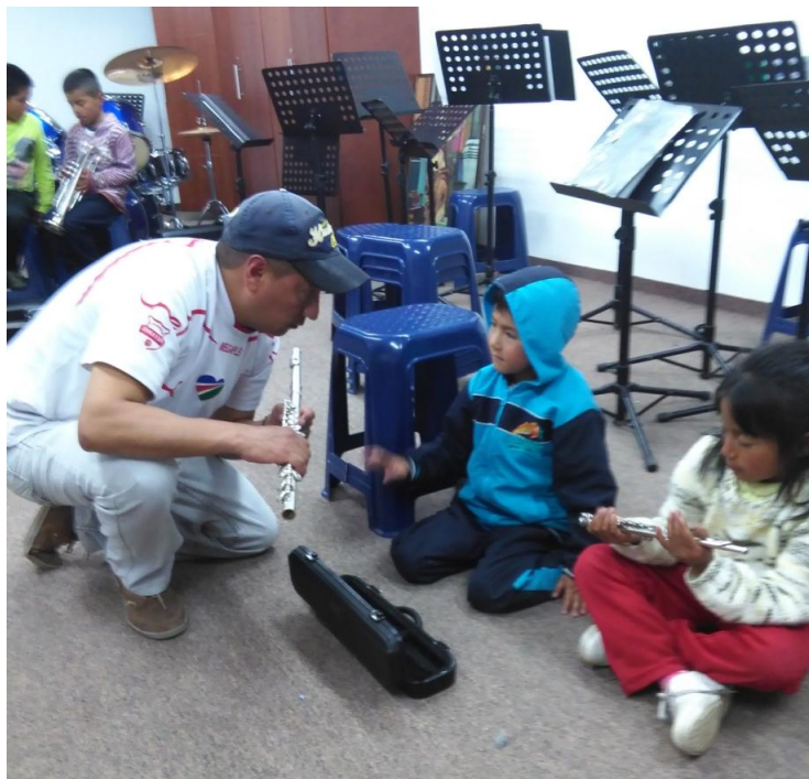
Fotografía 9. Clase de flauta.