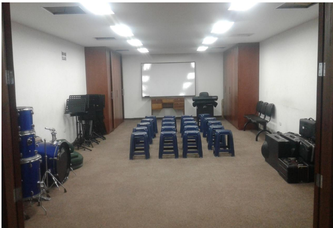
Fotografía 4. Sede escuela de formación Bertha Beatriz Bravo.