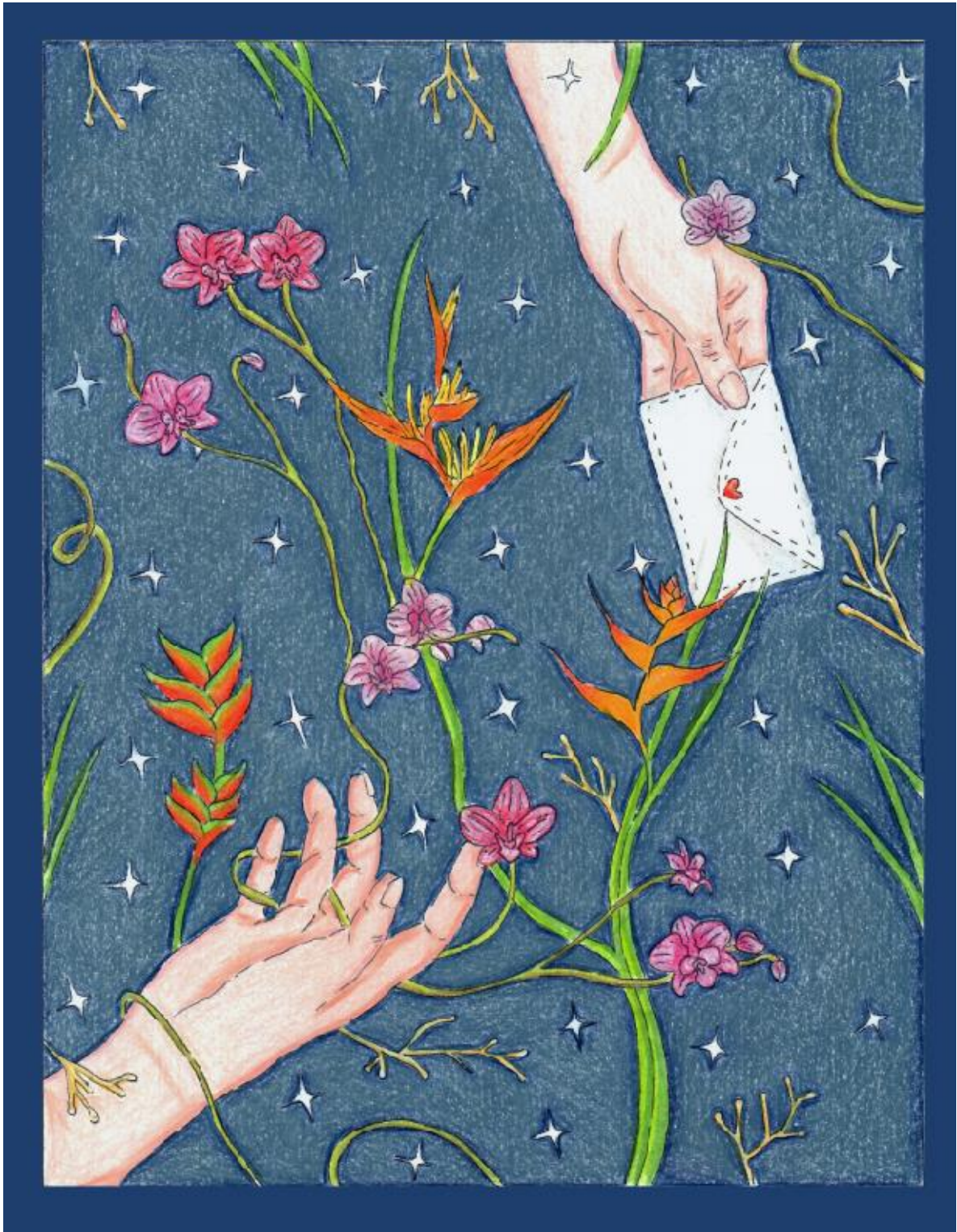
Figura 2. Ilusión. Lápiz de color sobre Cartulina Durex.