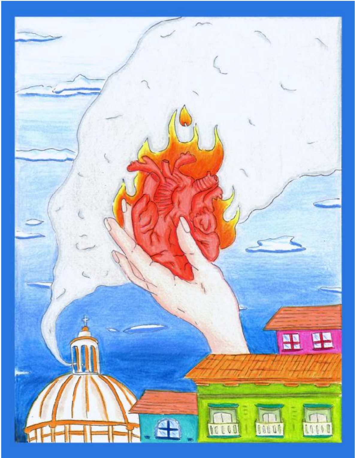
Figura 4. Consumación. Lápiz de color sobre Cartulina Durex.