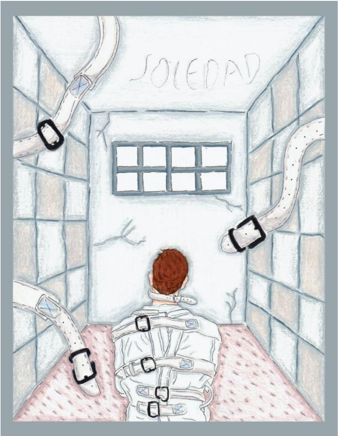
Figura 5. Delirio. Lápiz de color sobre Cartulina Durex.