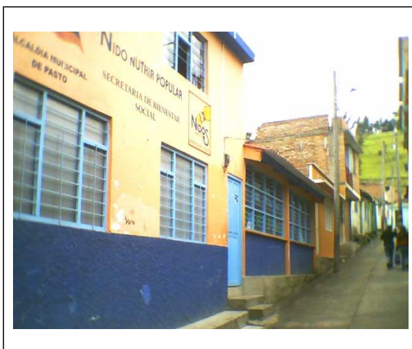
Figura 19. Edificación Centro odontológico “Mis Kikes”. Barrio Arnulfo Guerrero.