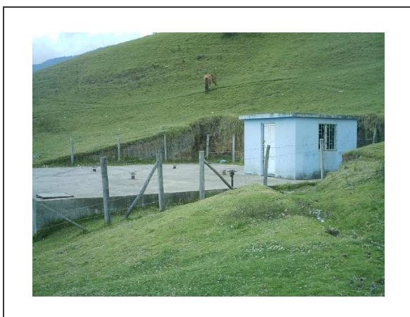
Figura 16. Tanque de abastecimiento de agua Barrio Popular