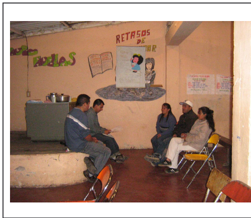
Figura 6. Líderes y lideresas Barrio Popular.