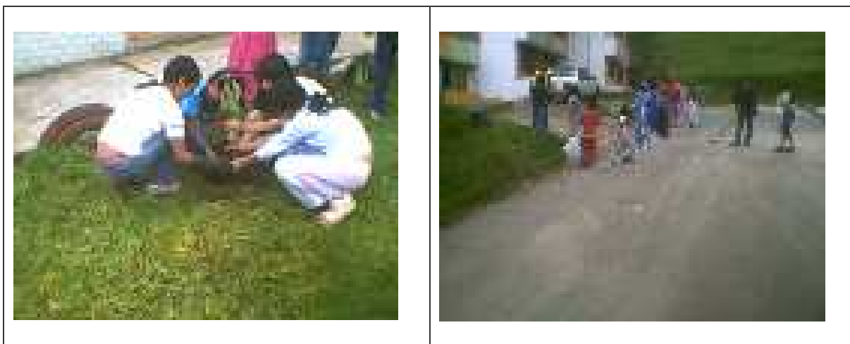
Figura 21. Personas participantes de las mingas. Barrio Arnulfo Guerrero.