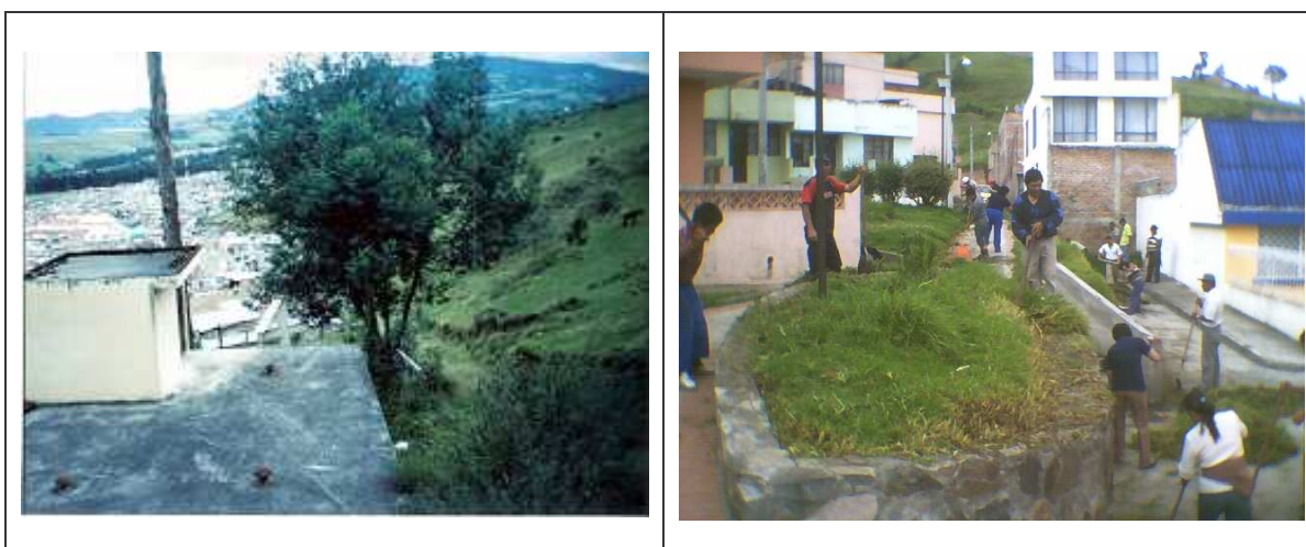
Figura 11. Trabajo comunitario en mingas. Barrio Arnulfo Guerrero.