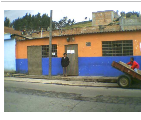
Figura 8. Salón Comunal Barrio Popular.