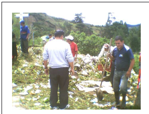
Figura 14. Ladera del río Barrio Popular.