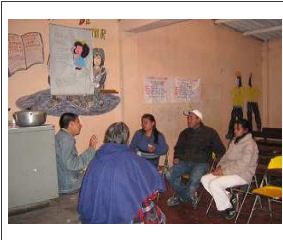
Figura 22. Líderes y lideresas del barrio Popular.