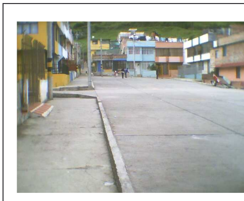
Figura 12. Plazoleta Barrio Arnulfo Guerrero.