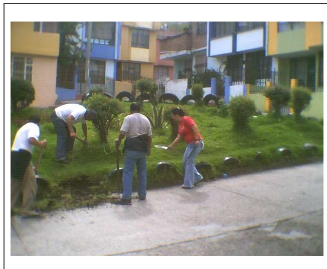
Figura 5. Líderes en minga, Barrio Arnulfo Guerrero.

La formación de líderes y lideresas del barrio ha abierto caminos para la realización de proyectos y propuestas acogidas por entidades gubernamentales y no gubernamentales; la comunidad apoyando los diferentes procesos, procura ser incluida en la búsqueda de mayor participación política y generación de empleo mediante procesos autónomos locales. Lo anterior se relaciona con lo planteado por la teoría del desarrollo como libertad, que para Amartya Sen, es un proceso de expansión de las libertades reales de que disfrutan los individuos. El PNB (Producto Nacional Bruto) es importante pero las libertades dependen de instituciones sociales y económicas (educación, salud). Así como de los derechos políticos y humanos (debates públicos “participación”). Es decir los líderes comunitarios participan de procesos formativos laborales (formación de microempresas) y en política (Constitución Política Colombiana), quedando el sector comunal relegado de algunos espacios de participación en los que se puede vincular mayor población y así fortalecer procesos comunitarios y formativos de las localidades.