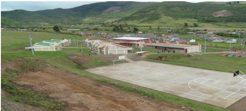
Figura 1: Institución Educativa Municipal Ciudadela de Paz, sede La Magdalena.