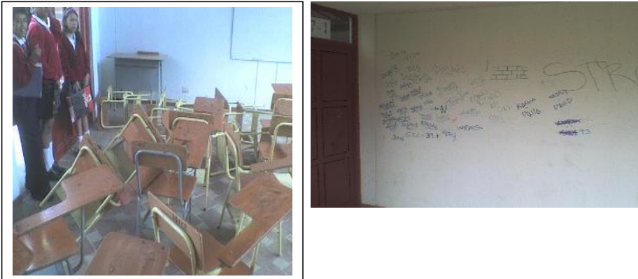
Figura 2. Estado del mobiliario y los salones de clase.