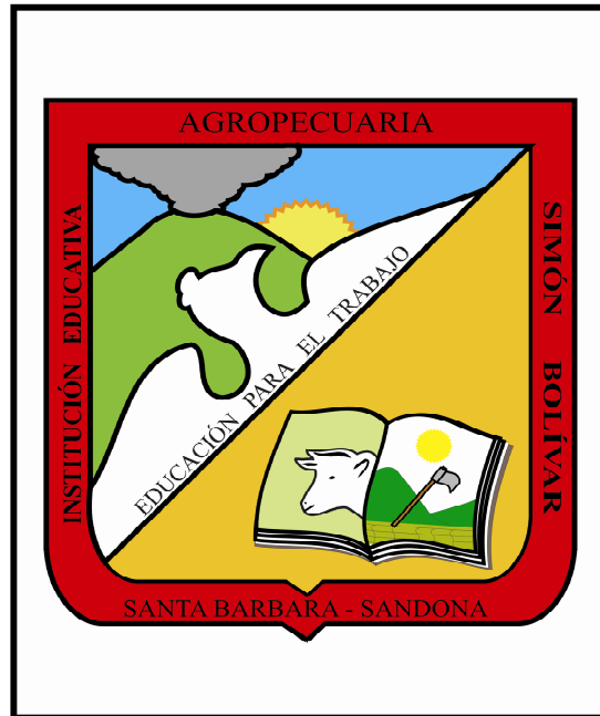
Figura 8. Escudo de la I.E.A. Simón Bolívar

1.6.2 Marco de Antecedentes. Haciendo una exhaustiva revisión se encontró escasa investigación específica sobre las relaciones interpersonales entre pares y adultos; por lo cual se cree oportuno satisfacer la necesidad investigativa, pues, se contribuirá a mejorar dichas relaciones de este tipo, sin embargo se encontraron estudios que tocan el tema desde un enfoque diferente y relacionado con esta problemática: