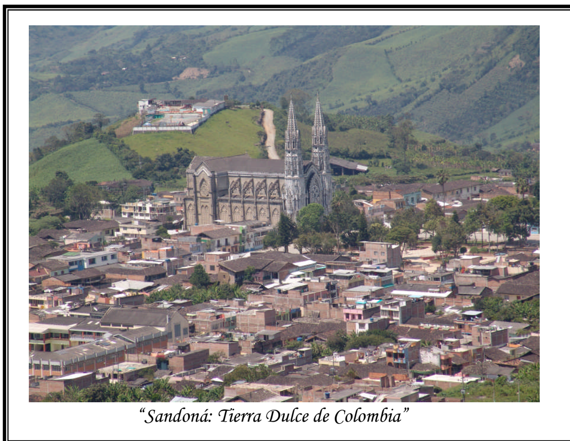
Figura 3. Marco Contextual, Sandoná mi pueblo

La creación del Municipio fue autorizada por Ordenanza 033 de 1868, erigiéndose en 1869 con el nombre de Distrito de Mosquera, en 1876, se cambió por Distrito del Rosario y en 1880 tomo el nombre de Llanos de Sandoná 3