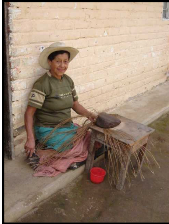
Elaboración de Sombrero de Paja Toquilla