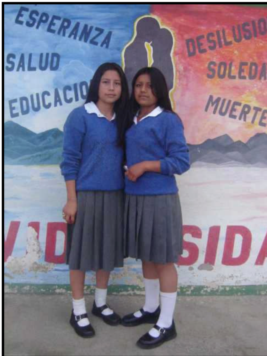
Figura 2. Estudiantes de la Institución