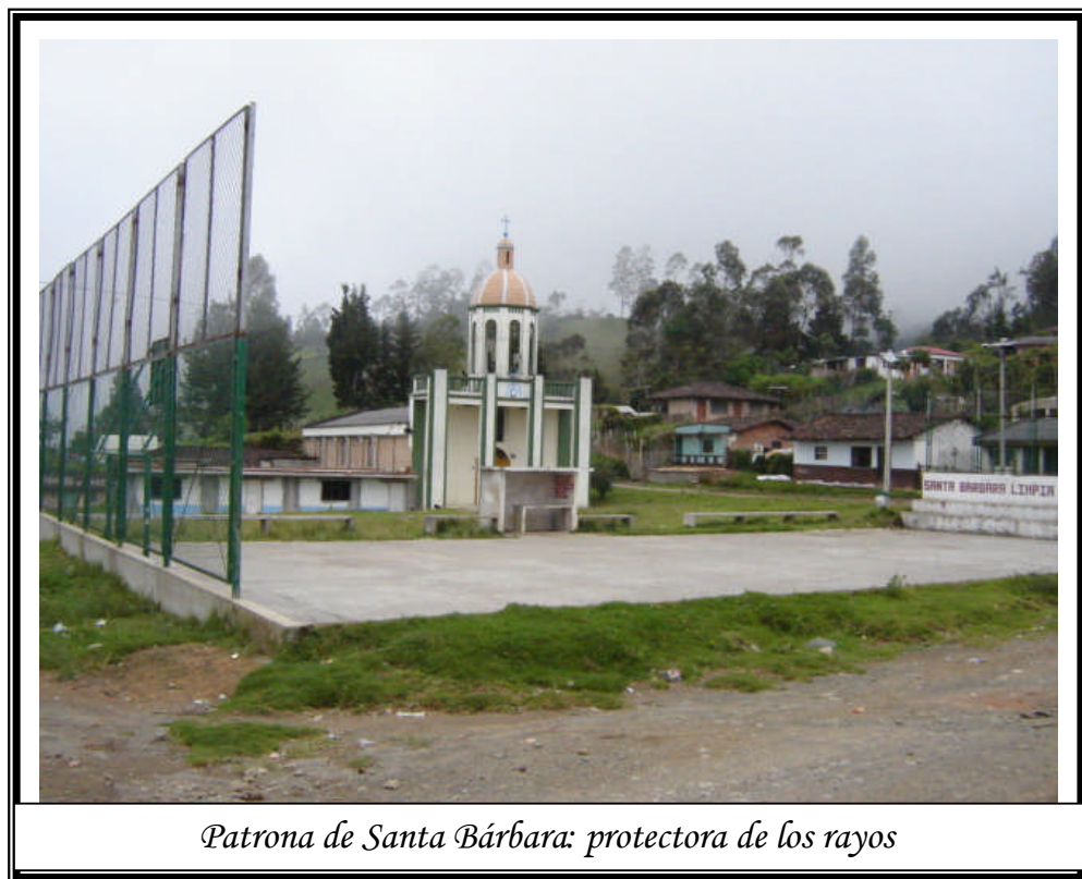
Figura 6. Iglesia Santa Bárbara