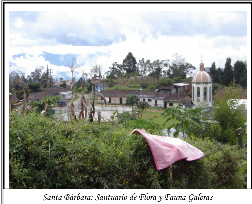
Figura 5. Corregimiento de Santa Bárbara

Santa Bárbara es un corregimiento del municipio de Sandoná que se extiende en una superficie aproximada de 1.600 hectáreas, conformada esencialmente por una pequeña planicie localizada a 2.500 metros sobre el nivel del mar, comprendida entre la quebrada Santa Rosa y el río Chacaguaico.