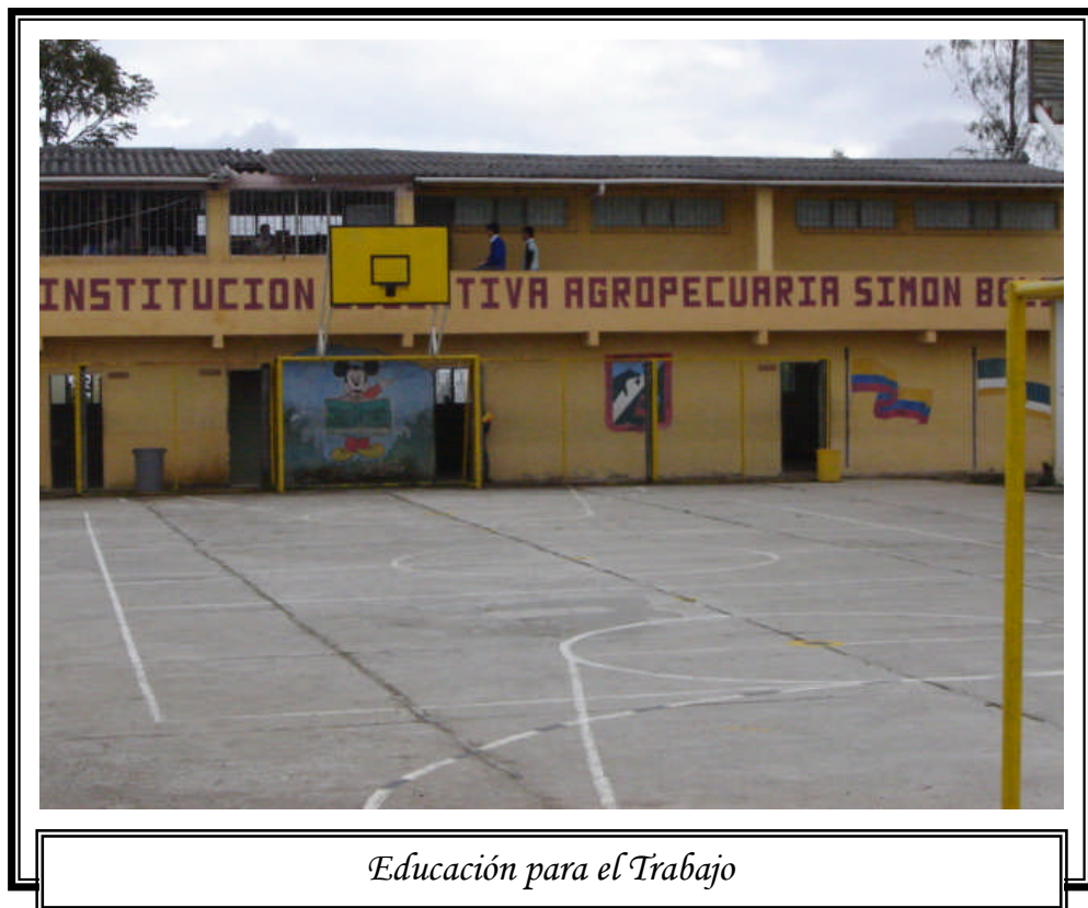
Figura 1. Institución Educativa Agropecuaria Simón Bolívar

Relaciones interpersonales de los adolescentes de 15 a 18 años con pares y adultos de la Institución Educativa Agropecuaria Simón Bolívar del Corregimiento Santa Bárbara del municipio de Sandoná.