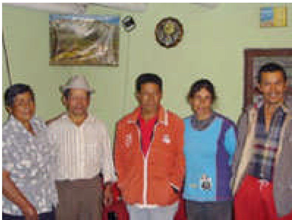
Figura 9. Familia Campesina de Santa Bárbara

Los estudiantes manifiestan básicamente dos tipos de inclinaciones en torno a su familia. Por una parte aquellas que se relacionan a su propio bienestar brindándoles apoyo y consejos y aquellas en las que hacen una serie de requerimientos en cuando al cumplimiento riguroso de la normatividad. Estos son los testimonios de algunos adolescentes.