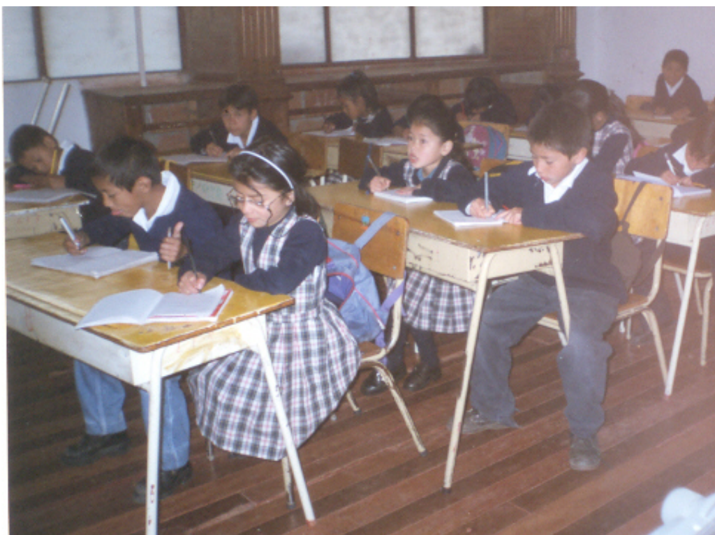
Figura 5. Estudiante en el aula de clases