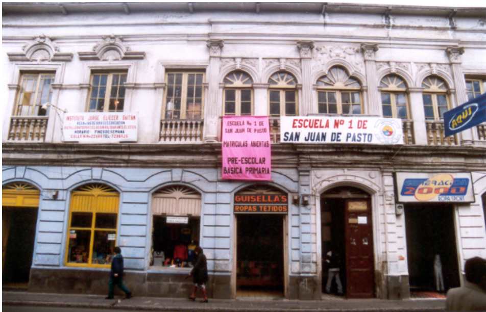
Figura 1. Portada Escuela No. 1 de San Juan de Pasto