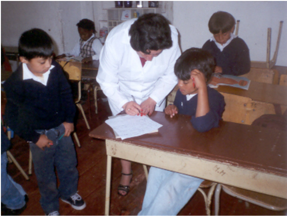
Figura 3. Escenario del saber