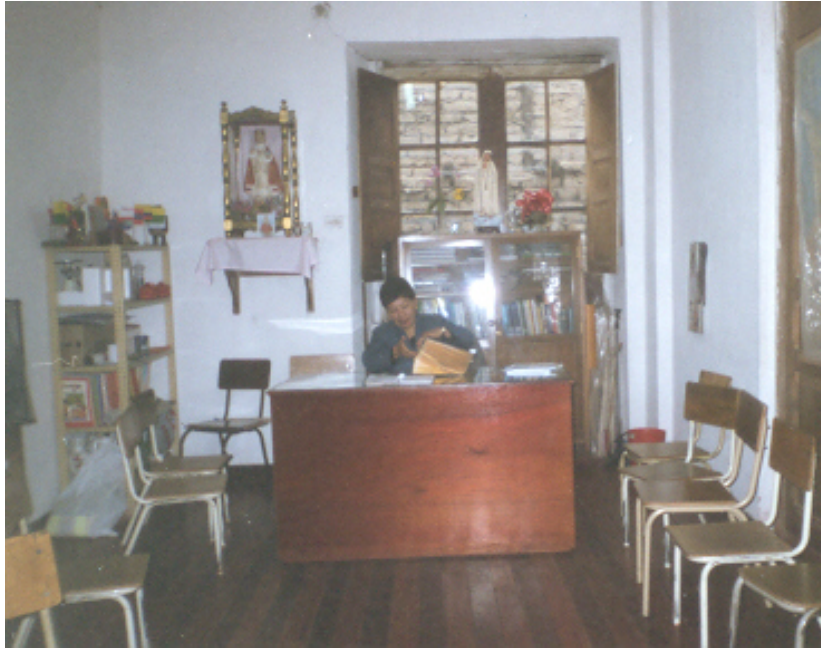
Figura 4. Directora de la Institución