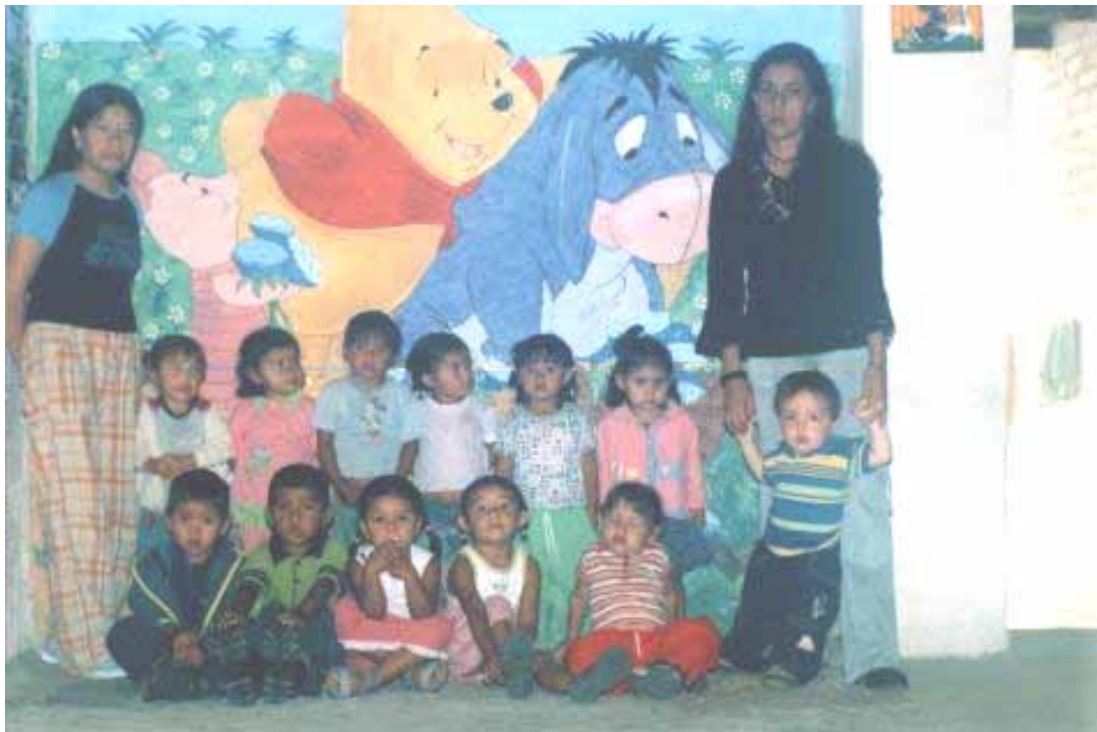
Figura No. 5: Fotografía: Niños usuarios que hicieron parte del proyecto

EVALUACION: En este taller se busco descubrir el autentico sentido e importancia de la persona para la realización personal y ayuda del grupo.