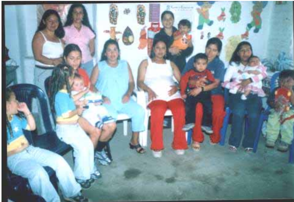
Figura No. 4: Fotografía: Madres usuarias participantes de los talleres

cumplió con el 4º objetivo de la pasantía ya que se motivó de manera permanente a las Madres Comunitarias y fueron ellas mismas las que se concientizaron de la importancia de participar, y con esto se contribuyó a organizar un grupo sólido que tiene como perspectiva y aspiración mejorar la calidad de vida enfocándola hacia un horizonte de desarrollo y superación, que ayude a resaltar su importancia como persona social y que sea valorada en su ambiente familiar, laboral y comunitario.