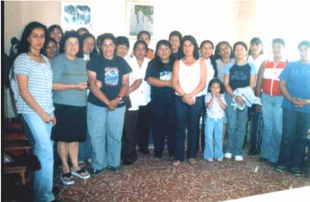
Figura No. 3: Fotografía: Madres comunitarias participantes de los talleres

solución. Y se concluyó que la mejor solución es participar en los talleres para obtener una organización y un buen desempeño de las labores.