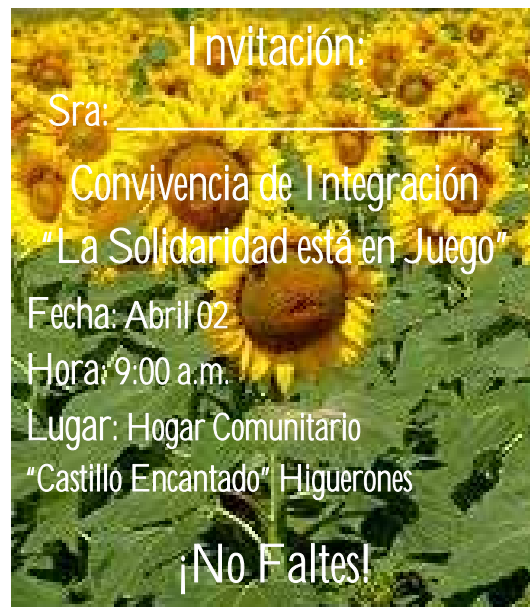
Figura No. 6: Tarjeta: Invitación a la convivencia de integración