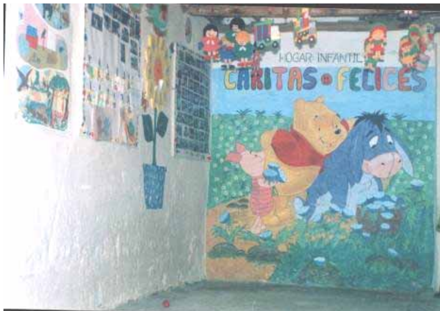
Figura No. 2: Fotografía: Decoración hogares comunitarios