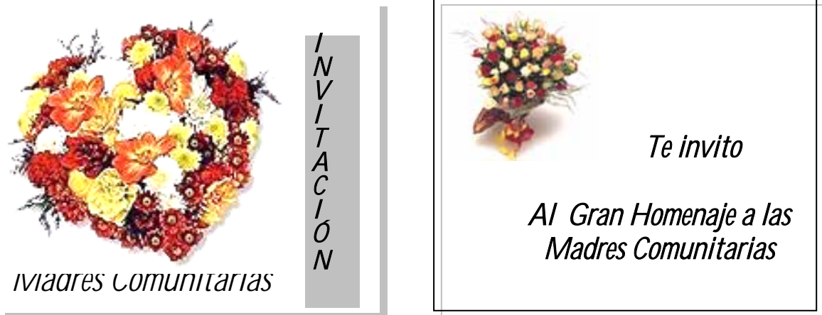
Figura No. 7: Tarjeta: Invitación al homenaje a la Madre Comunitaria

EVALUACIÓN: Resaltar que las personas forman grupos y se reúnen con propósitos comunes y se comunican para lograrlo.