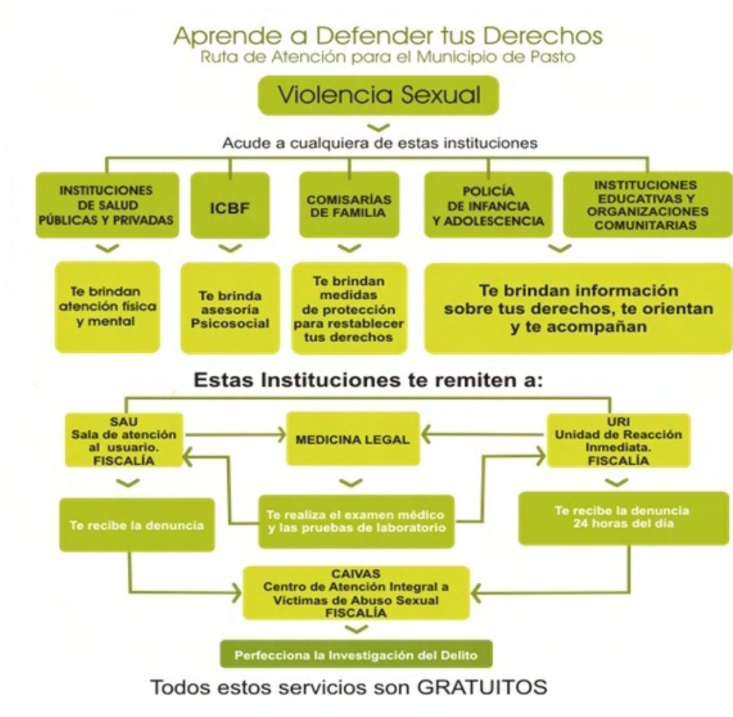
Figura 3. Ruta de Atención – Violencia Sexual