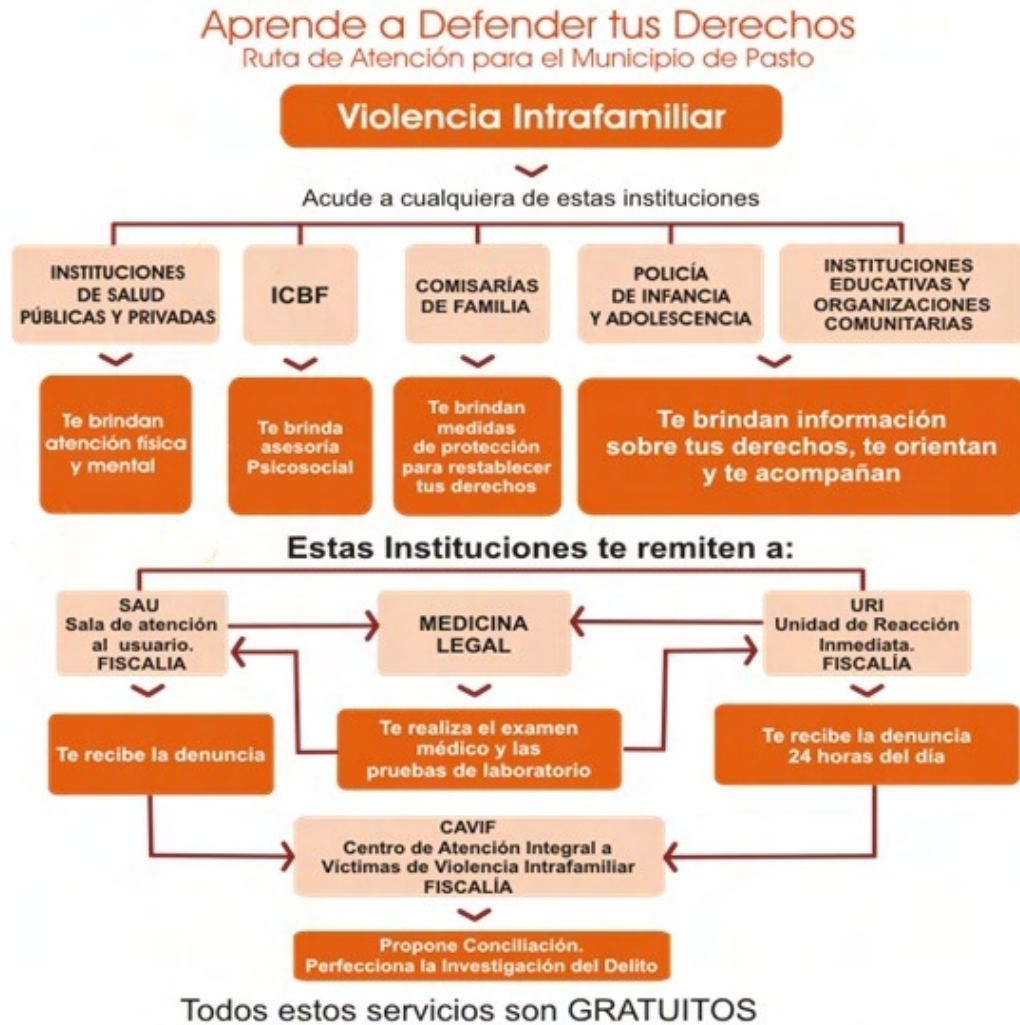
Figura 2. Ruta de Atención – Violencia Intrafamiliar