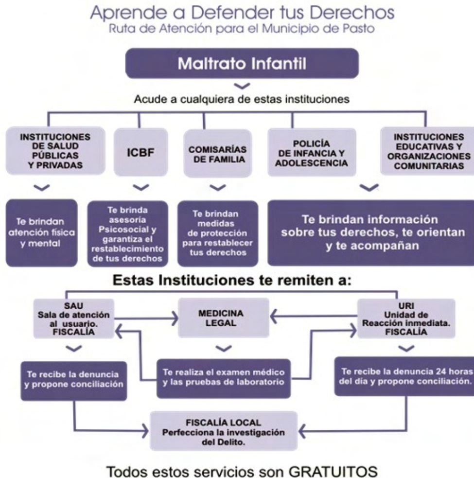
Figura 4. Ruta de Atención – Maltrato Infantil